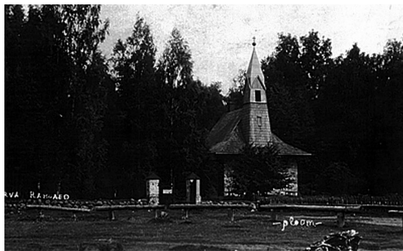
Endisaegne Helme kalmistu kabel