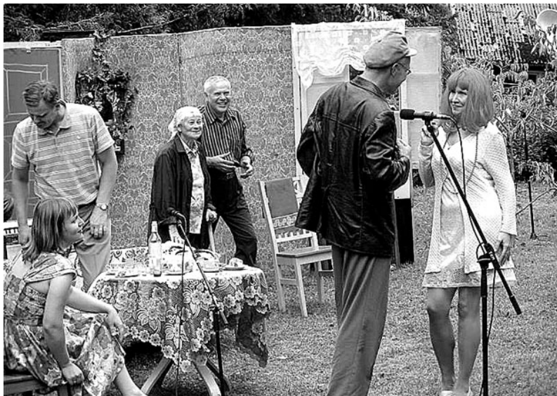
Stseenid näidendist «Valgete pilvede lend»