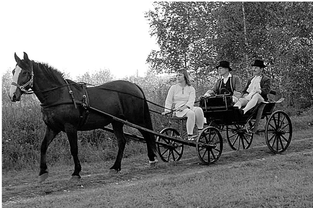
Kutsar ja mõisnik on alustanud orja otsimist.