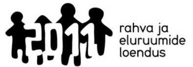
rahva ja eluruumide loendus

„Rahvaloenduse töökohad on väga atraktiivsed juba ainuüksi nii-