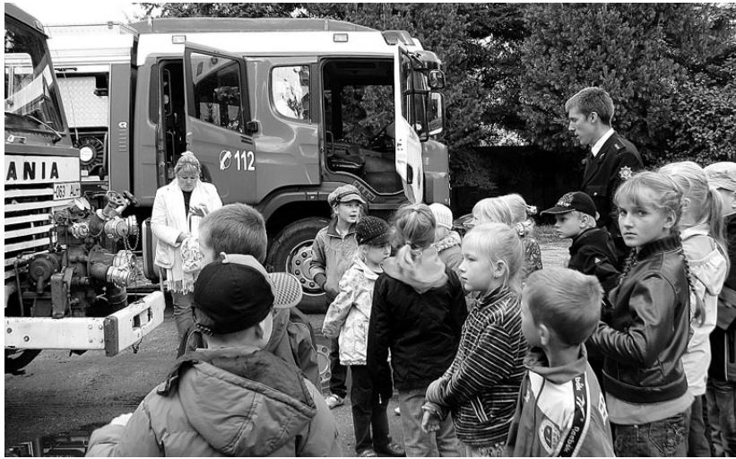
Ritsu lapsed uudistavad tule- tõeautosid.