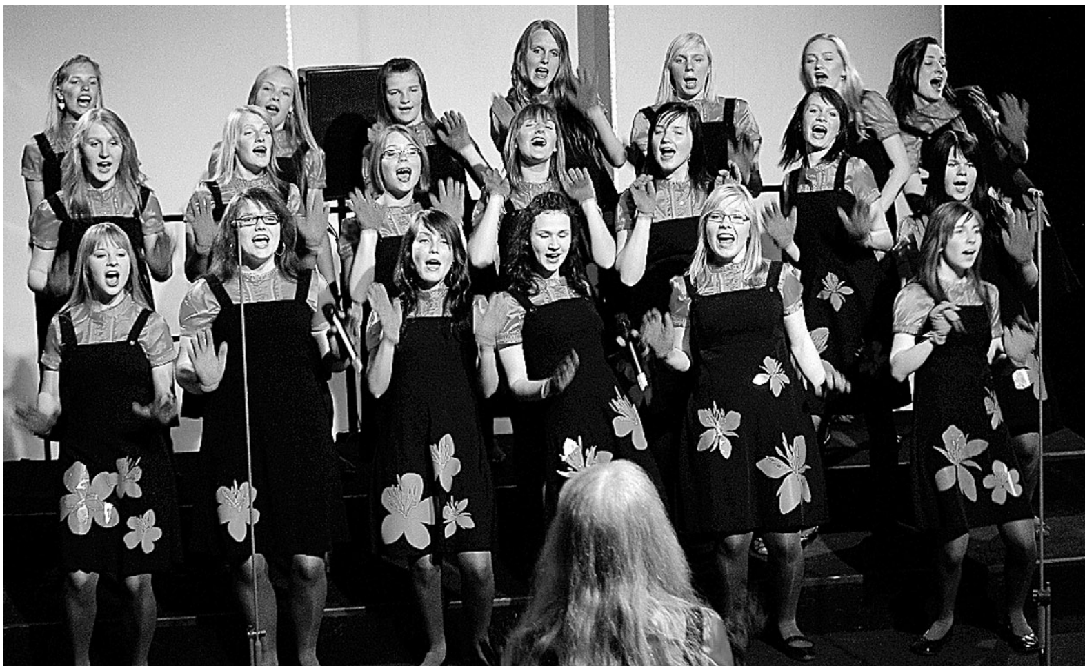
Tõrva laulustuudio neidudekoor «Laululahingu» finaalsaates.

Täname fänne ja Tõrva linna ilusa vastu võtu eest. Politsei vilkuvate tulede saatel linna sõites tuli küll tõelise staari tunne peale. Võimas ilutulestik äratas kogu linna, oleks olnud justkui teine uusaasta.