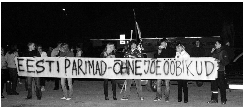
Kodulinn tervitas öösel koju saabunud koori kui Eesti parimaid Õhne jõe ööbikuid.