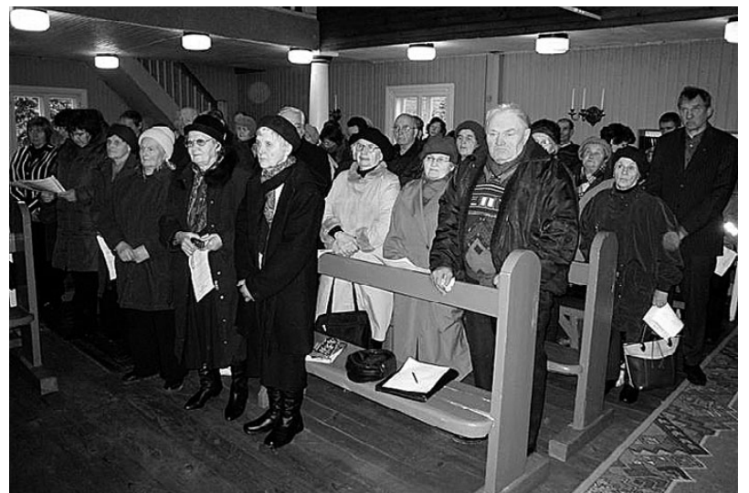
Helme kihelkonna 680. aastapäevale pühendatud jumalateenistusele oli tulnud rahvast lähemalt ja kaugemalt.

Algsed Mulgimaa kihelkonnad olid Helme, Karksi, Halliste, Paistu ja Tarvastu. Kuid kunagise Suur-Mulgimaa valdustesse kuulus ka Viljandi linn koos ümberkaudsete aladega.