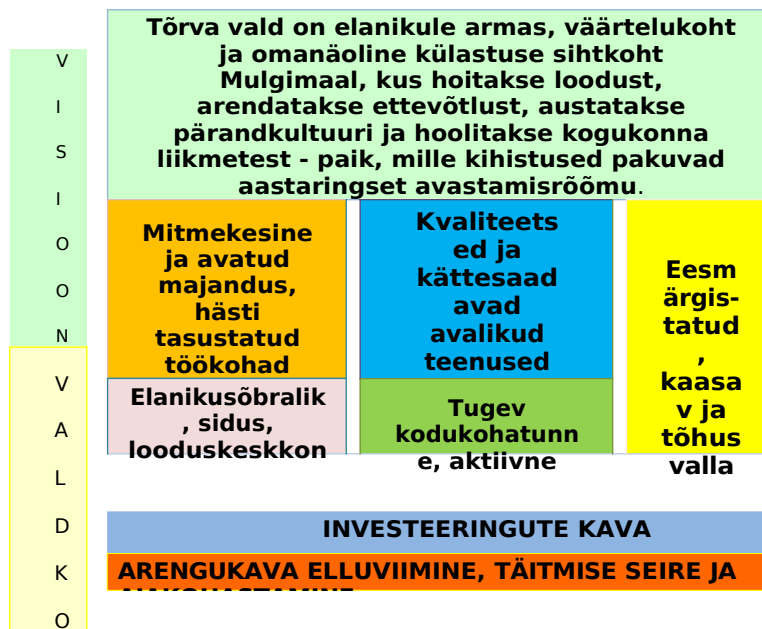
Joonis 2. Tõrva valla arendamise mudel.

Tõrva valla arendustegevus põhineb kõiki valdkondi hõlmava tasakaalustatud mudeli elluviimisel (joonis 2). Mudel koosneb püstitatud visioonist aastaks 2030+ ning viiest omavahel integreeritud valdkonnast. Iga valdkonna all püstitatakse eesmärgid, määratletakse mõõdikud eesmärkide saavutamise hindamiseks ning esitatakse tegevussuunad ja tegevused. Tegevussuundade ja tegevuste täpsem sisu, vastutajad ja tähtajad lepitakse kokku vallavalitsuse igapäevase töö korraldamise käigus. Arengukavas tuuakse välja prioriteetsed investeeringud järgmiseks viieks aastaks, mis on ühtlasi sisendiks Tõrva valla eelarvestrateegiasse.