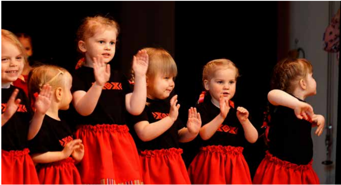
Lasteaed Mõmmiku emadepäevale pühendatud koguperepeost „Üits vahva Mulgipidu“ sai osa ligi 400 tõrvakat.

9. mai õhtul toimus ajaloolises Mulgi kuurordis Tõrvas, Tõrva Gümnaasiumi saalis lasteaed Mõmmiku emadepäevale pühendatud koguperepidu „Üits vahva Mulgipidu“. Peo eesmärk oli tutvustada rahvakultuuri väärtust läbi tuntud Mulgimaa laulude, tantsude, pillimängu ja sümbolika. Kõige väiksemad