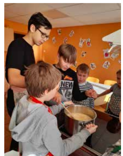
Kokandustund Ala koolis

12 aastat on möödunud kui linnutiivul. Tahaks öelda, et see teekond on olnud vaid lilleline, kuid nagu elus ikka, tuleb kõike teele ette. Sellel kevadel lõpetavat 102. lendu võib vist nimetada koroonalasteks, sest eelmise olulise etapi lõpp nende haridusteel jäi just sellesse aega, kui enamus koolitar-