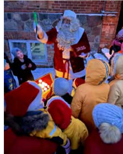
Hummulis peetakse au sees üheskoos tähtpäevade tähistamist.

päev, mardi- ja kadritrall, adventihommikud, Eesti kirjanduse päeva tähistamine, sõbrapäev ja palju muud. Aktiivset liikumist pakkusid tantsuvahetunnid, mida eriti nautisid maja noorimad ehk mudilased ja esimese kooliastme õpilased. Samuti olid populaarsed päkapiku- ja munajaht. Oh seda rõõmu ja elevust, mida need üritused lastele pakkusid!