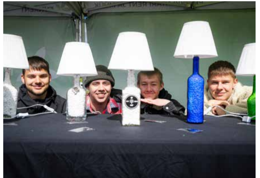
Õpilasfirma AMP tooted on pidevas arendamises ning noormehed püüdleval üha uute ja nutikamate lahenduste poole.

Tõrva Gümnaasiumis on palju ettevõtlike noori: ühed on head spordis ja aineolümpiaadidel, teised tegelevad näitlemise, ettevõtluse ja muude põnevate hobidega.