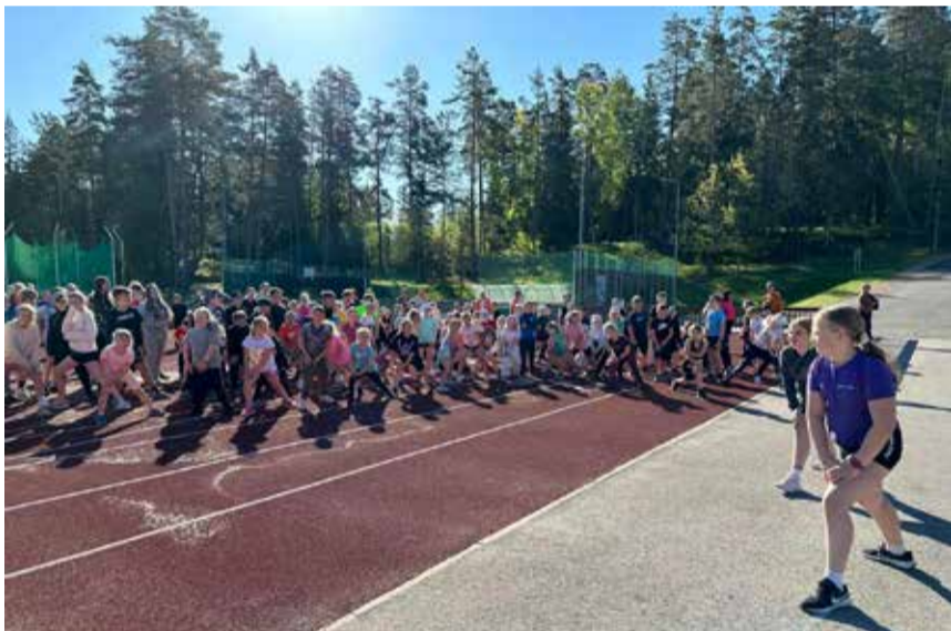
Suur spordipäev Tõrva gümnaasiumis

tegevustele, sealhulgas õppekäikudele ja teatrikülastustele. Need tegevused aitasid kaasa õpilaste pädevuste laiapõhjalisele arendamisele, pakkudes praktilisi kogemusi ja rikastades õppekava mitmekülgsete tegevustega.