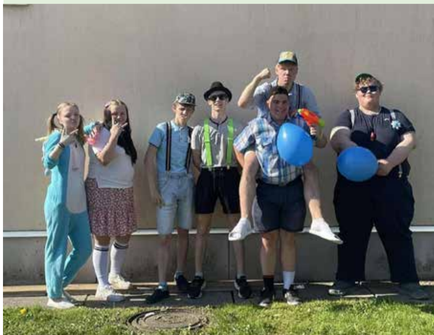
Riidaja kooli lõpetajad lustimas koos viimase koolikellaga.