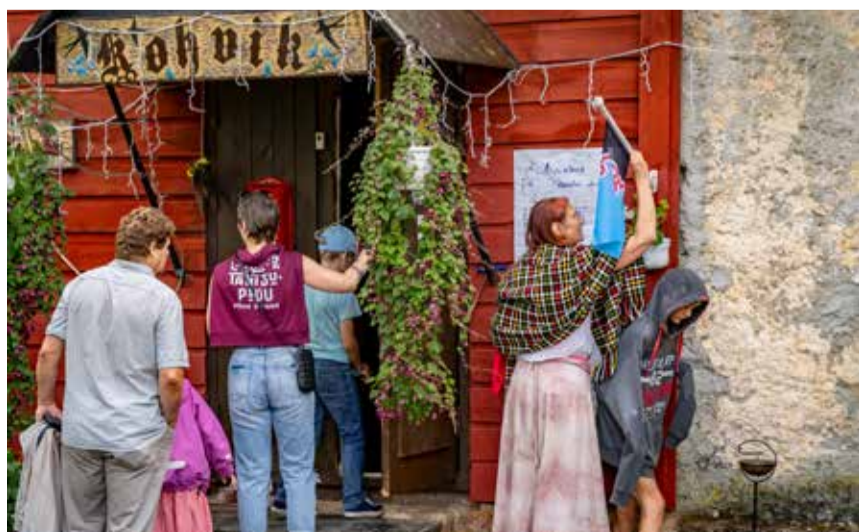
Läinud aastal võõrustas Helme Kihelkonnas Mulgimaa peremängu ka Riidajas asuv kohvik Mäekoda.