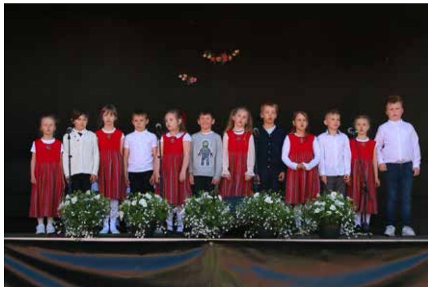
Emadepäevakontsert pakkus rõõmu nii emadele kui ka nauditava esinemiskogemuse lastele.

Emadepäeva kava stsenaarium ja lavastus Maie Kala, konfereerija Oliver Kõvask, lavakaunistus Keskväljaku lillesalong ning helitehnik Jüri Salu.