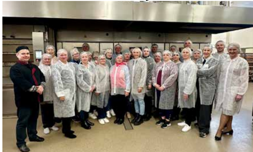
Külaseltside eestvedajad külastamas Hiiumaa Kööki ja Pagarit tehast.