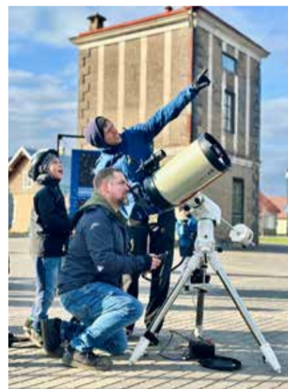
Astronoomiaklubi eestvedajad tutvustamas noorele teadushuvilisele taevakehasid.

Näitus jääb Tõrva keskväljakul ööpäevaringselt avatuks suve lõpuni. Fotod on jäädvustanud Tõrva Astronoomiaklubi liige Taavi Niitsee. Tõrva Astronoomiaklubi on 2018. aastast Tõrva vallas tegutsev ühendus, mille eesmärk on astronoomia populariseerimine.