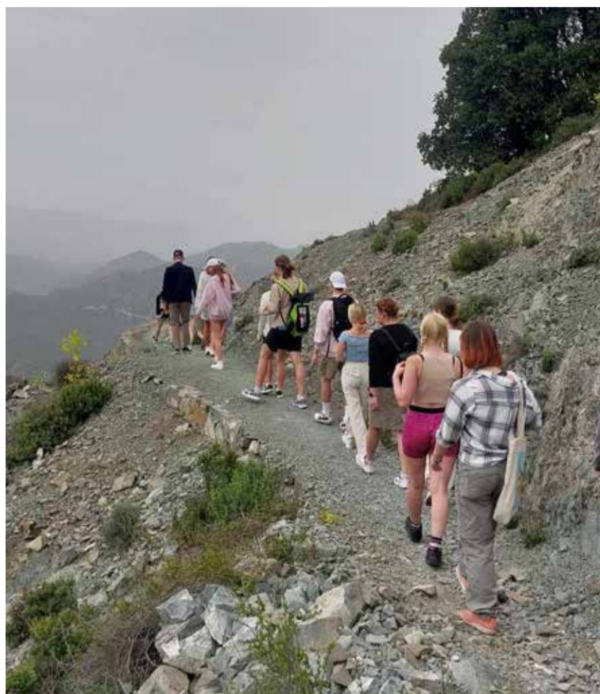
Unustamatu jalgsimatk Agrose mägedes.

Projekti peamine fookus oli vaimse tervise edendamine, kuid samaaegselt avanesid ka võimalused suhelda, õppida uusi oskusi, liikuda ja nautida looduse ilu. Tervislik eluviis on oluline osa noorte heaolust ja eneseteostusest. Küprosel toimunud noortevahetuse raames said programmis osalejad läbi töötubade, vestlusringide ja interaktiivsete tegevuste arendada oma teadmisi ja oskusi tervisesõbraliku elustiili valdkonnas. Enamasti ei oska noored kõiki tegevusi vaimse tervise hoidmisega seostada. Refleksiooni käigus selgus, et liikumine, loodusega kontakti loomine, tasakaalustatud toitumine, loomingulised tegevused ja vaba aja veetmine toredate inimestega ongi ju tegelikult ongi see, mis aitab meie emot-