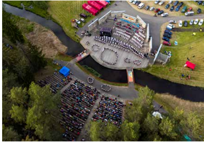
Läinud aastal toimus pidu Valka laululaval, tänavu aga Tõrva Veemõnula välialal.

Kõik toimed ja nähtused muutuvad, täienevad ning uuenevad ajas. Looja looming ja kõige selle edasikandjana: meie lauljad, tantsijad, pillimängijad.