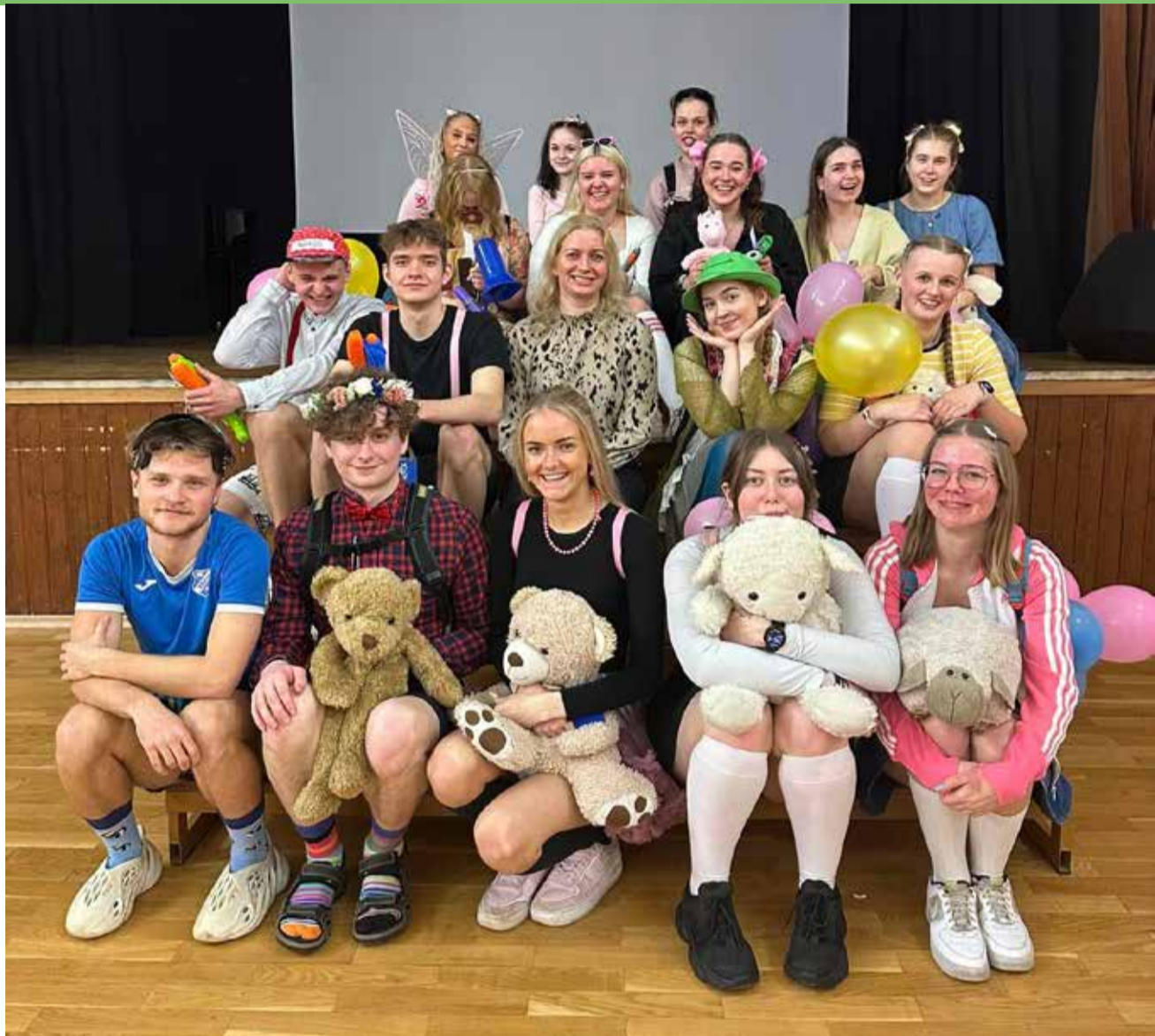
Tutipidu annab abiturientidele enne eksamiperioodi veel korra võimaluse enda esimest kooliaastat meenutada.

Kuuendikega läheb jälle üllatavalt lihtsalt. Saan aru, et mõned noorhärnad otsivad tähelepanu, aga enamasti piisab