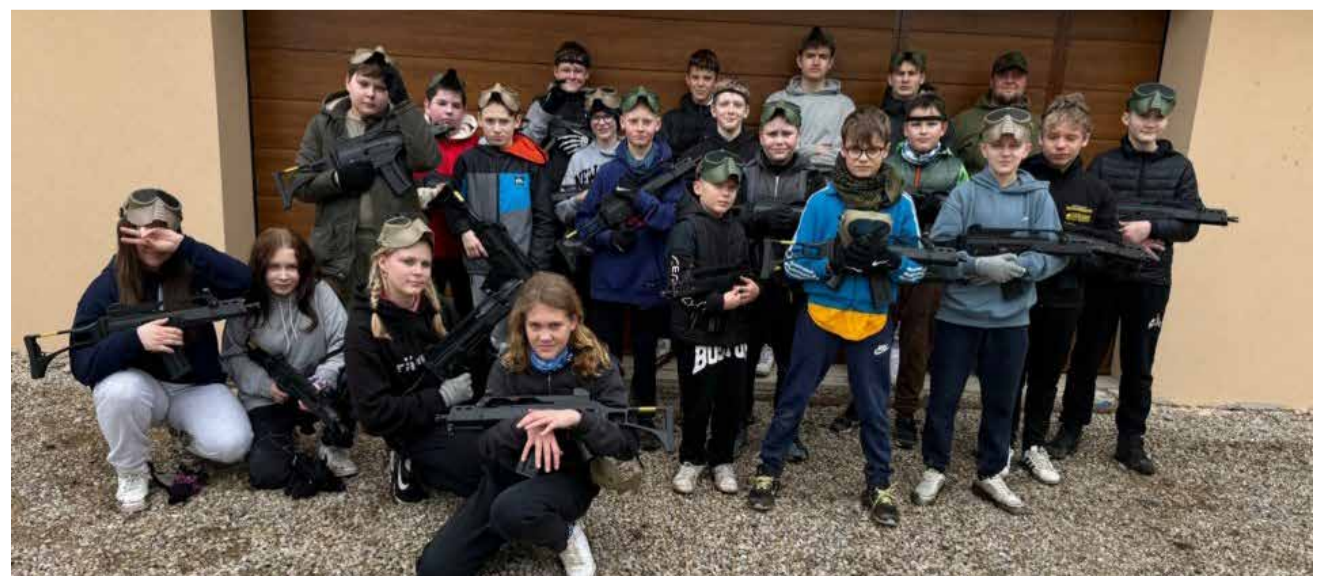
Ühe tänavuse väljasõidu raames said 5. ja 6. õpilased külastada militaar-teemaparki, kus arendasid meeskonnatöö oskusi.