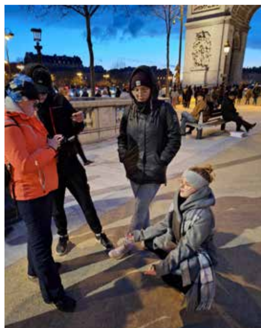
Reisil sai ka meditatsiooniga tegeletud.

Soovid rohkem teada? Võta meiega ühendust Facebooki kaudu või saada e-kiri aadressile mtytapnesilm@gmail.com. Ära jäta kasutamata võimalust kogeda midagi enam!