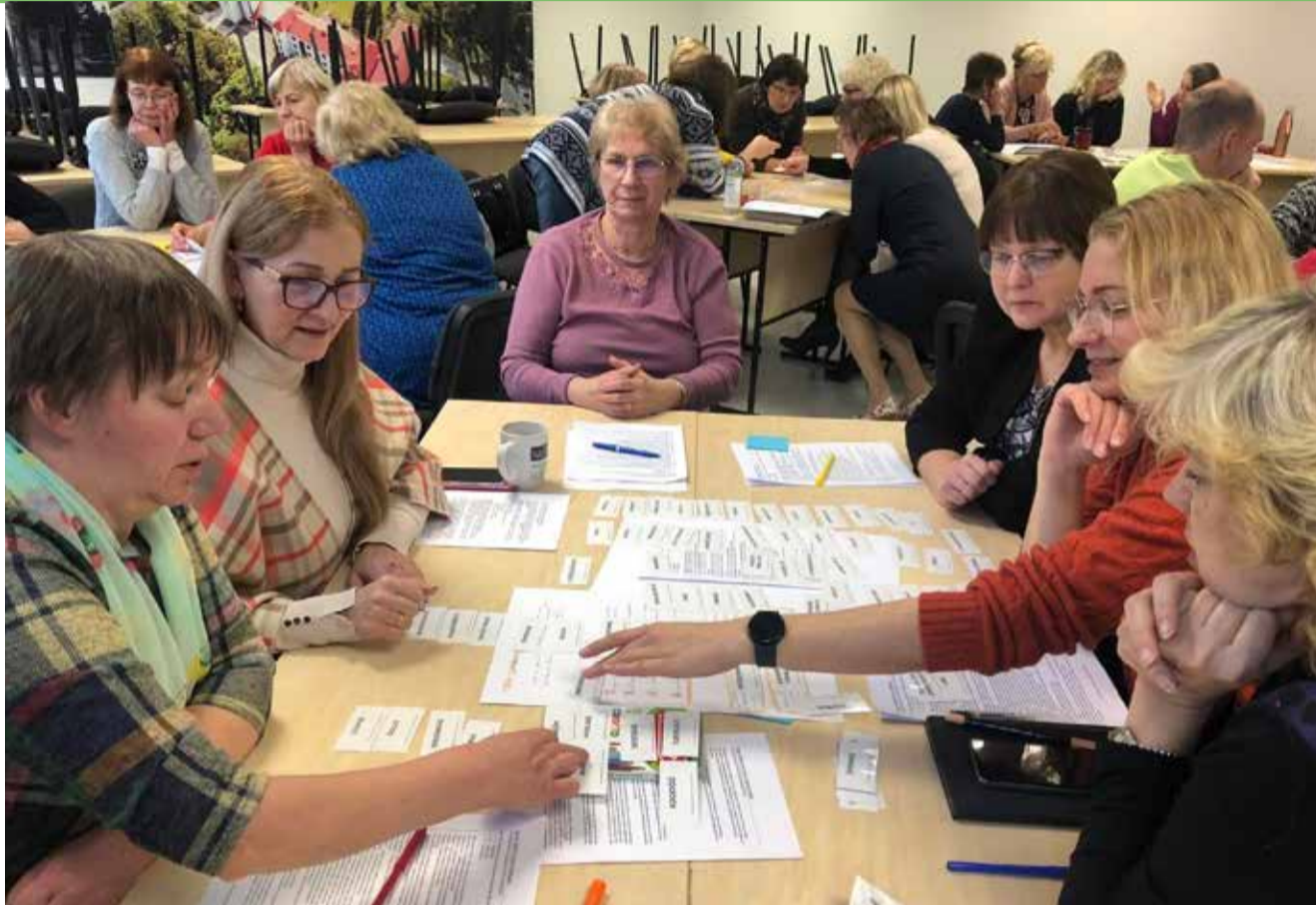
Õpetajad on Tõrvas väga ühtehoidvad ning usinad ennast erialaselt koolitama.