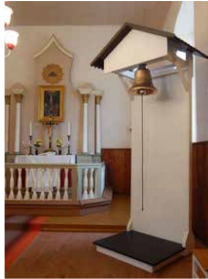
Uus kirikukell on pühitsemiseks üles riputatud ja valmis.

Järve sõnul võib uue kella ostu toetuseks teha ka vastavalt võimalusele rahalise ülekande Eesti Evangeelse Luterliku Kiriku Taagepera Jaani koguduse Swedbanki arveldusarve kontole EE842200221013466795.