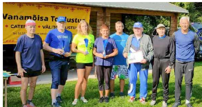
Parimatest parimad said kätte uhked auhinnakarikad.

Seriaali toetasid ja auhinnalauda mitmekesisitasid: The Manor Sports & Spa, Shoomwell OÜ, Tõrva Veemõnula, Tõrva Tarbijate Ühistu, Vanamõisa Toitlustus OÜ, Spordiklubi Viraaž ja Hardo Lust – suured tänud kõigile!