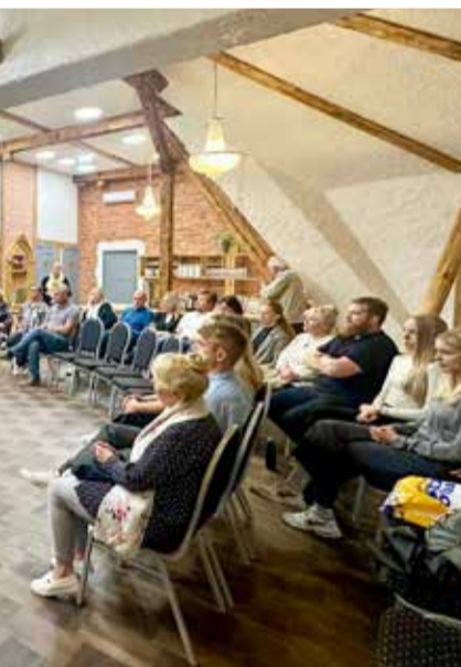
Taageperas oli koos Tõrva valla turisminduse tuumikgrupp.

Tõrva vallas elamisele keskendunud töögrupid - keskkond ja kommunaal, rahvatervis, liikumine ja sport, kogukonnad ja kultuur, haridus ja noorsootöö ning tervishoid ja sotsiaal - toimusid Tõrva vallavalitsuse hoone teise korruse saalis. Esimestel kokkusaamistel keskenduti eelkõige olemasoleva olukorra kaardistamisele ning positiivsete ja negatiivsete aspektide väljatoomisele. Lisaks sõnastati vabas öhkonnas toimunud aruteludes ka valdkonna visioon aastaks 2035. Lehe ilmumise ajaks on kõik ülalnimetatud töögrupid kokku saanud ka teisel korral, mil sõnastati juba konkreetsemaid ettepanekuid ja tegevusi. Kindlasti ei tähenda see seda, et kaasarääkimise aeg on lõppenud - oma mõtteid saab edastada Tõrva valla kodulehel oleva lingi kaudu ning arengukava avaliku väljapaneku ajal on oodatud igasuguse tagasiside.