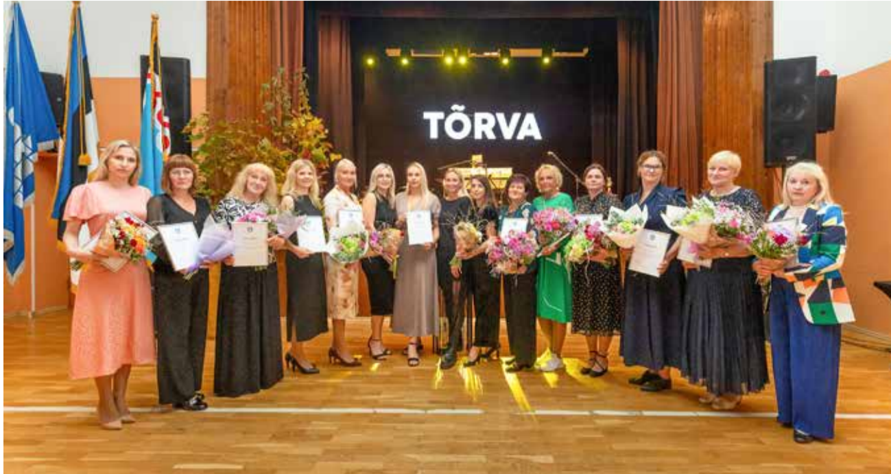
Pidulikul vastuvõtul tunnustati Tõrva valla haridustöötajaid.