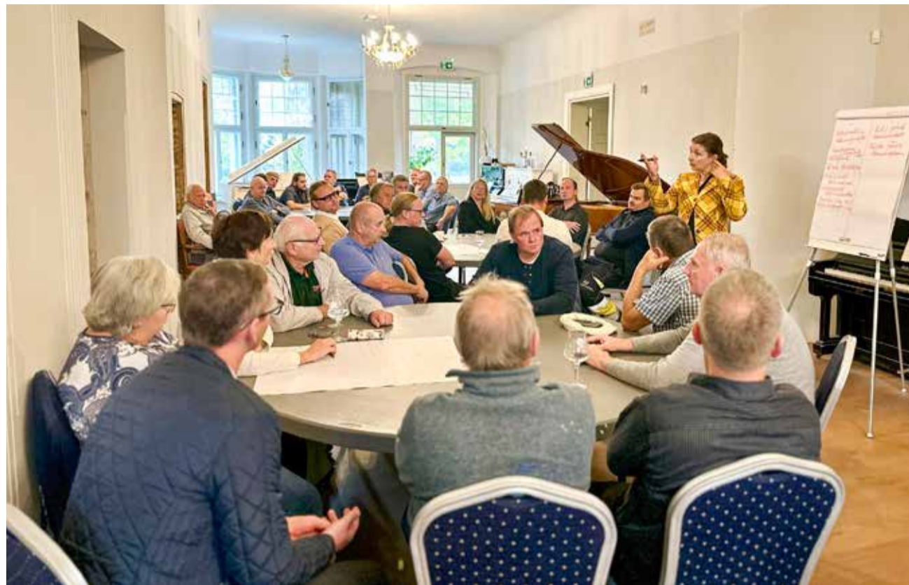
Ettevõtjad kogunesid sedakorda Holdresse klaverite keskele.

T õrva valla arengukava koostamisele on antud hea hoog sisse – erinevates töögruppides tehakse tõsist mõttetööd, kuidas panna paika Tõrva valla eesmärgid lähimateks aastateks.