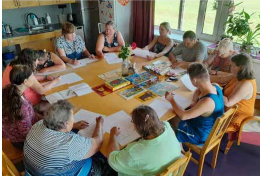
Ühiseid tegevusi on Tõrva Kodu nädalaplannis palju.

Aktiivsusest Tõrva Kodu elanikel puudust ei tule – tegusamate päevaplaani mahub harivaid ja liikuvaid tegevusi küllalt palju. Siiski jääb nii mõnelgi jõudu veel üle, et lüüa kaasa abistavates