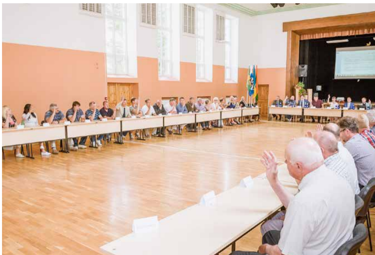
2016. aasta ühisvolikogu oli üksmeelne ning märgilise tähendusega.