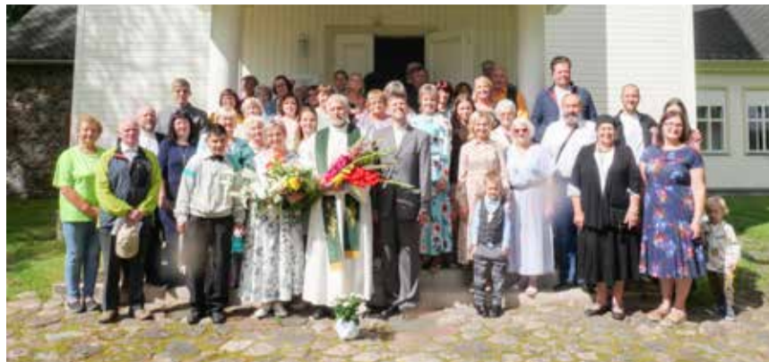
Eesti delegatsiooni ootas Lätis südamlilik vastuvõtt.

Facebookis hakkas silma Karki koguduse 30. aastapäeva kuulutus, kuhu kutusiti osalema 10. augustiks. Karki kirik on veelgi uuem. Karkisse küll rajati kirik 1779. aastal, aga suleti jälle 1823. aastal. Uut kirikut hakati ehitama 1999. aastal endiste parunite kalmistule ja selle kabeli külge. Kiriku ehitamist toetasid Berliini luterlik vabakogudus, Rootsi misjoniorga-