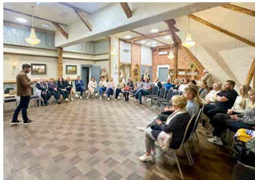
Taageperas oli koos Tõrva valla turisminduse tuumikgrupp.