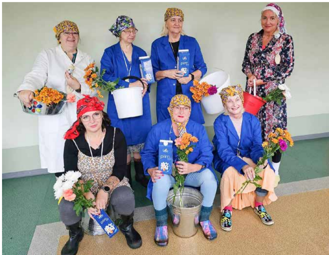
Tõrva Kooli õpetajad veetsid õpetajate päeval lõbusalt aega.

hõlmab võimalikult palju erinevaid liikumisvorme. Lisaks on see ka mängulisem ning arendab suuremal määral liikumisteadlikkust ja -oskust. Kui lapses tekib huvi mõne spordialaga tõsisemalt tegeleda, lisanduvadki erinevad treeningud.