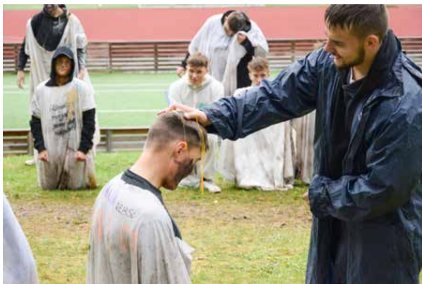
Rebaste ristimise traditsioon ühendab gümnaasiste

Tõrva Kool liitus kiusamise ennetamise programmiga KiVa. See on koolidele suunatud kiusamise ennetamise ja vähendamise programm, mille raames õpetatakse kiusamist ära tundma, nende juhtumitele reageerima ja neid lahendama. KiVa-tundide raames kasvatatakse lastes empaatiat, arendatakse sotsiaalseid oskuseid ja edendatakse sõbralikke grupisuhteid. Kokkuvõttes tähendab enne-