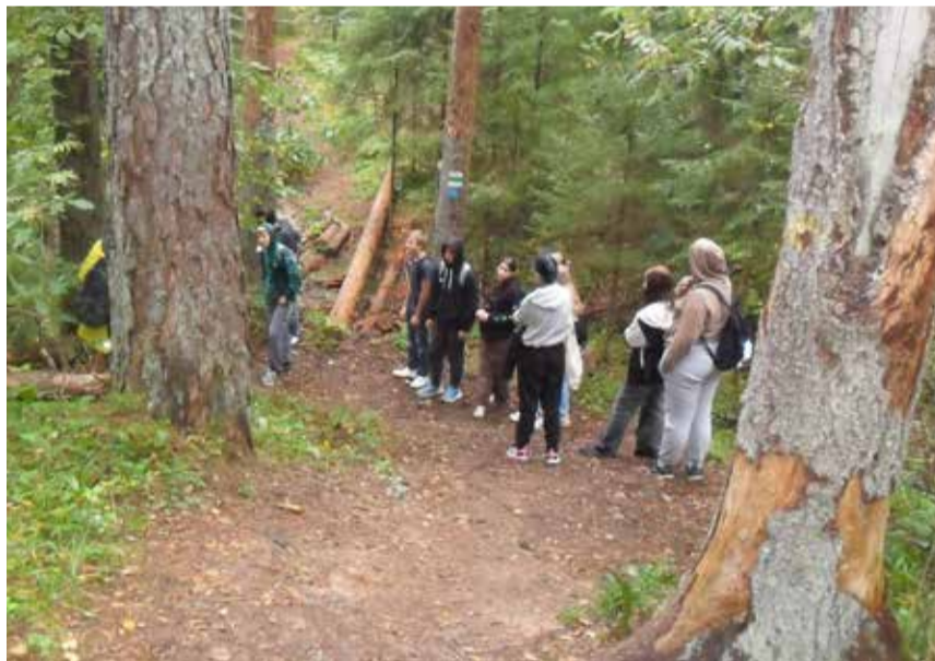
Kiidjärvel toimus ka matkatarkuste õppeprogramm.

Mõtisklesime inimese ja looduse suhetest – kuidas inimene loodust mõjutab ja kuidas see ilma inimeseta hakkama saab. Et õpperada kulgeb looduskaitsealal, pöörasime tähele-