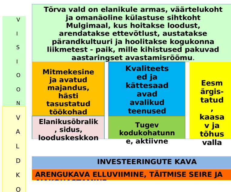
Joonis 2. Tõrva valla arendamise mudel.

Tõrva valla arendustegevus põhineb kõiki valdkondi hõlmava tasakaalustatud mudeli elluviimisel (joonis 2). Mudel koosneb püstitatud visioonist aastaks 2030+ ning viiest omavahel integreeritud valdkonnast. Iga valdkonna all püstitatakse eesmärgid, määratletakse mõõdikud eesmärkide saavutamise hindamiseks ning esitatakse tegevussuunad ja tegevused. Tegevussuundade ja tegevuste täpsem sisu, vastutajad ja tähtajad lepitakse kokku vallavalitsuse igapäevase töö korraldamise käigus. Arengukavas tuuakse välja prioriteetsed investeeringud järgmiseks viieks aastaks, mis on ühtlasi sisendiks Tõrva valla eelarvestrateegiasse.