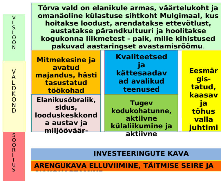
Joonis 2. Tõrva valla arendamise mudel.

Tõrva valla arendustegevus põhineb kõiki valdkondi hõlmava tasakaalustatud mudeli elluviimisel (joonis 2). Mudel koosneb püstitatud visioonist aastaks 2030+ ning viiest omavahel integreeritud valdkonnast. Iga valdkonna all püstitatakse eesmärgid, määratletakse mõõdikud eesmärkide saavutamise hindamiseks ning esitatakse tegevussuunad ja tegevused. Tegevussuundade ja tegevuste täpsem sisu, vastutajad ja tähtajad lepitakse kokku vallavalitsuse igapäevase töö korraldamise käigus. Arengukavas tuuakse välja prioriteetsed investeeringud järgmiseks viieks aastaks, mis on ühtlasi sisendiks Tõrva valla eelarvestrateegiasse.