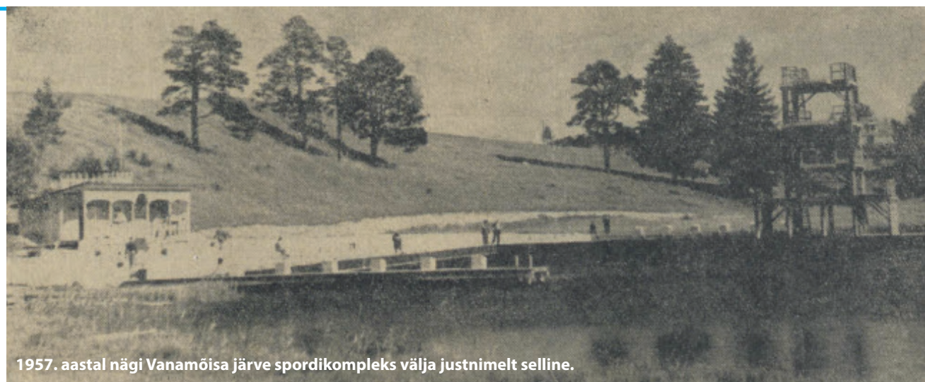
1957. aastal nägi Vanamõisa järve spordikompleksi välja justnimelt selline.