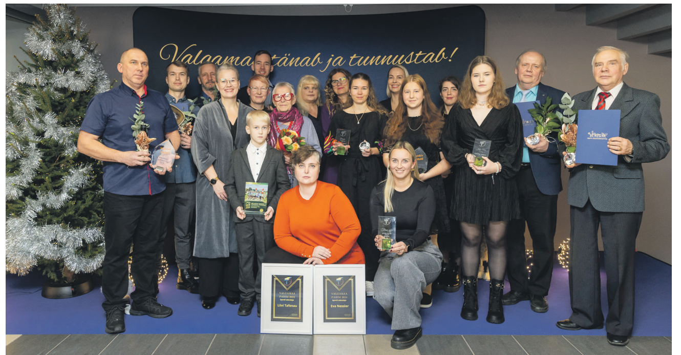
Tõrva valla kultuuri- ja spordiinimesed seisid Valgamaa tänuüritusel nagu kombeks ölg öla kõrval.

Ehk veidigi motivatsiooni annab kulturnikele juurde, et kultuur on eluala, kus rahaliste puudujääkide korvamiseks jagatakse vähemalt diplomeid ja aunimetusi. Viimasel ajal on hakatud sealjuures mär-