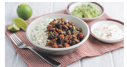
Klassikaline chilli con carne