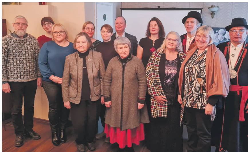
Mulgi sõnaraamatu esitlus.

Raamatu „Suur mulgi sõnaraamat“ trükiversioon võiks ilmalgust näha paari aasta pärast – senikaua saab teda veel täiendada ja parandada. Veebisõnaraamatus on ka nupp „Ettepanekud“: sõnaraamatutegijad kutsuvad üles seda julgelt kasutama.