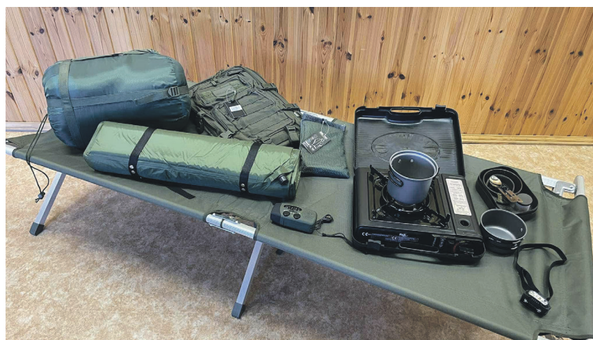
Tegevusvahenditeks saadi rohkelt erinevat matkavarustust.

Suured tänusõnad Ahto Uuspalule Tõrva Päästekomandost, kes aitas toetusprojekti elluviimisele kaasa mõelda.