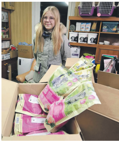
Riidaja lapsed tegid loomade jõulud rõõmsamaks.