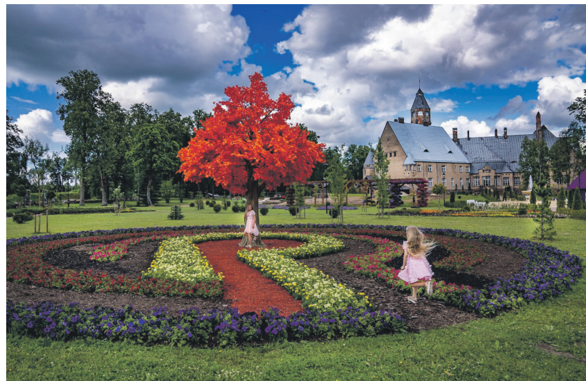
Wagenkülli imedemaa oli suurepärase näide, kuidas ideaalselt sobisid kokku idee, teostus ja turundus.

Ainus põhjust, miks ma ei tõstnud teemat viie parema hulka, on see, et kahe aastaga ei ole liiga palju uusi liikumisi esile tõusnud. Quo vadis, Helme? Meie piirkonna kõige pikaajalisema ja kuulsusrikka aialooga kants elab justkui täielikus vaikuses. Kas 15 aastat tagasi valdade ühinemise teemadel päris jõuliselt mängu dikteerinud Helme vald ja selle nimi mitte ainult ei hakka tasahilju oma sära kaotama, vaid saab niimoodi jätkates pelgalt reaks ajalooürikutes? Ma väga loodan, et Helme tõuseb taas rohkem pildile ja seega