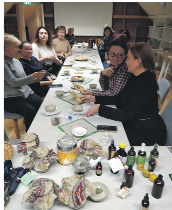
Programm „Tervis ja vägi Mulgimaa taimedest“.

Tänu meie külastajuhil Jaanika Toome kokkupanud marsruutidele külastasid grupid üle Mulgimaa ligi 70 väikeettevõtjat. Nende seas olid talud, külamaad, mõisad, kirikud, häärberid ja lossid. Kokku käis nendel külastustel pea 1200 inimest, kes kõik jätsid Mulgimaale otseselt kuni 100 000 eurot tulu, mis sisaldab