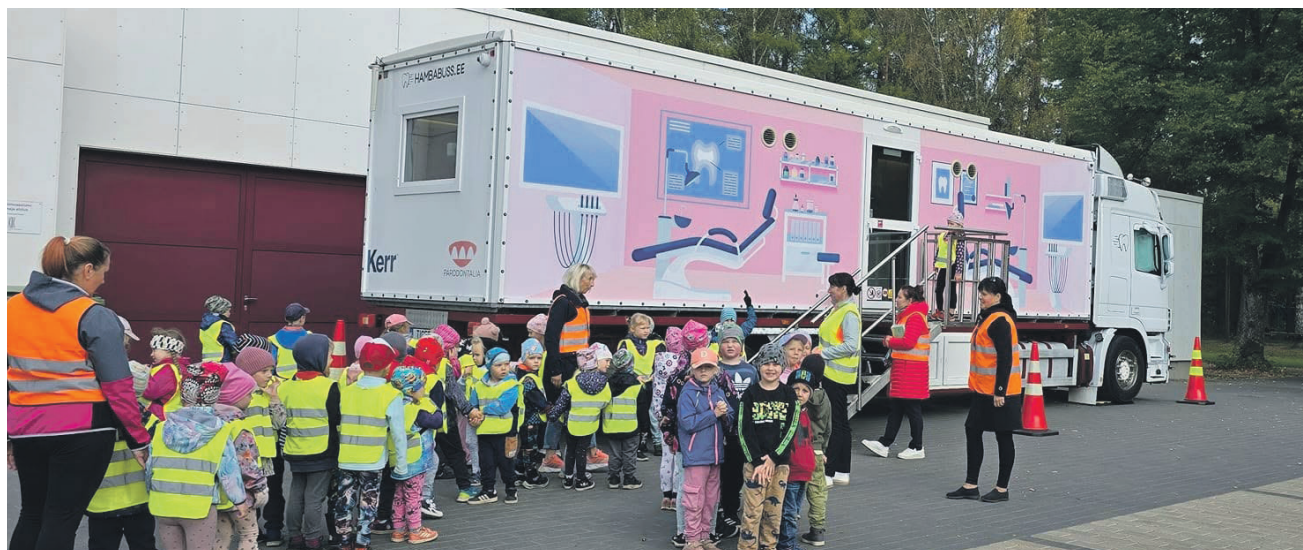
Mobiilsed meditsiinikabinetid on võimalus tiptasemel meditsiini tuua igasse Eestimaa paika. Fotol Tõrva laste jaoks kohale sõitnud hambabuss.

Tänavu on valimiste aasta ja üks kriitikaämbrid juba on nurgast välja võetud ning äramärkimist väärivat materjali vaikselt koguneb. Samas on aegade jooksul Tõrva poliitika aktiivselt kaasa löövad inimesed (ükskõik, millist pooltust nad esindavad) jäänud vägagi viisakateks