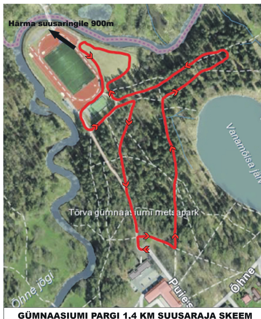
GÜMNAASIUMI PARGI 1,4 KM SUUSARAJA SKEEM

Suusaradasid hooldab MTÜ Tõrva Spordiselts. Suusaradade info leiab aadressilt www.terviserajad.ee , kuhu rajameister lisab Tõrva radade kohta jooksvalt infot.