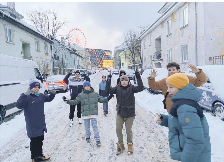
Filmis kaasa löövad poisid kohtuvad ka väljaspool võtteplatsi.