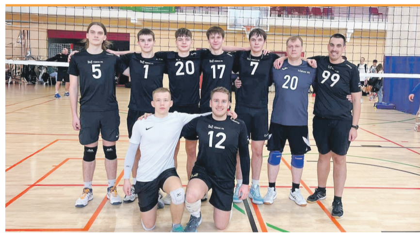
Tõrva Võrkpalliklubi meeskond teenis sedakorda kümnenda koha.

Finaalis kahjuks tuli sedakorda 1:3 alla vanduda Viljandi Tuleviku 2016 meeskonnale, kuid ka hõbemedalid on väga hinnaline saavutus tugevalt turniirilt.