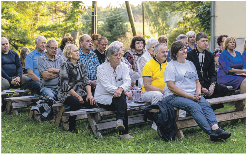
Enamasti käivad teenistustel vääriskas vanuses inimesed aga lisandunud on ka noori.

Et aga siiski astuda oma inimestele lähemale ja jagada koguduse uudiseid, selleks oleme tänulikud tänapäeva vaba-