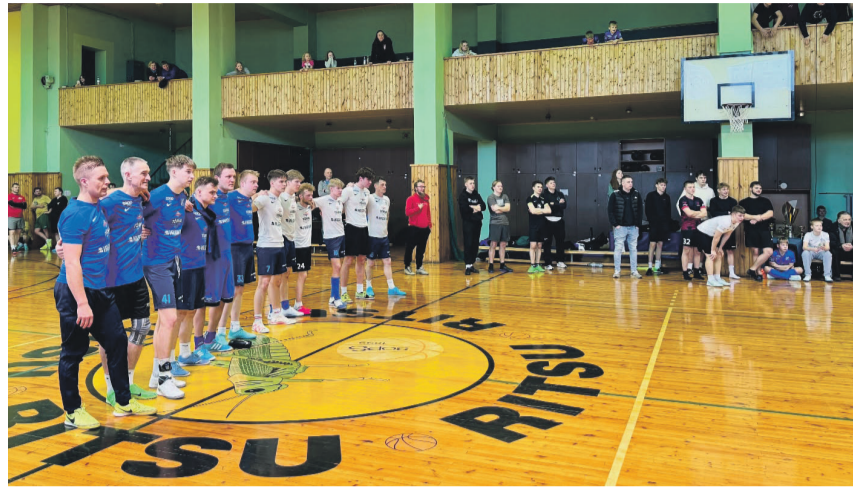
Tõrva JK omavahelise duelli penaltiseerias seisti ühises ravis.

Kuni 11-aastased aga tegid suurepärase turniiri Viljandis, kui kümne võistkonna konkurentsis saavutati 2. koht. Alagrupis teiseks jäänud Tõrva sai poolfinaalis vastaseks teise alagrupi