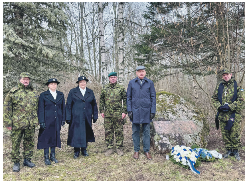
Austusavaldus kindral Jaan Sootsile.

1920. aastal läks ta erru, kuid ei jäänud auga teenitud loorberitele puhkama. Aastail 1921-1923 ja 1924-1927 oli ta Eesti sõjaminister, 1932-1936 Põllutöökoja esimees, Ühistegevuskoja nõukogu esimees, Rahvuskogu Teise Koja ja Riiginõukogu liige, aastatel 1934-1938 Tallinna linnapea ja 1938-1939 ülemlinnapea. 1940. aastal arreteerisid võõrvõimude käsilased Jaan Sootsi ja saatsid Venemaale, kus ta 6. veebruaril 1942. aastal suri.