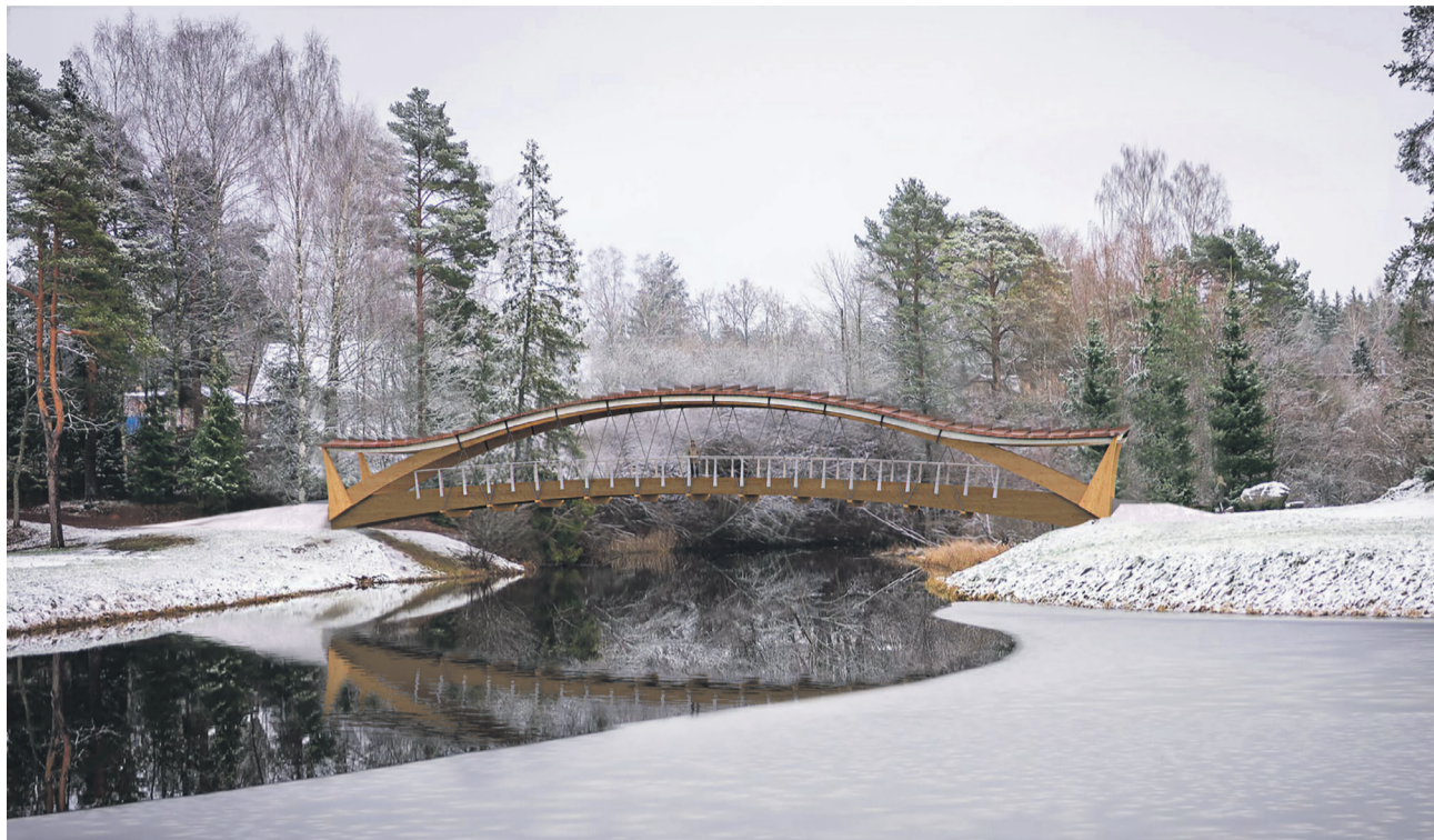
Selline on Jaanis Ilvese poolt loodud esialgne kavand uuest sillast.

Uue silla toetalad on projekteeritud liimpuidust, mis on riputatud silla kandvaks konstruktsiooniks olevatele teraskaartele. Kaarte peale paigutub teraselementidest katus.