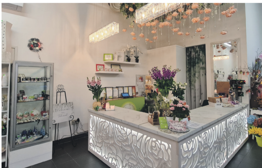
Uus lillepood on avar ja läbinud kauni remondi.

Kõrtsihoonest väljakolimine on sinna planeeritava vabaaja- ja meelelahutuskeskusega seonduvalt paratamatu samm, aga kui keeruline on uue ja sobiva pinna leidmine Tõrvas? “Kõrtsihoonest väljakolimise teadet veel vallast tulnud pol-