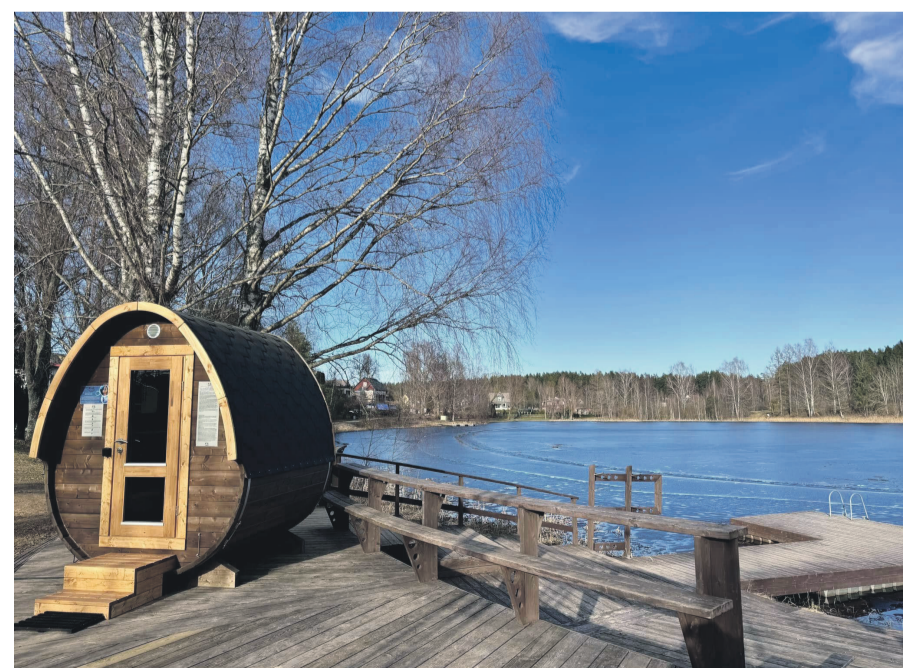
Munasauna ja Riiska järve ääres lausa kutsuvad karastama.