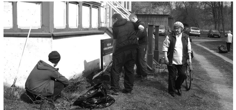
Talgulised tööhoos Helme koduloomuuseumi juures.