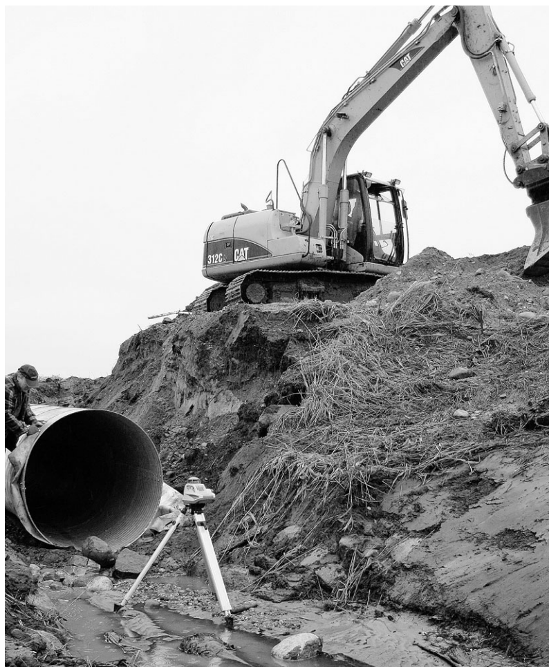
Korras kraavid viivad põldudel liigse vee.

Riiklikku järelevalvet maaparandushoiu nõuete täitmise üle teostab