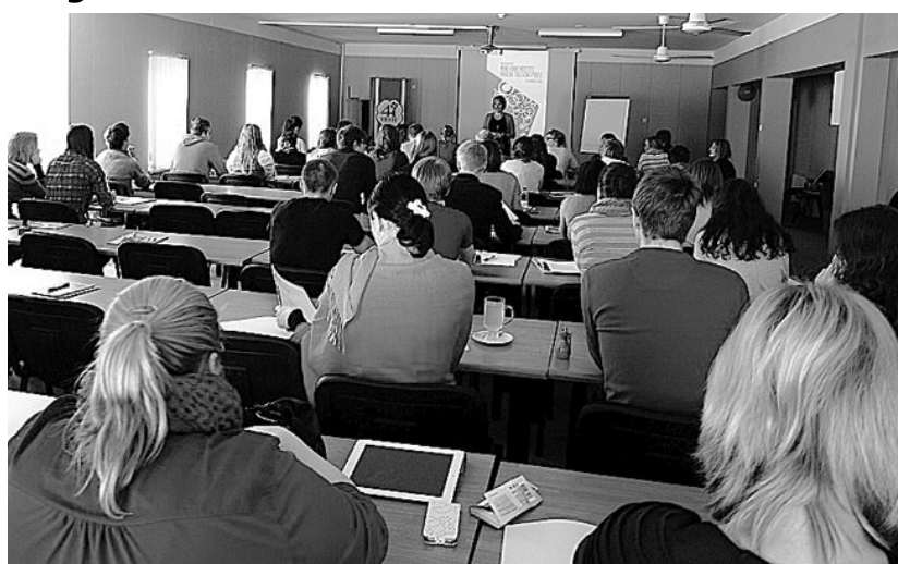
Konverentsil kuulati ettekandeid suure huviga.

Konverents oli oma temaatikalt väga mitmekesine. Arutati Eesti ja eelkõige just noorteorganisatsiooni 4H tulevikuplaane. Keskenduti maaelu arendamise küsimustele, tehnoloogia, arhitektuuri ja ettevõtluse võimalikele tulevikuvisionidele. SA Archimedes Euroopa Noored jagas näpunäiteid, kuidas võtta ette julgeid samme ning avastada Euroopat vabatahtlike tegevuse kaudu. Esmaspäeva õhtupoolik sisustati lõbusa omaloominguprogrammiga – lauldi, tantsiti ja nautiti toredat seltskonda. Üles astus ka tantsugrupp JJ-Street. Konverents andis meile, Tõrva 4H lii-