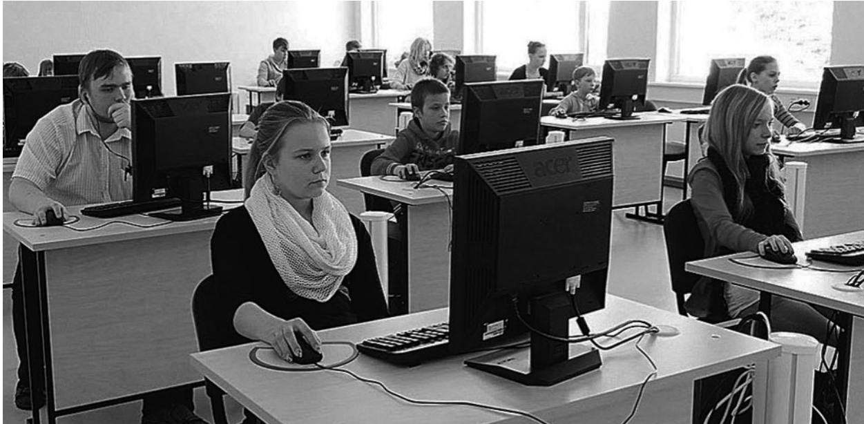
Tõrva kogunes mitukümmend usinat pranglijat.