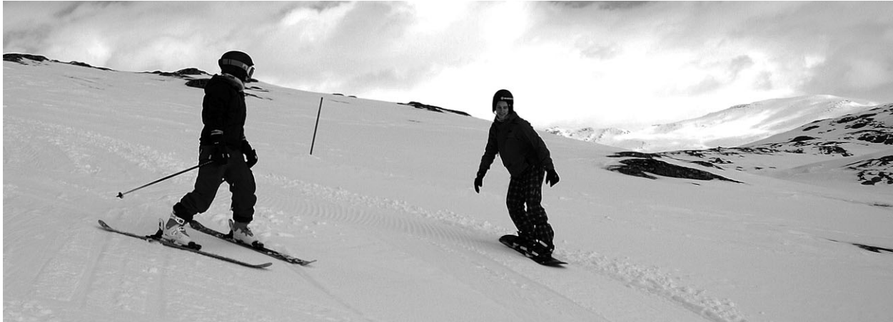
Hemsedali suusakeskuse nõlvadel