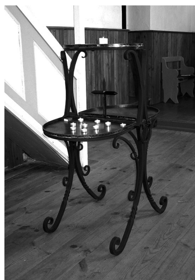
Taagepera kiriku künklaalus