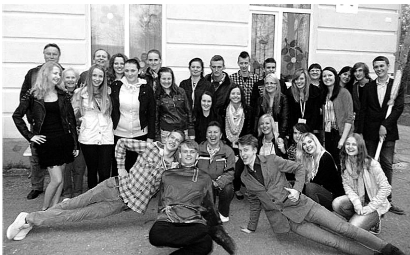
Tõrva gümnaasiumi delegatsiooni kojusõidu eel

Sõprusfestivali eesmärk on tuua kokku eri maade noored, et nad saaksid üksteise kultuuri tundma õppida ja keeli praktiseerida. Kõike seda sai teha pidulikult festivali avamisel, suveniirilaudal, töötubades, spordivõistlustel ja