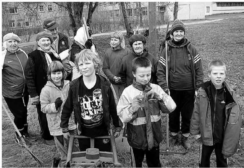
Kevadine suurpuhastus on tehtud!