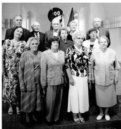
Tõrva Tarbijate Ühistu juubelile tuli palju endiseid töötajaid, et tähistada TTÜ 100. sünnipäeva.