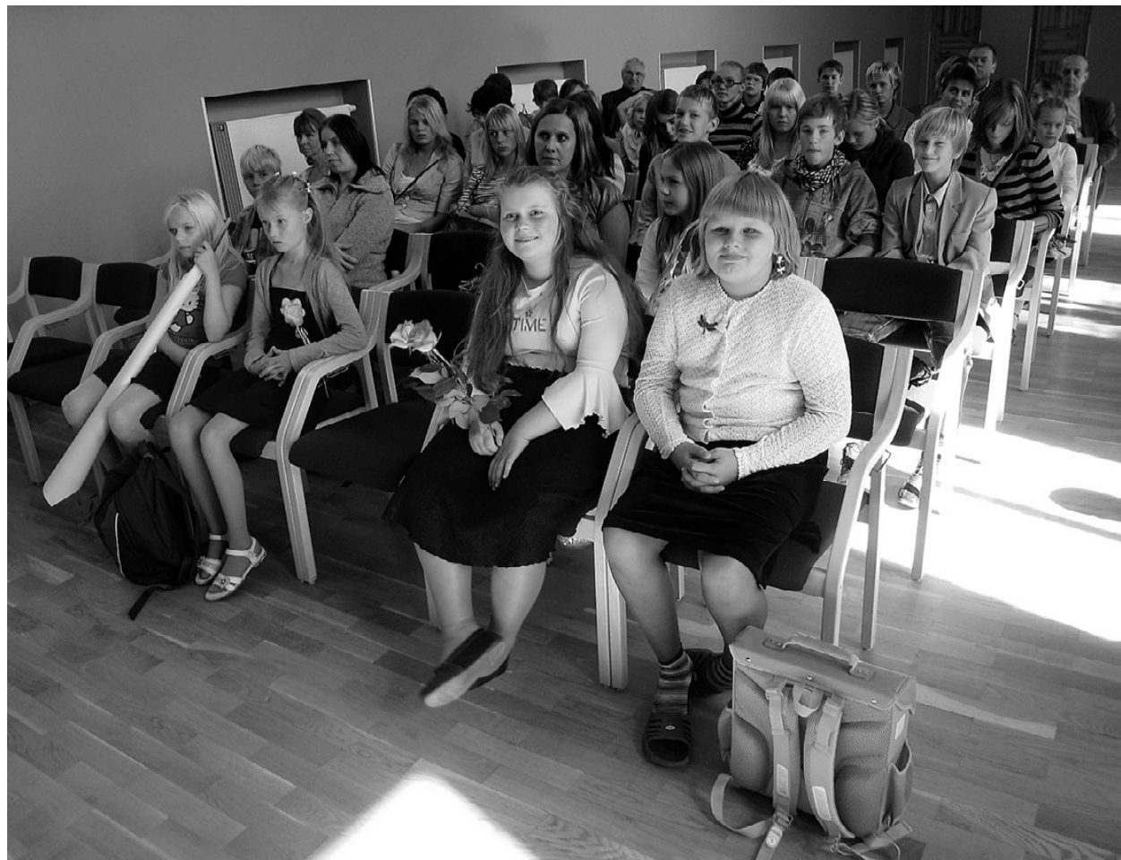
1. septembri aktus Tõrva muusikakoolis