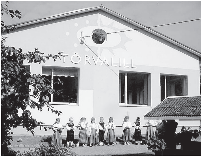
Rahvarõivais Tõrvalille kasvandikud külalisi tervitamas.

justuse tegid Tõrvalille töötajad oma vabast ajast ning oma vahenditega.