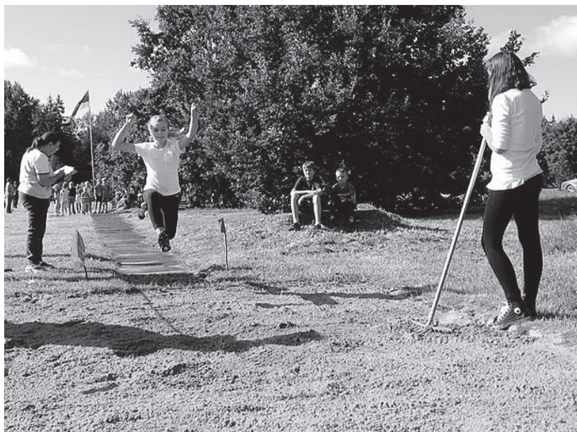
Käimas on kaugshüppevõistlus.

Õhtul toimus külaplatsil simman, kus tantsuks mängis ansambel Lektus. Kuulutati välja Ritsus küla aukodanik, kelleks osutus eelneva küsitluse põhjal