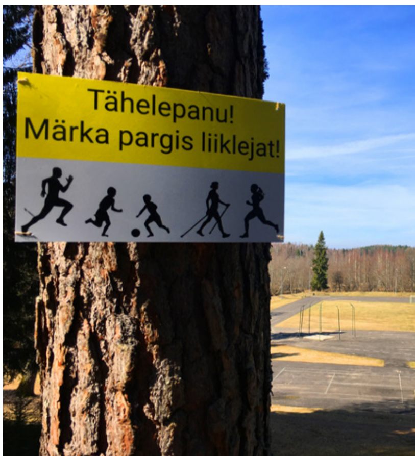
Discgolfiradadele on seatud üles hoiatussildid

Discgolf on mäng, mis põhineb mängijate aususe peal. Samuti sõltub discgolfi ohutus mängijatest. Oleme püüdnud raja luua nii, et viskeid tehes oleks näha, kas keegi rajal liigub. Samuti oleme püüdnud vältida pimedaid nurki. Lisaks tuleme ohutust ja ettevaatamist meelde mängijate koostöös ning rajale lisame ka ohutussildid, mis meenutaksid veelkord, et pargis