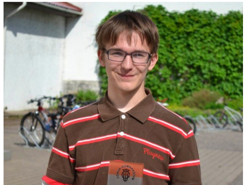
Urmo Kannuke.