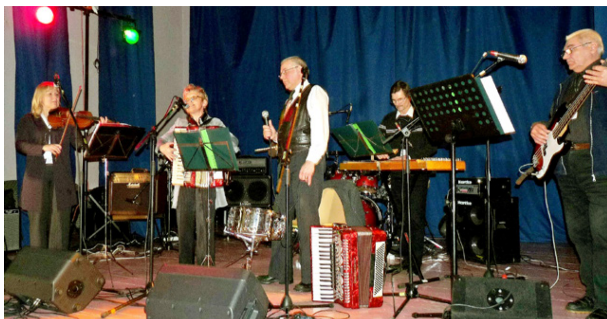
Jauram aastal 2011 esinemas Tsirguliina rahvamajas veel vanas koosseisus.

Selle küsimusega seoses pöördus ekspertgrupi kontaktisik ja teenekas