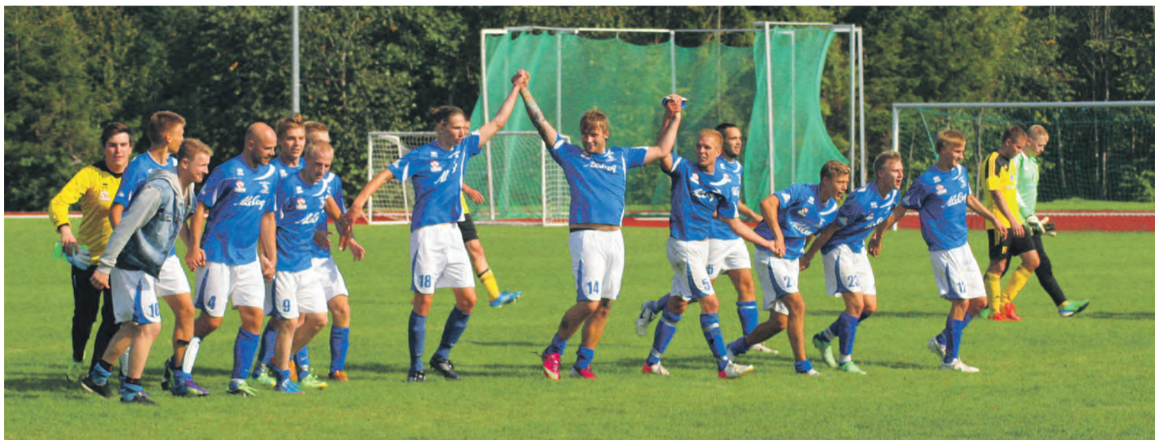
Tõrva JK tähistamas järjekordset võitu.