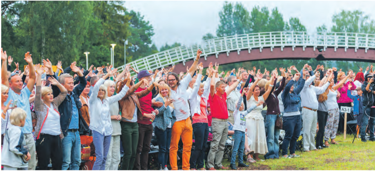
Publiku käima tõmbamisega polnud esinejatel mingeid probleeme.