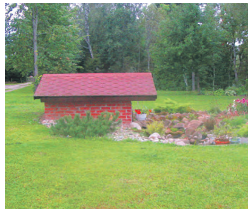
Merike Soometsa koduõues on palju kauneid lahendusi.