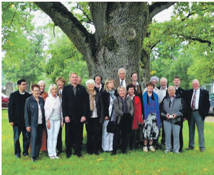
Von Stryki suguvõsa kokkutulemine Riidaja mõisapäeval.

2011. aastal, mil Gerdruta kabeli taasavamisest möödus 10 aastat, tulid kohale 17 von Stryki suguvõsa liiget, kes olid teekonna ette võtnud nii Saksamaalt, Kanadast, Rootsist, Ungarist, Poolast ja isegi Boliiviast.