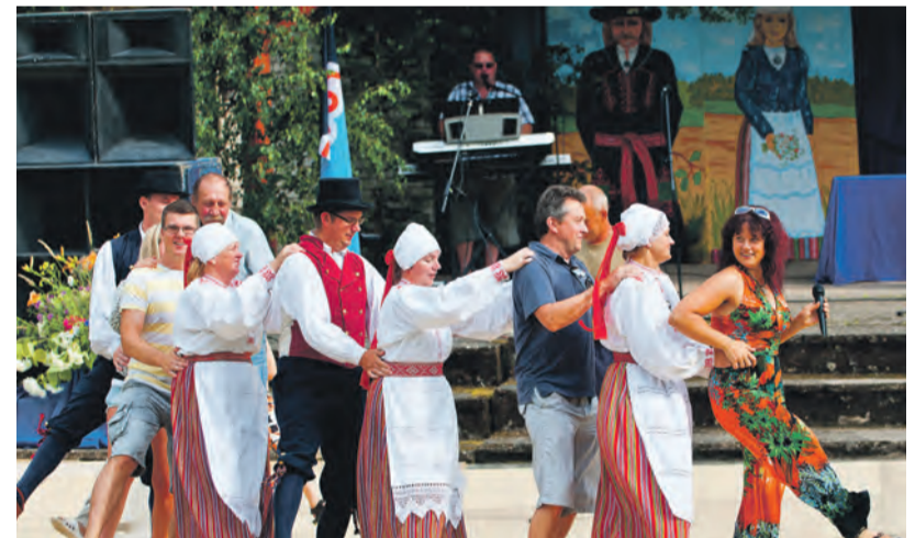
Helme valla päev pakkus publikule võimalust ka oma tantsuoskuseid näidata.

korda, ilm oli ilus suvine ja päiksepaisteline. Hinnanguliselt oli õhtuks ansambel Nööbi saatel jalga keerutamas ning lihtsalt muusikat kuulamas enam kui 1600 inimest.