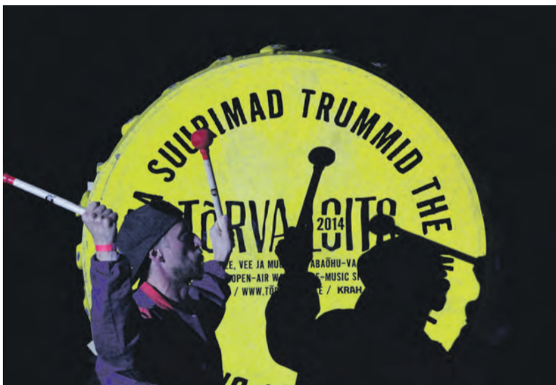
Taaskord olid kohal maailma suurimad trummid.