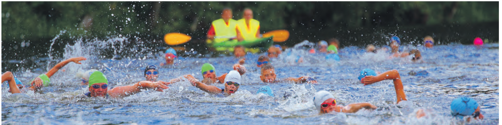
Rohke osavõtt triatlonist pani Õhne jõe ujujatest kihama.

16.-17. augustil toimusid esimesed Tõrva triatlonipäevad, mille raames selgusid Eesti meistrid krosstriatlonis ja Meie Liigume Medita triatlonisarja võitjad.