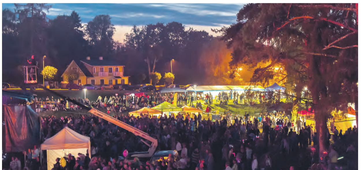
Kombekohaselt võõrustas Loits täismaja.