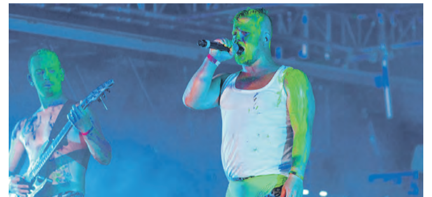
Winny Puhh pakkus pealtvaatajatele tõsise vaatamängu.