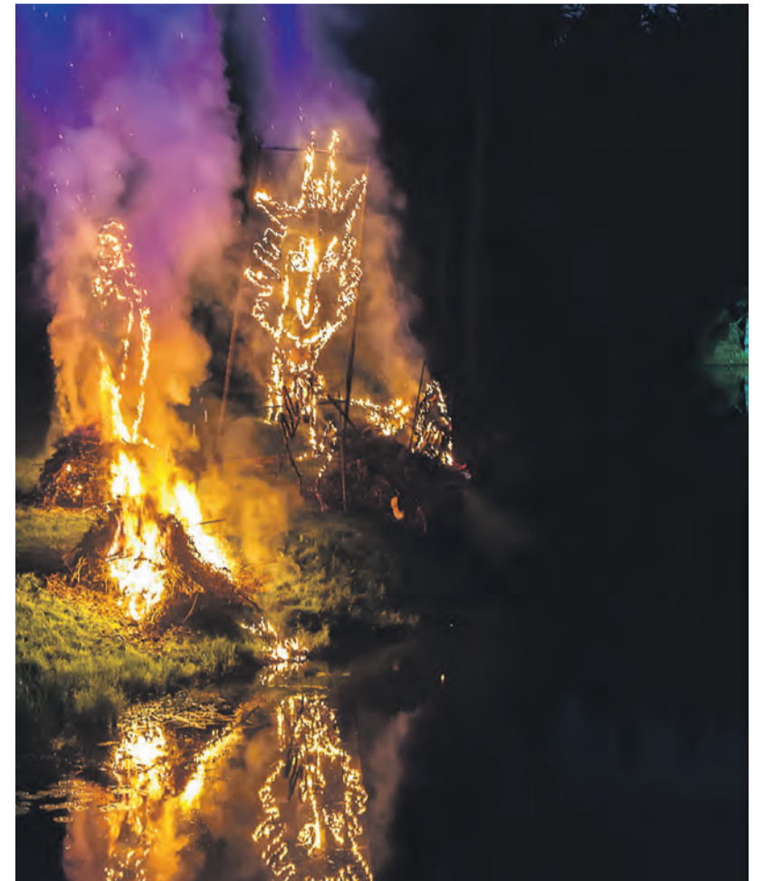
Teemakohane tuleshow sai publikult vaid kiidusõnu.