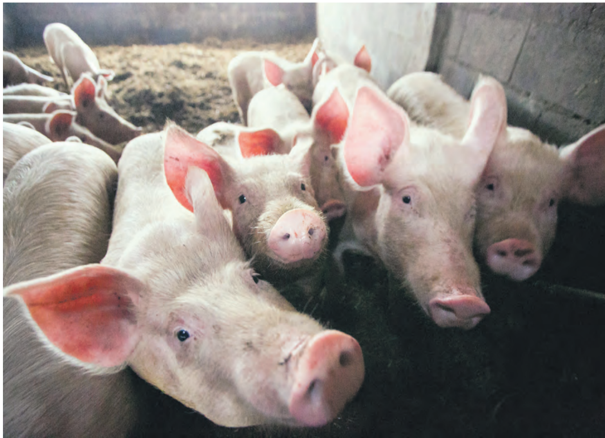
Ka ühe sea kasvatajad peavad oma loomast teavitama vastavaid asutusi.

Jahimees rääkis aga, et metssead on hakanud inimeste koduõue peal käima tammeterusid söömas.