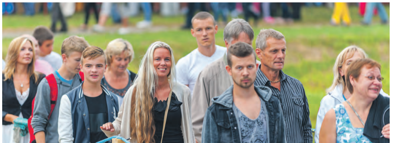
Esinejad ja publik saabusid üritusele ühtses rivis.