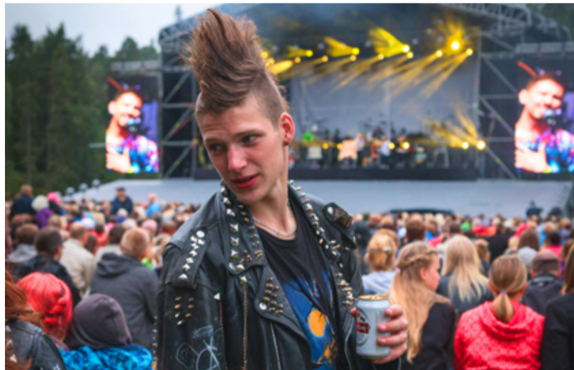
Nagu ühele pungipeole kohane oli kohale tulnud ka hulgaliselt punkareid.