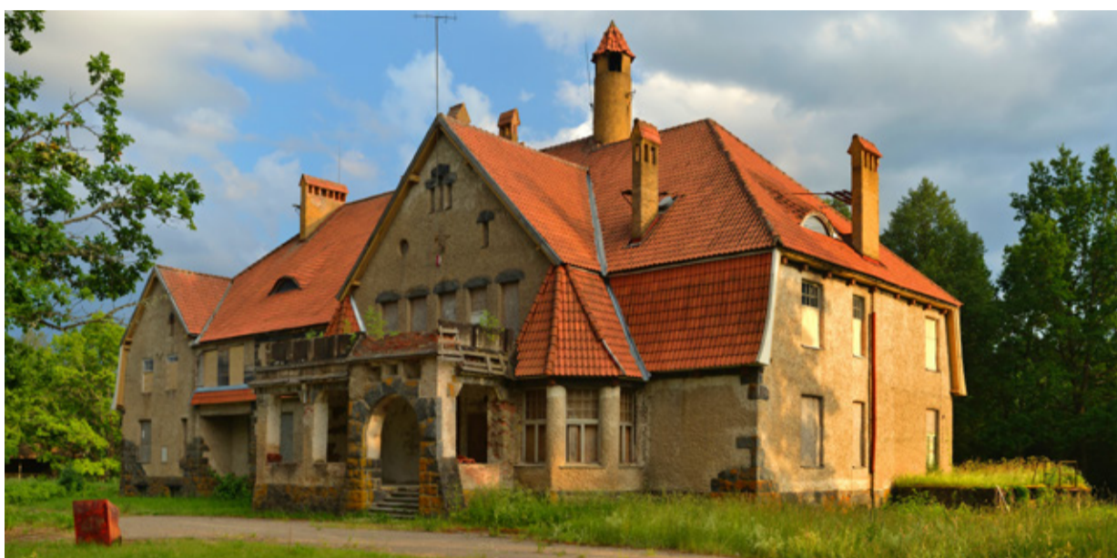
Holdre loss paistab isegi arhitektuurivõhikule kaunis, aga tublisti tööd vajav ehitus.