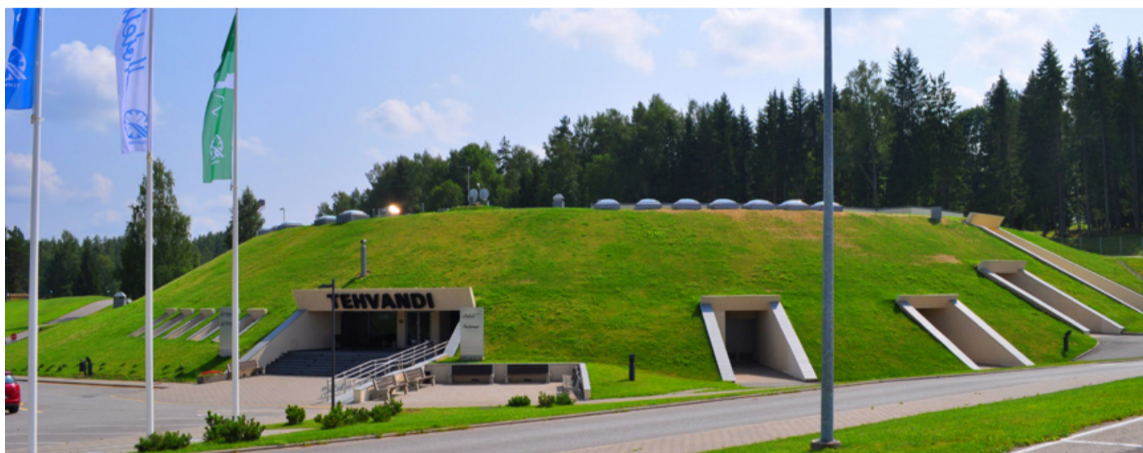
Tehvandi spordikeskuse mätastega vooderdatud peamaja „Pentagon“ oli KEKi keeruliseim ja kuulsaim ehitusobjekt. Täna on sellest saanud maailma populaarseimaid talispordikeskusi koos Käärikuni ulatuvate suusarolleriradadega.

Algusaastad olid väga rasked. Puudu oli kõigest. Kogemustega ehitajatest, materjalidest, tehnikast, rahast (nii tellijail kui ehitajal), oma tootmisbaasist. Esiti paikneti vaid ühes Metsa tänava toas. KEK-i juha-