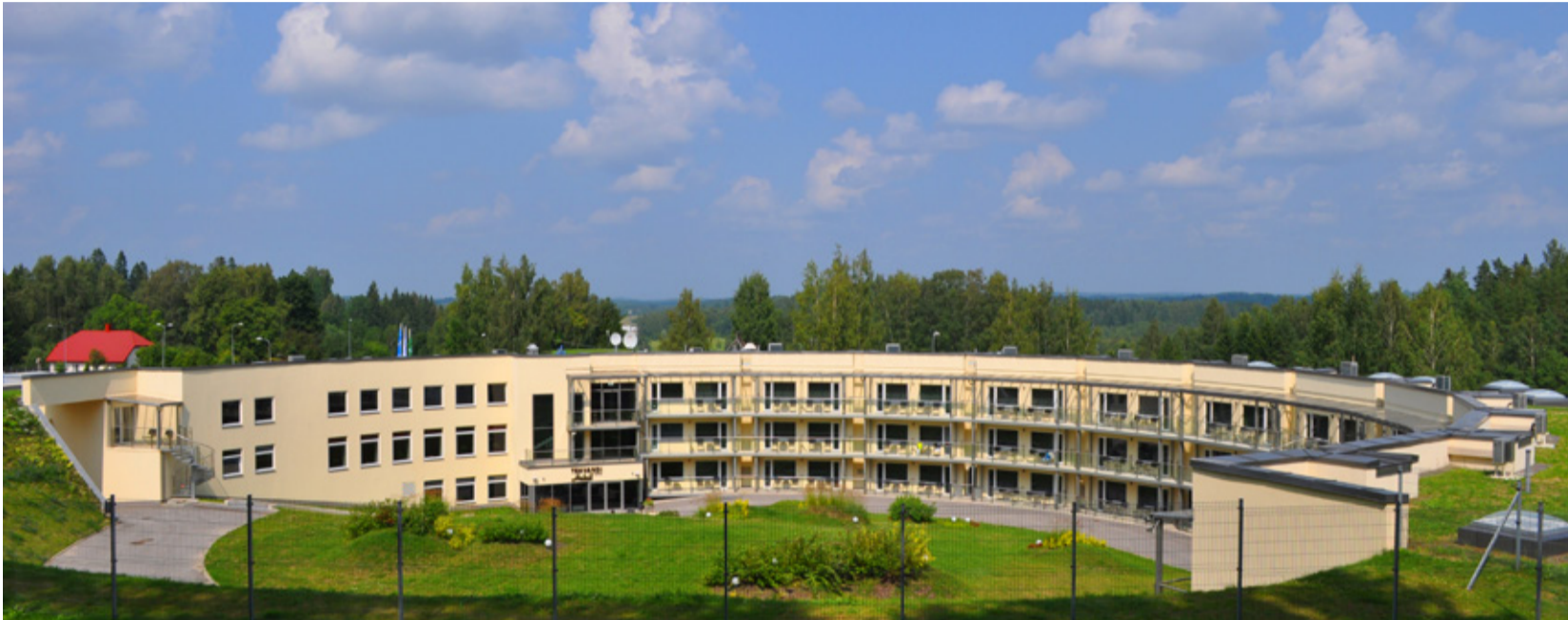
„Pentagoni“ keerulisem osa ehitajale oli 150 m pikkune kaarjas (180 kraadi) hotelli- ja teeninduskompleks.

Allikas: Georg REINASTE käsikiri „Kolmkümmend töökä aastat“, Tõrva 1986.