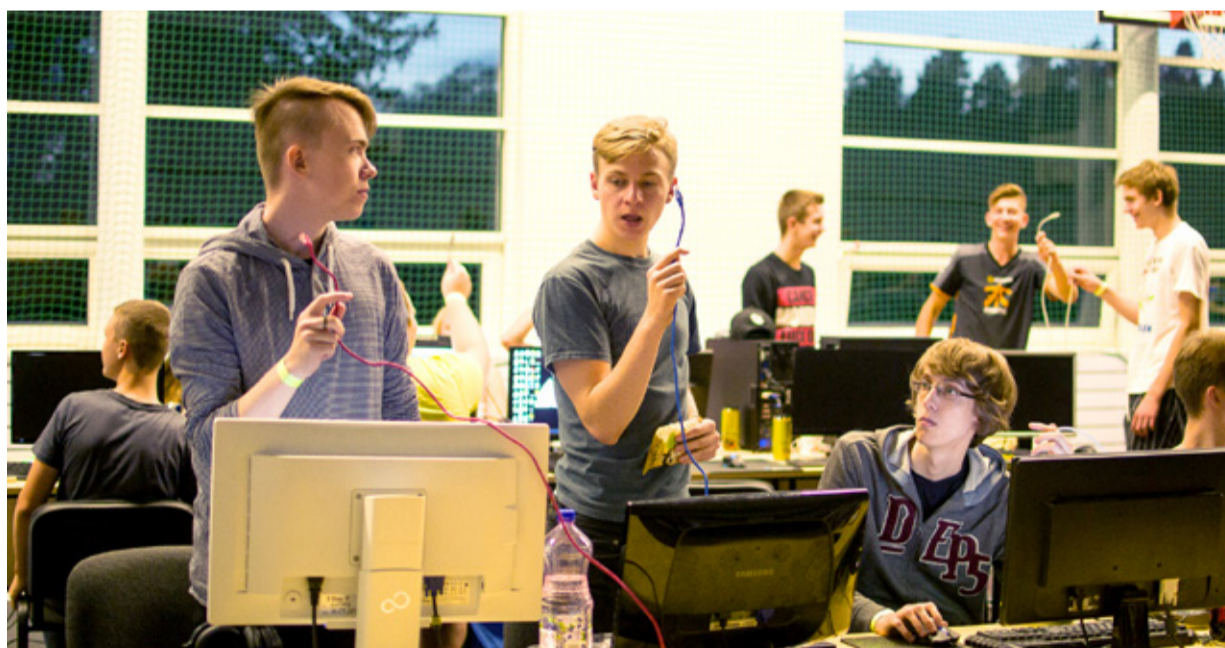
Tõrva Gümnaasiumi võimla võõrustas mitusadat arvutimängurit.

Tõrva ÖöLAN ei ole ainult kohalik sündmus, vaid on oluliseks ürituseks saanud nii mitmelegi mängurile üle Eesti. Sel korral oli kohal osalejaid Valgast, Võrust, Viljandist, Tartust, Tallinnast, Jõhivist, Raplast, Pärnust, Sauele jne. Mõõdunud suvel oli esindatud ka Saaremaa, Kuressaare mängija näol. Tõrva ÖöLANist on saanud tra-