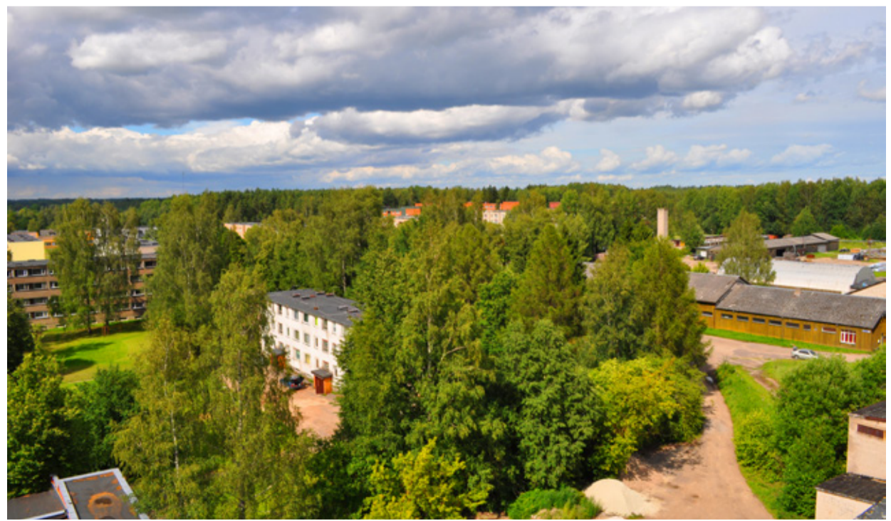
28 hektaril laiub KEK-i elamulinnak – rohulisse sulandunud Tõrva suurim linnaosa 18 elamu- ja 3 garaažiühistuga, oma sotsiaalaristituga.