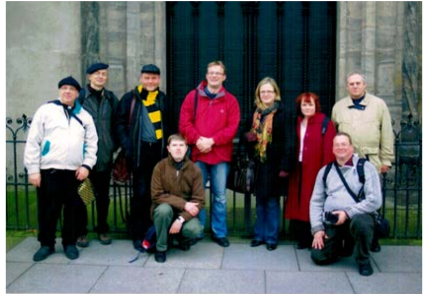
Wittenbergi Lossikiriku pronks-ukse ees, millel on kirjas Martin Lutheri 95 teesi.