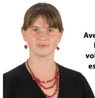
Ave Visor Helme volikogu esimees

Nad tulevad jälle. Võib-olla ei olekski see nii masendav, kui meie ümber ei käiks meeletu osturalli ja inimesed ei näiks nii muretsevat, mis ja kui suure, kui kalli kingituse ta jõuluvanale kotti poetab. Vanemate peataolek kandub üle ka lastele, kes jõuluvanale kirja kirjutades ei teagi, mida soovida, sest