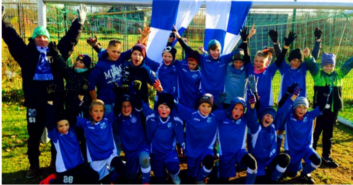
Tõrva JKT noored.