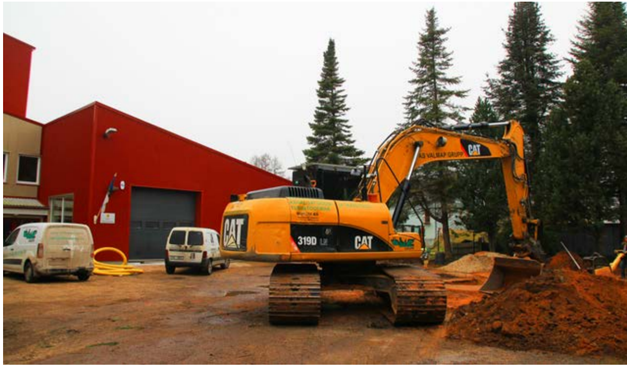
Päevalgalles on päästekomando hoovil askeldamist kõvasti.

Tervet päästesüsteemi juhib Päästeamet, mille peakontor asub pealinnas Tallinnas. Päästeametil on 4 regionaalset päästekeskust, kelle koosseisu omakorda kuuluvad maakondlikud päästepiirkonnad, mis haldavad kohalikke päästekomandosid. Nende hulgas on ka Tõrvas Metsa 1A asuv Tõrva päästekomando. Nii