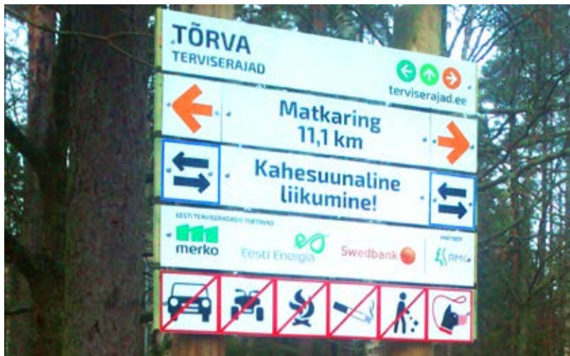
Terviserada on nüüdsest kenasti märgistatud.

MTÜ Tõrva Spordiselts moodustati 2009. aastal kohalike spordiaktivistide ettevõtmisel. Ühingu tegevuse üheks tähtsaimaks eesmärgiks on liikumisharrastuse edendamine ning erinevate liikumisvõimaluste loomine eesmärgiga tõsta kogukonna kehalist aktiivust. Nii alus-