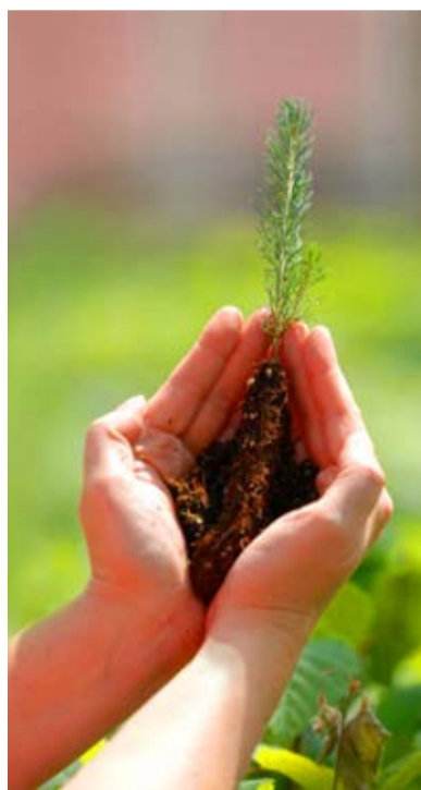
Sellistest istikutest algab kuuse suureks kasvatamine

On perekondi, kus on üheks kohustuslikuks jõulutraditsiooniks tingimata ise kõige ilusama ja parema kuuse otsimine metsast, et tõsta tuppa toodava puu sentimentaalset väärtust. Tõsiasi on, et paljudel pole endal metsamaad, kuhu sobivat puud maha saagima minna, ja seega on parem suunduda seda tegema riigimetsa. Riigimetsa Majandamise Keskus on ära teinud palju tööd, et muuta see kodanikele lihtsamaks. Nende kodulehelt võib leida kaardi kui ka mobiilirakenduse, mille abil on lihtne vaadata, kas jõulupuud saab maha võetud ikka õigest kohast - mitte kaitsealalt või eraomani-