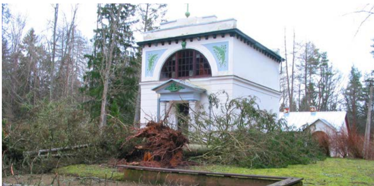
Tormijärgne vaatepilt Barclay de Tolly mausoleumi alleele 2005. aasta 9. jaanuaril.

Kui 2005. aasta jaanuaritorm tegi siinkandis tugevat laastamistööd, siis ei anna seekordset tormi