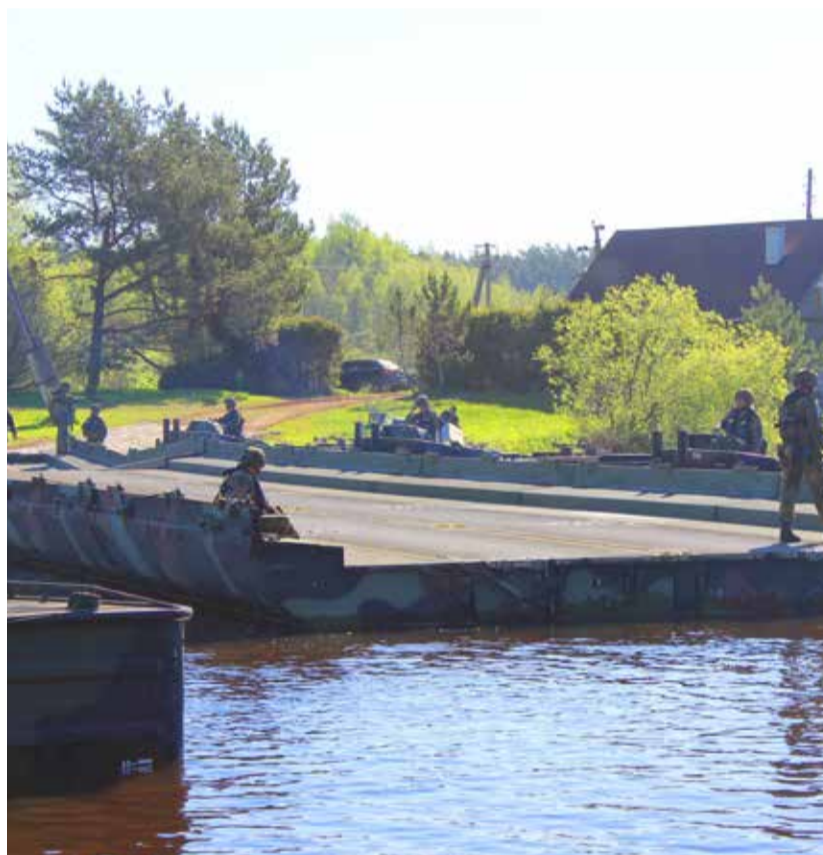
Selleline uhke sild rajati Pikasilda.

kirik-kammersaali, külastada Helme Pansionaati ja Ritsu lasteaed-alkkooli.