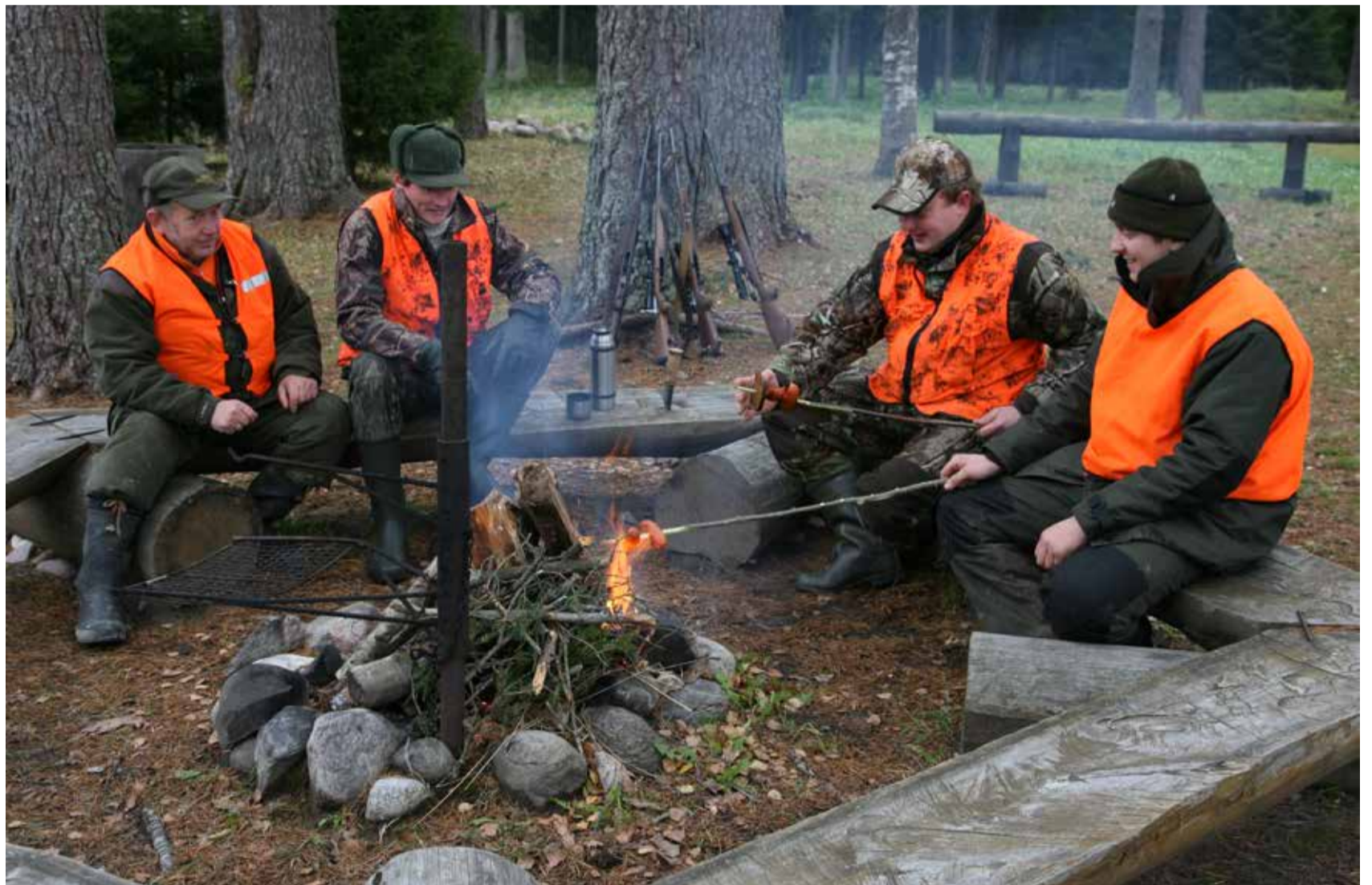
Oluline osa jahipidamisel on lihtsalt hea seltkonna nautimine.

Jahipidamisel on eri aegadel olnud erinev roll ühiskonnas, kaas-aegne põhjapõhjalik jahindus on eelkõige praktilise looduskaitse osa. „Inimese mõju keskkonnale on tohutult suur ja kasvab veelgi. Selles olukorras on äärmiselt oluline hoida ulukite arvukust sellistes piirides, mille puhul kahjud oleksid minimaalsed.“ Samas peavad ulukipopulatsioonid säilitama oma elujõulisuse ja see kõik seab kaas-aegsele jahindu-