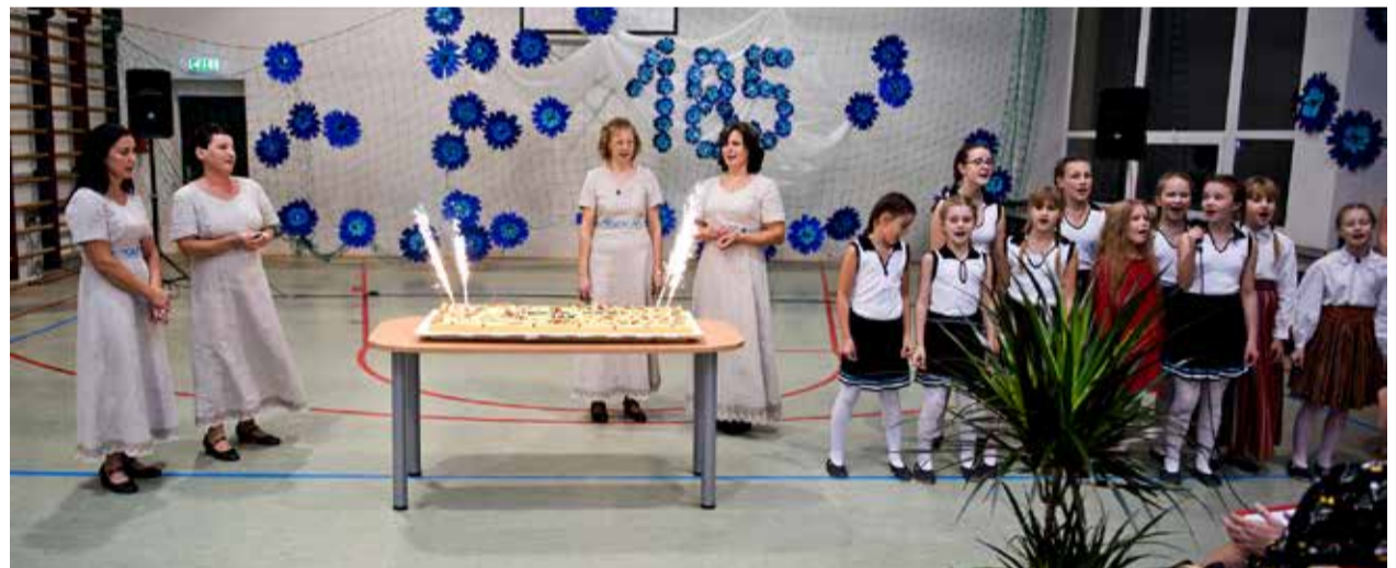
Sünnipäeva tähistati suurejooneliselt.

Kõigile kaunist jõuluaega ja koradaminekuid uuel aastal.