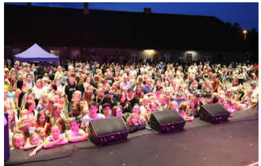
Keskväljak mattus massidesse.

Sakslased võtsid kodupubliku ees kaksikvõidu, Euroopa meistriks tuli 89.47 visanud Thomas Röhler ja hõbeda võitis Andreas Hoffmann 87.60-ga.