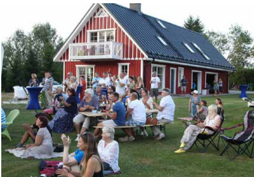
Pritsu talu vabaõhu ooperiõhtu.