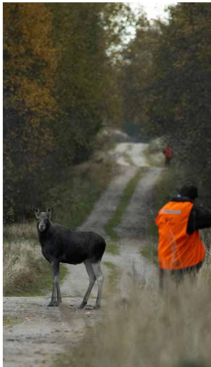
Seekord pauku ei tehtud.

„Loomulikult ei ole vaja, ega kunstlikult ei saa asurkondi üleval