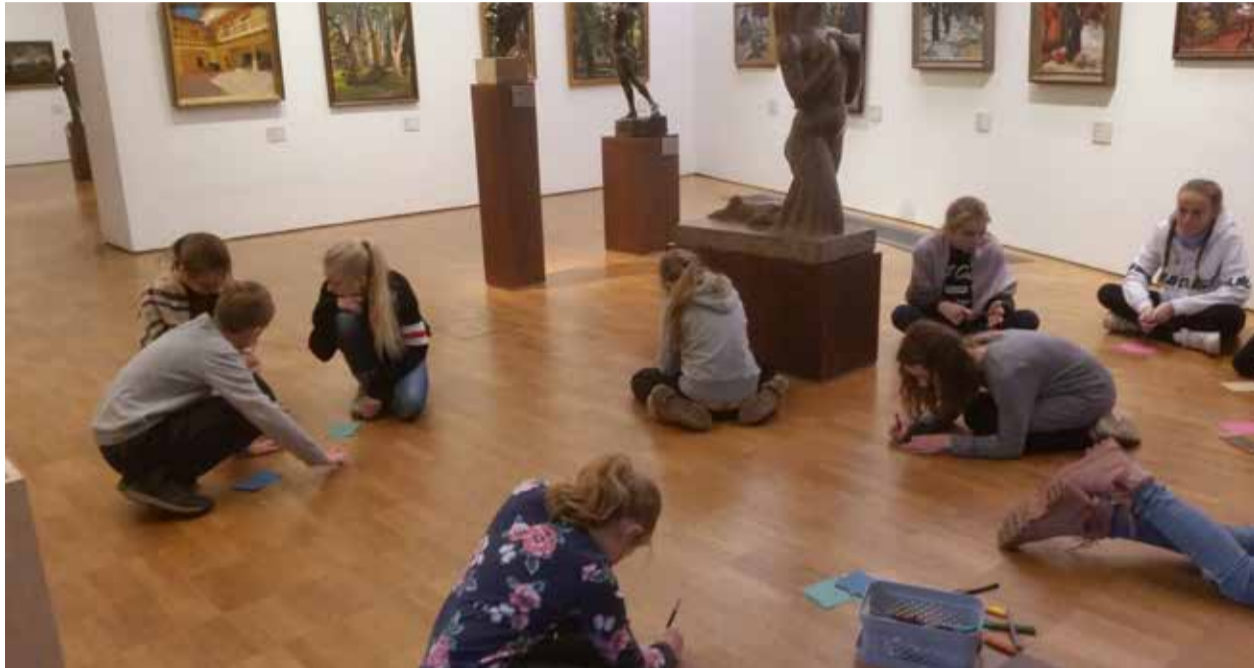
Tõrva Kunstistuudio omavalmistatud jõuluehete näitust "Jõulusoojus" saab vaadata Kesklinna kohviku vaateakendel.

Novembri lõpus sai teoks Tõrva Kunstistuudio väikeste ja suurte stuudiolaste ammune unistus külastada Tallinnas kunstimuseumi KUMU. Seal toimusid töötod noorematele ja vanematele osalejatele projekti „Aitan lapsi kunsti juurde“ toel. Nooremad õpilased tutvusid eesti kunstivara-