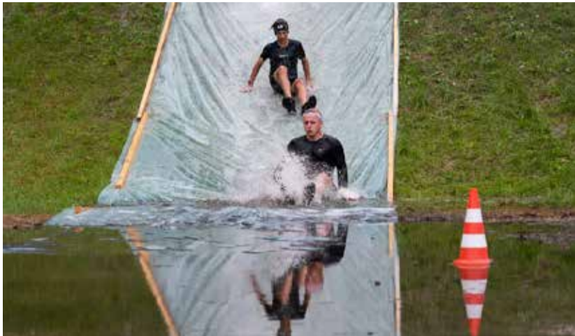
Ekstreemjooks.