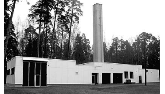
Tõrva gümnaasiumi katlamaja