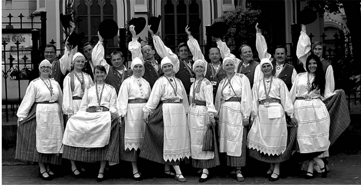
Fotol Jandali ja Pastlapoolikud Riias

Ilm oli päikeseline ja soe ning sõit kulges kiirelt ja juba olimegi Läti Vabariigi pealinnas Riia piiril. Pärast pisikest linnasõitu tomtom navigatsiooni seadme abil jõudsimegi sihtkohta Riia kesklinna Avotu tänavale maja number 41 juurde. Seal asus üks kool, mille väravad avas meile Nauksēni valla kultuuri-