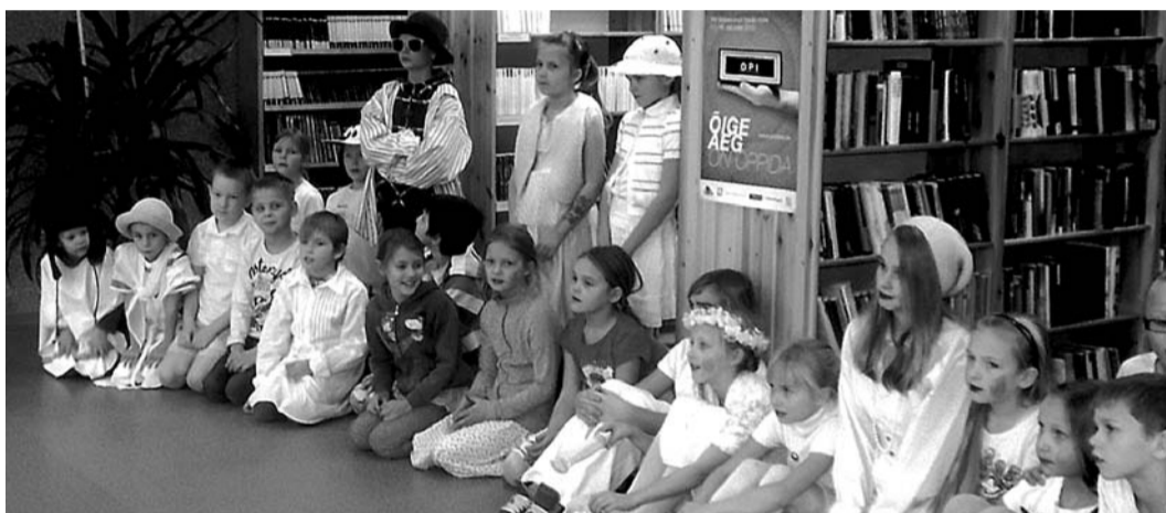
Kadripäev Ritsu koolis