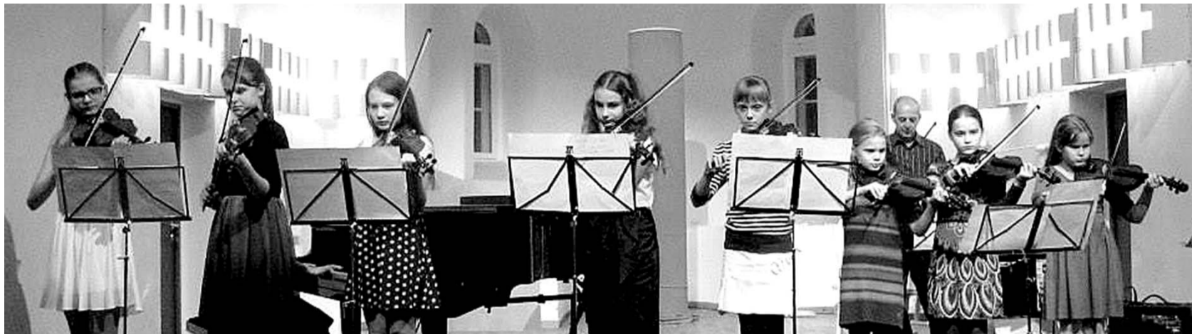
Tõrva muusikakooli õpilaste kontsert kirik-kammersaalis