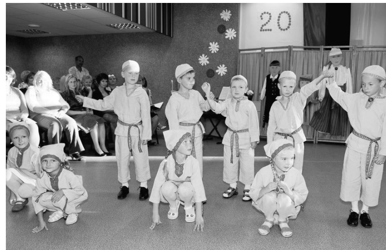
Ritsu lasteaed-alkkool pidas 20. sünnipäeva.