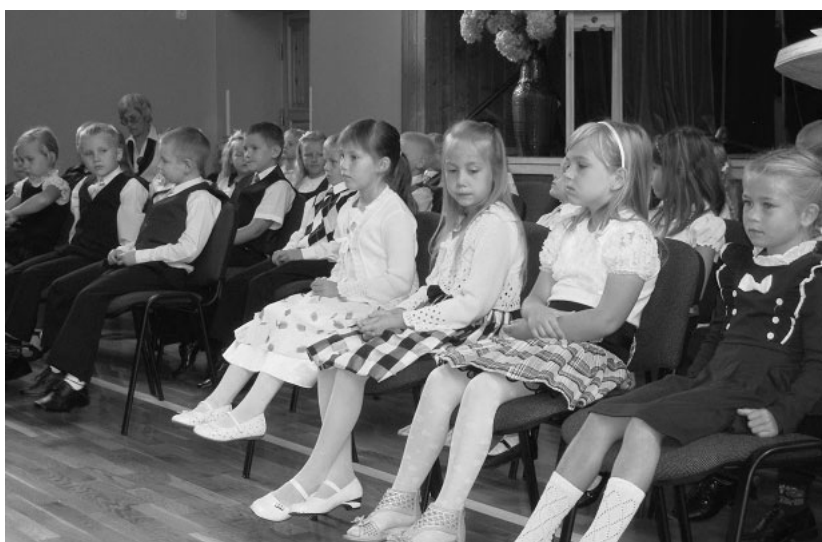
Kooliaasta avaaktus 1. septembril

Tõrva gümnaasiumi kümnendasse klassi astus 25 õpilast, klassijuhataja on