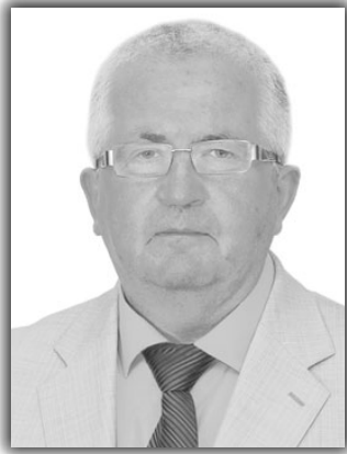
161 AGU KABRITS