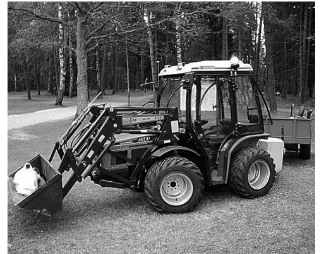
Väiketraktor on pargi hooldustööl hindamatu abiline.