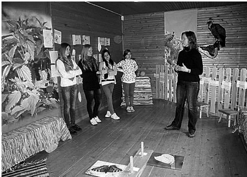
Karula rahvusparkis näitusel «Liblikalend»

Järgmisel päeval sadas vihma ja matkamisest looduses ei tulnud midagi välja. Olime hoolega jälginud ilmatea-