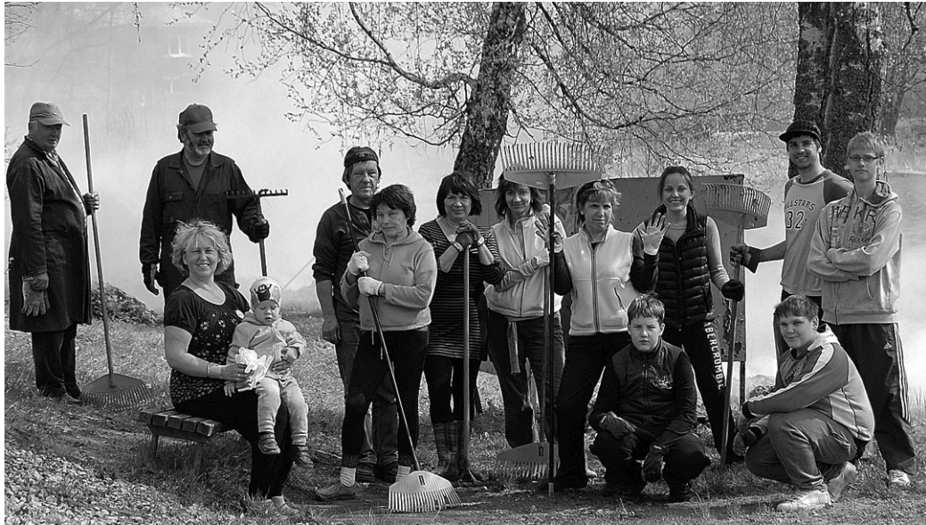
Talgulised Riiska järve ääres