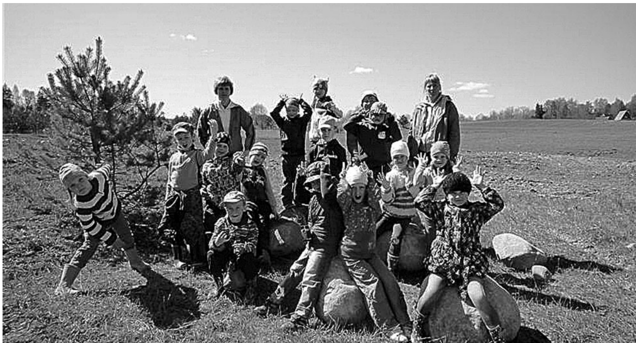
Ritsu lapsed Vellaveres

OÜ Tõrva Veejõud projektijuht Tel 5344 8790, rando@torva.ee