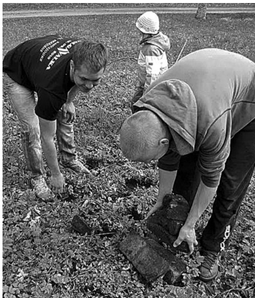
gupäeva kordaminekule kaasa aitasisid.

Tore päev oli. Palju vajalikku sai tehtud. Suur-tänu kõigile osavõtjatele. Tänuõnäd Helme vallale, Kaitseliidu Valga maleva Helme üksikkompaniile ja Valgamaa Omavalitsuste Liidule, kes tal-