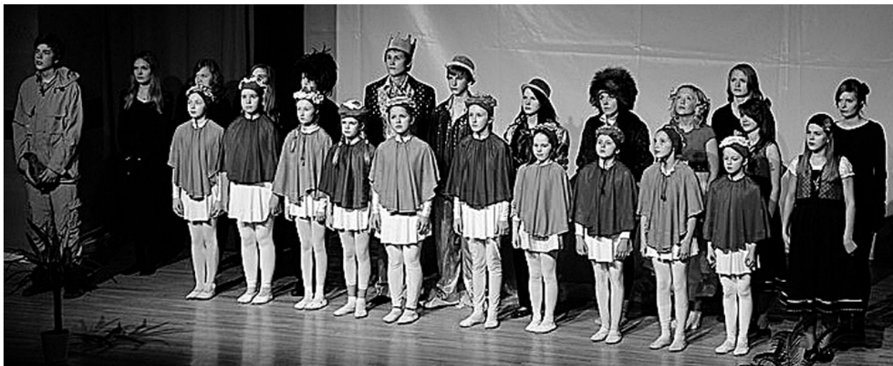
Etendusse olid kaasatud paljud kollektiivid.