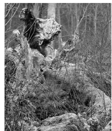
Kiigeoru hiis