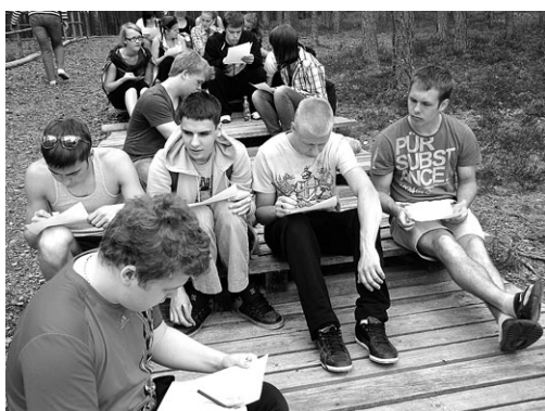
11. klass Meenikunno rabas

Karula rahvusparkiga käisid 18. mail tutvumas 2. klassi õpilased, 21. mail 3. klassi õpilased ning 25. mail 5. ja 6. klassi õpilased. Külalstati Metsa-