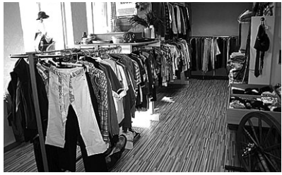
Tõrva kauplus Aia tn 6

le toodetele peame eraldi müügiarvestust ning kogu Eestist korjatud kaupade müügitulu suuname täies mahus Eesti maapiirkonnas elavate perede toetuseks.