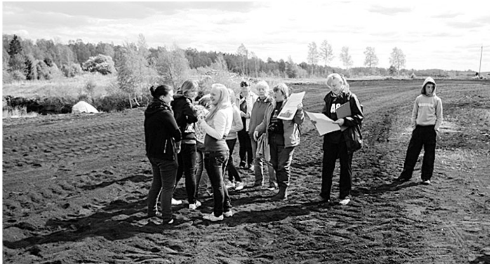
Lapsed Sangla soos