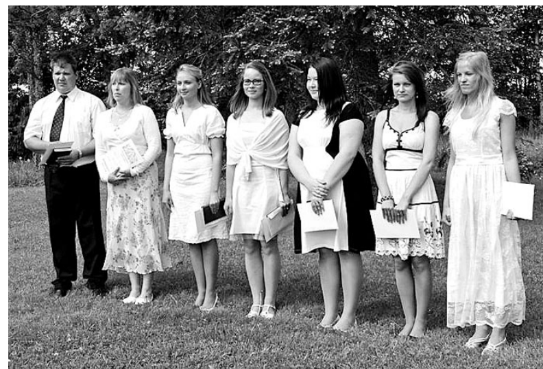
Leeriõnnistuse saanud noored