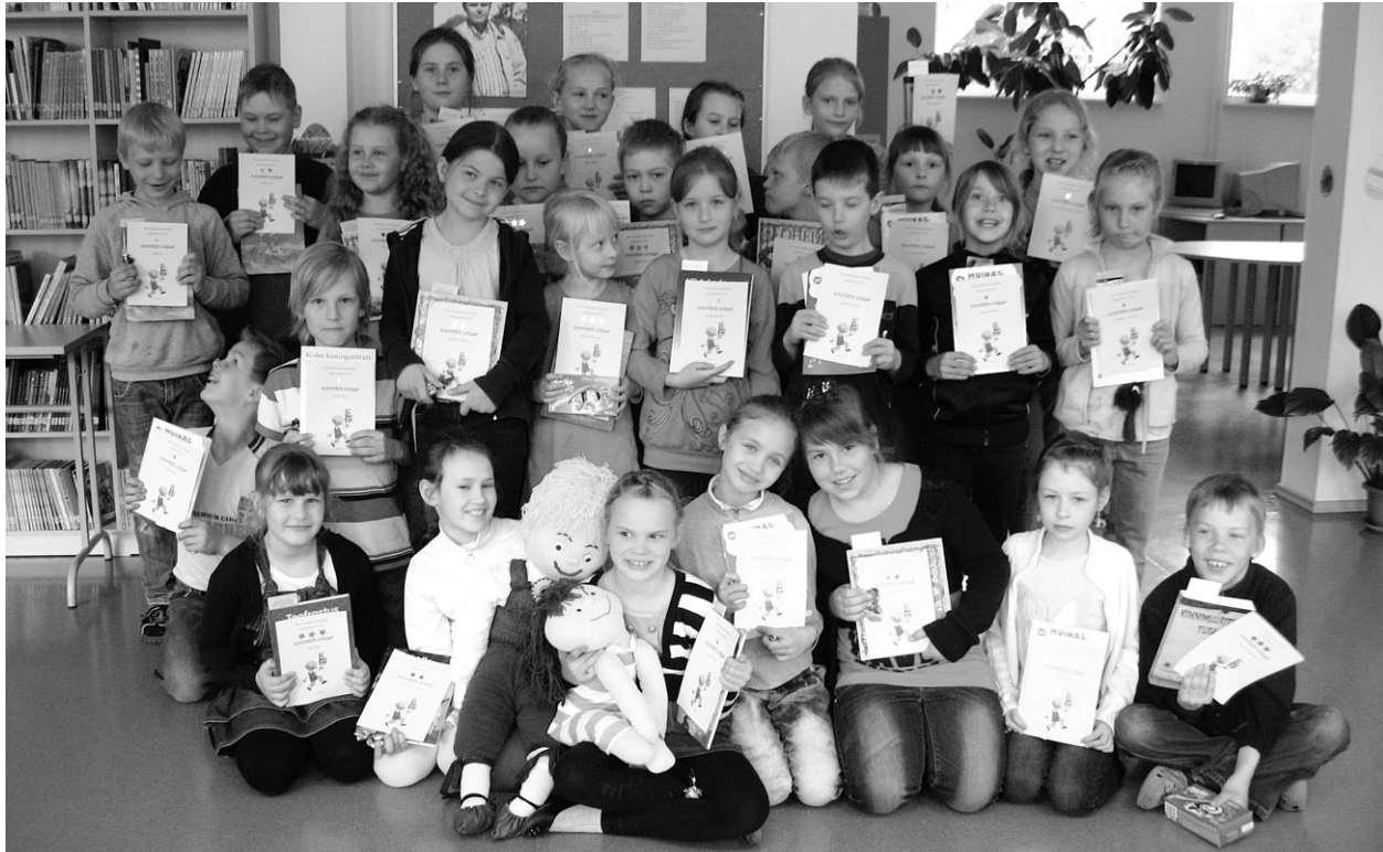
Tõrva gümnaasiumi kuldtahe lugejad