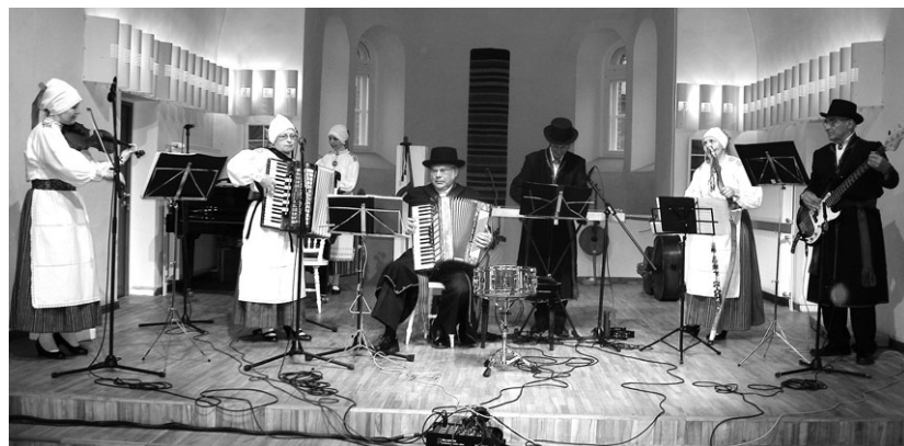
Jauram aastal 2012