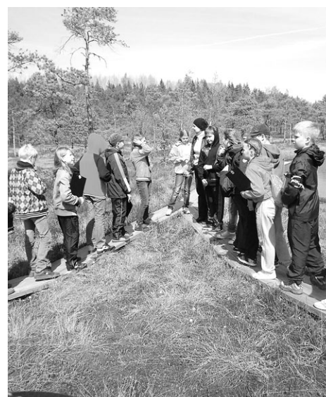
4. klass Soomaa rahvusparkis