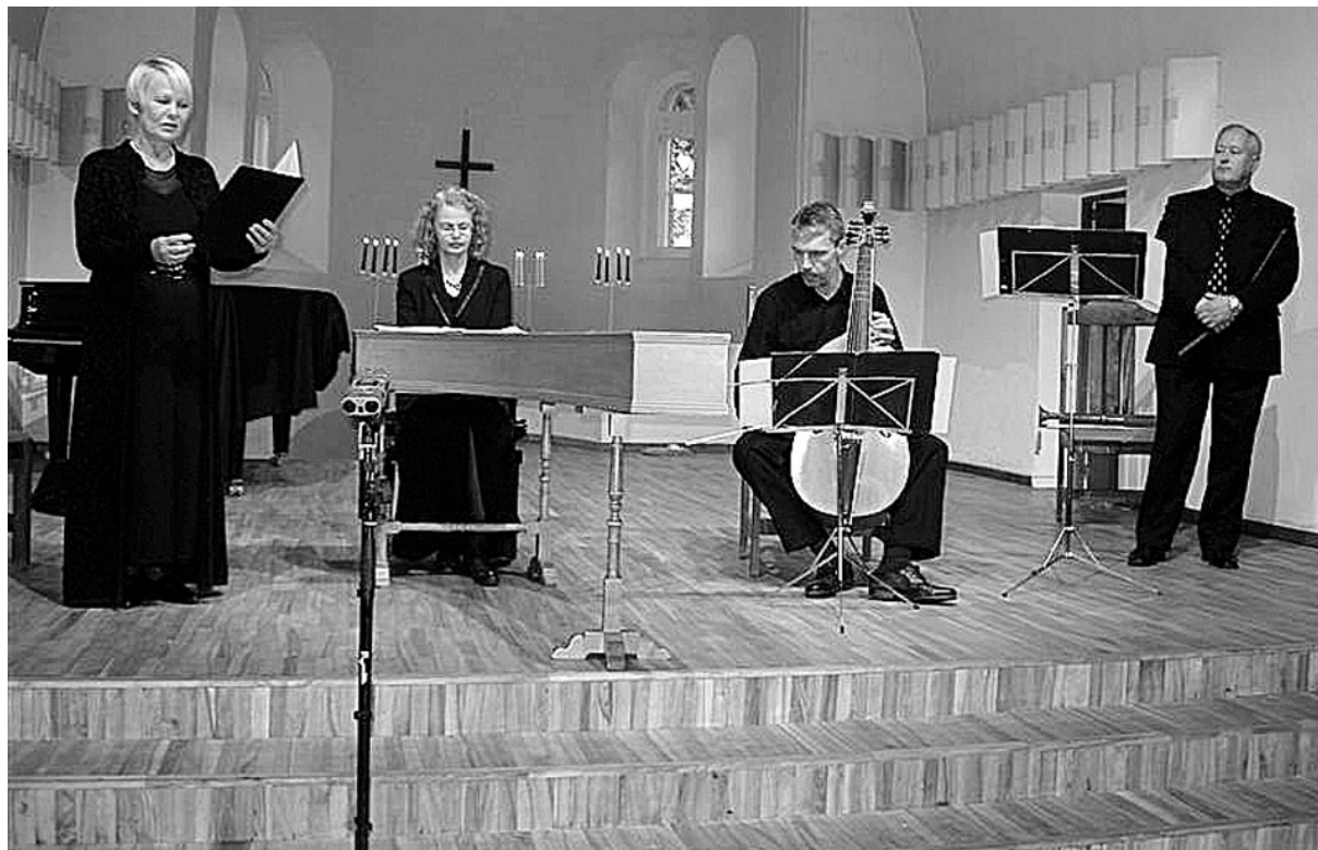
Juuniküüditamise 70. aastapäevale pühendatud mälestuskoosviibimisel musitseeris ansambel Tallinn Baroque.