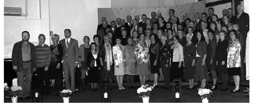
Norra koor Te Deum

Lõika baklažaan ja suvikõrvits viiludeks, tükelda paprikad. Pintselda köögivilju õliga ja grilli. Tõsta köögiviljad vaagnale ja pudista peale fetajuust. Sega kokku kastmeained ja nirista köögiviljadele. Laota peale ka värsked basiilikulehti. Naudi kohe soojalt koos küpse šašlõkiga.