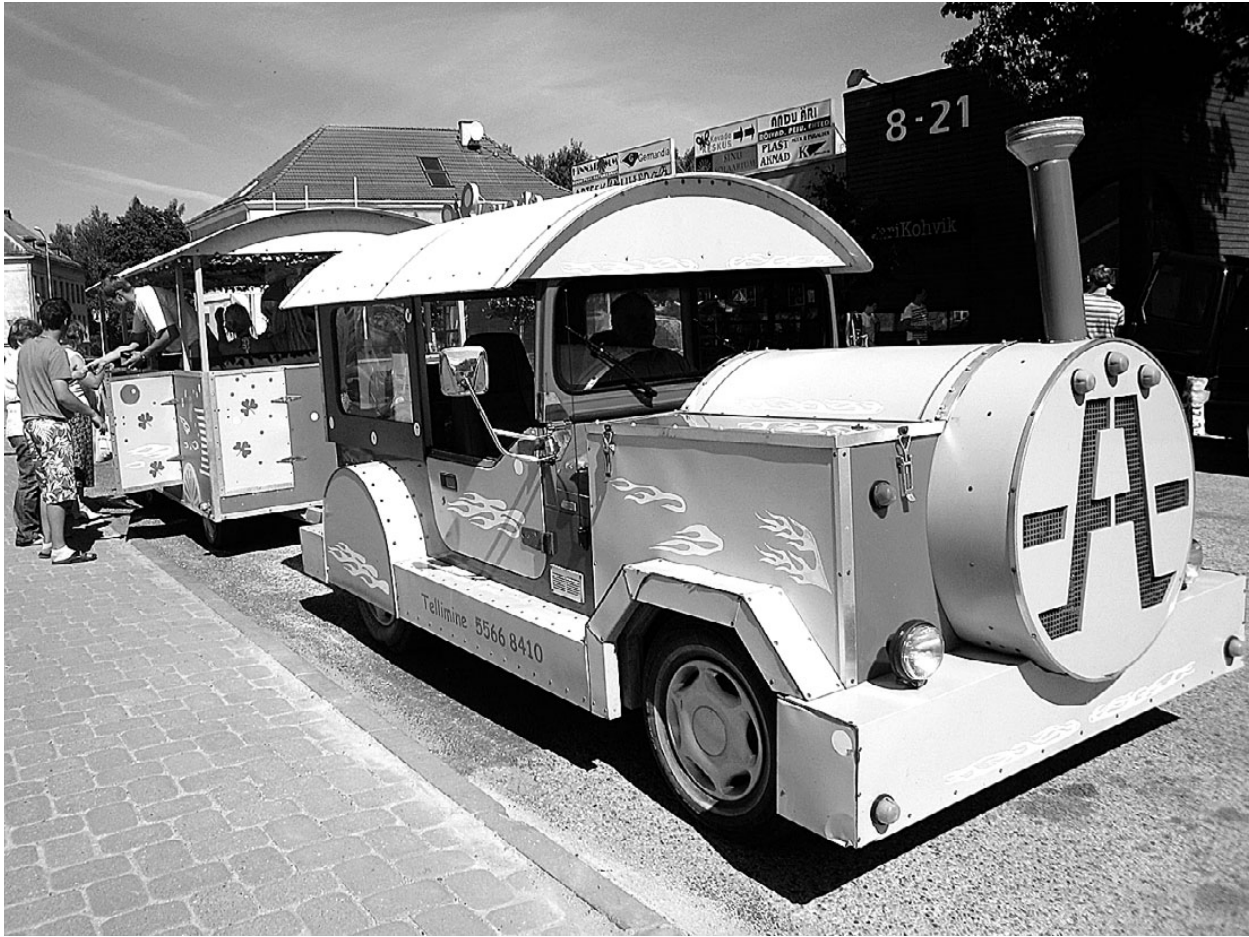
Tõrva linna päevad 2010