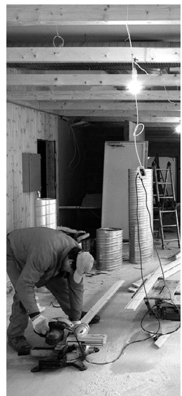
Veel selle aasta märtsis käisid noortekeskuses ehitustööd täie hooga.