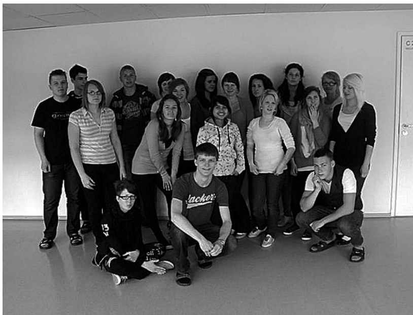
Neera koos oma klassiga

Paljud inimesed on mult küsinud, et kas olen lund näinud. Enne Eestisse tulekut oli mu vastus «ei». Näha esimest korda lund oli tõeliselt põnev ja eriti ilus oli see päikesepaistel.