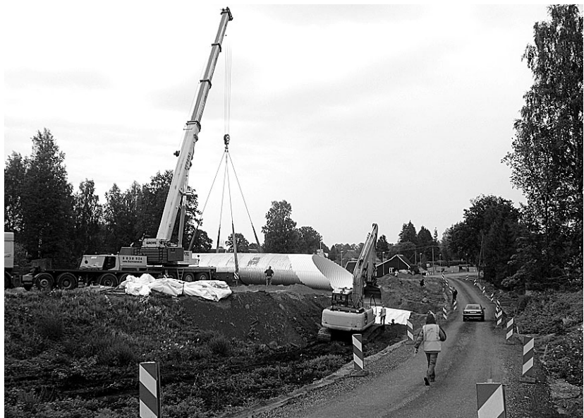
Tabatud ajalooline hetk – Ala sillakonstruktsiooni paigaldamine 2008. a suvel. 2 × Tarmo Tamm