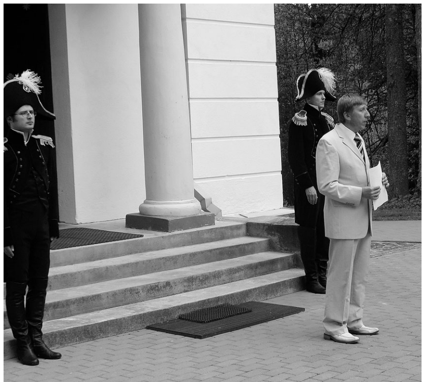
Barclay de Tolly renoveeritud mausoleumikompleksi avamine 16. mail 2008.