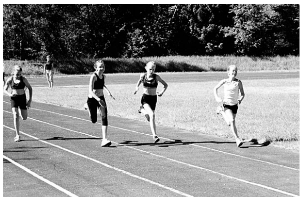
Kergejõustikuseriaali 60 m jooks tüdrukutele. Rein Leppik

Kergejõustikuseriaalil peeti kolm etappi, millest arvesse läks (punktitabeli alusel) igalt alalt (60 m, kaugus, pall, 300 m) kaks paremat tulemust.