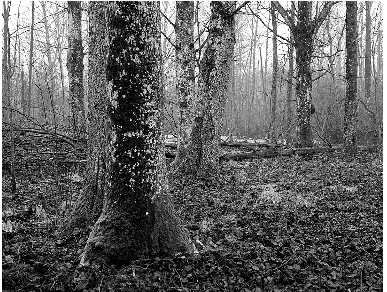
Fällarna haavik Vormsil.