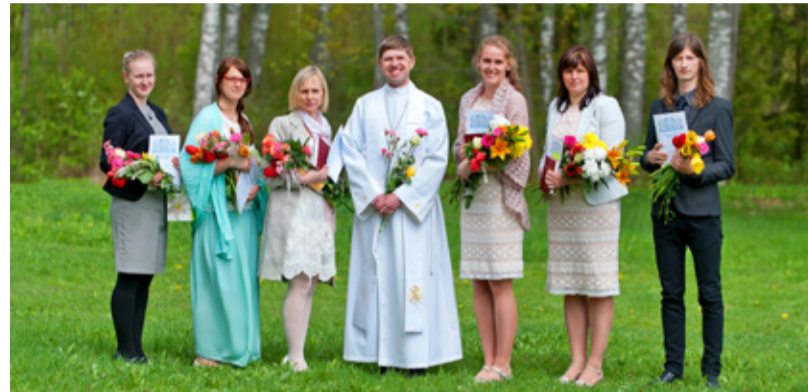
Helme leeripüha.

Helme koguduses toimub igal aastal üle 60 peajumalateenistuse Helme kirikus, Tõrva kirik-kammersaalis, Riidaja kirik-kabelis,