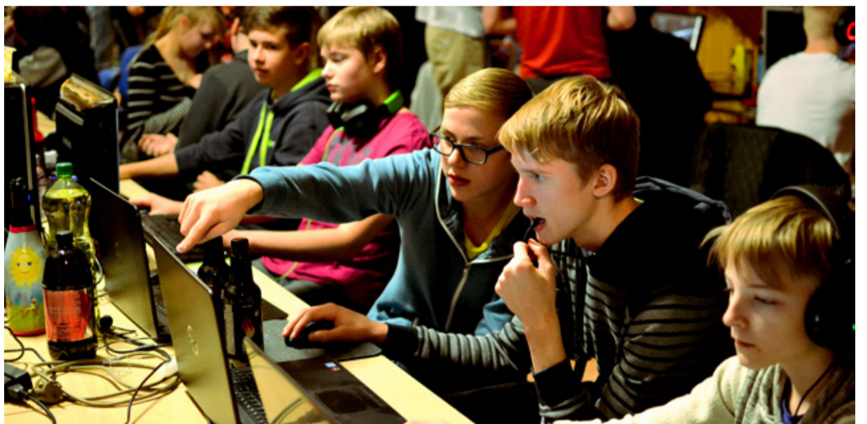
Ligemale 150 noort olid tulnud veetma ööd mängides.

Tõrva Avatud Noortekeskus on väga hea ÖöLänni-taolistete ürituste korraldamiseks, sest kolmandal