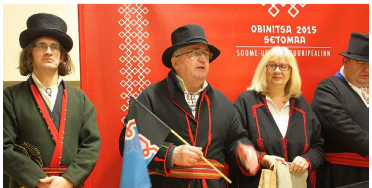
Setodele tervitusi edastamas. Obinitas, soome-ugri kultuuripealinna avamise puhul Agu Kabrits 372

viimastel aastatel pannud aluse ka mulgi keele arengule, mis on ühe rahvakillu elujõu üks tähtsamatest garantiidest – kuni elab keel, elab ka rahvas. Esialgu küll tagasihoidlikult, ainult omavahelistes vestlustes on tõdetud,