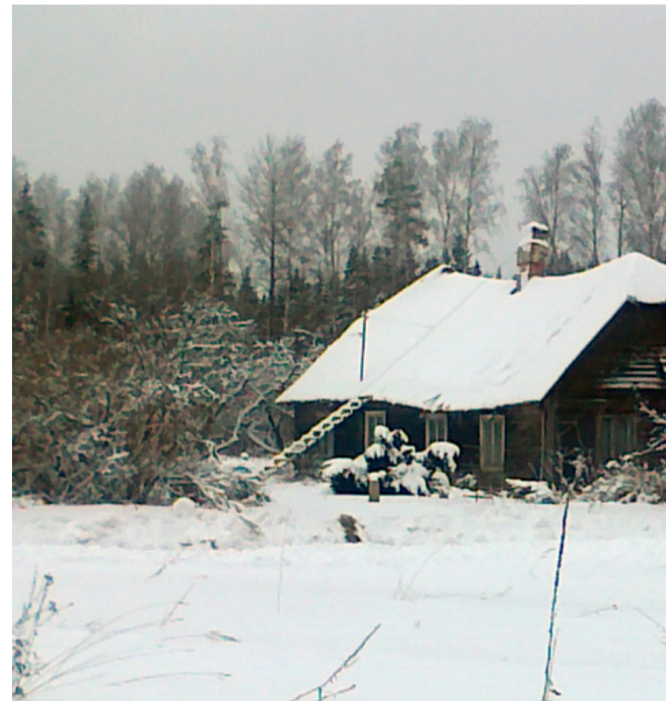
Oh, tule, noor ja tugev mees, ehk paljud vanad talukohad vajaksid uut ja tegusat peremehed.