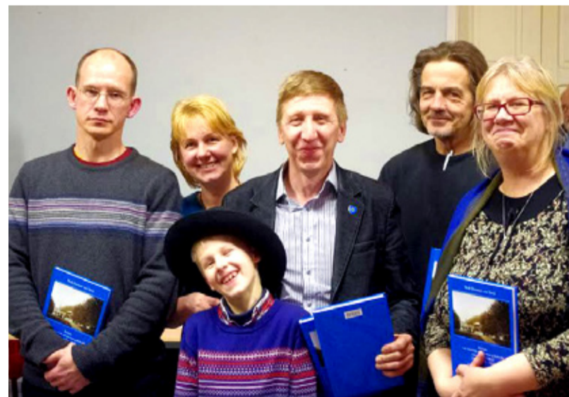
Helme võidukas mälumänguvõistkond.

Helme mälumänguvõistkond teenis sel korral 32 punkti võimalikust 48 punktist. Helme võistkonna järel tuli Hummuli meeskond, kelle punktitleduseks oli 31. Mulgi mälumängu korraldaja Kai Kannistu sõnul kipubki nii olema, et võit läheb selle kihelkonna meeskonnale, kus mäng toimub. „See