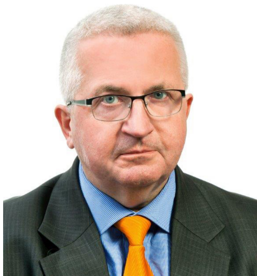
AGU KABRITS KANDIDAAT NR. 372