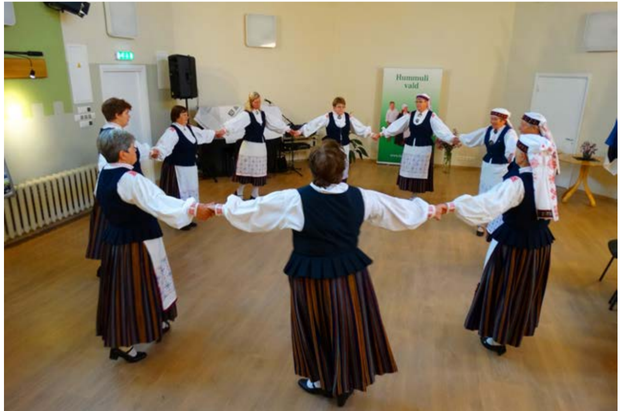
Hummuli valla memmede rahvatantsurühm Hõbejuus ei pidanud paljaks oma 20. juubelil tantsu lüüa.