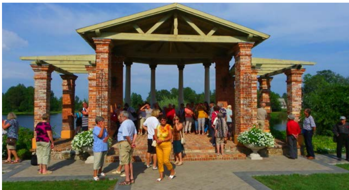
Hummuli eakad nautimas ilusat ilma Birini lossi aias Läti ekspursioonil.

Lõhmusele,“ on Miske õnnelik, et viimasest Läti ekspursioonist võttis osa koguni 46 huvilist. „Eelnevatel aastatel oleme läbi käinud paljud Eestimaa paigad, nagu Tõstamaa, Põltsamaa, Põhja-Eesti, Peipsi ääre vanausuliste piirkond, Haapsalu, Tartu piirkond, Lõuna-Viljandimaa ja veel paljud-paljud Eestimaa kohad,“ loetleb Miske esimesena pähe tulevad väljasõidud.