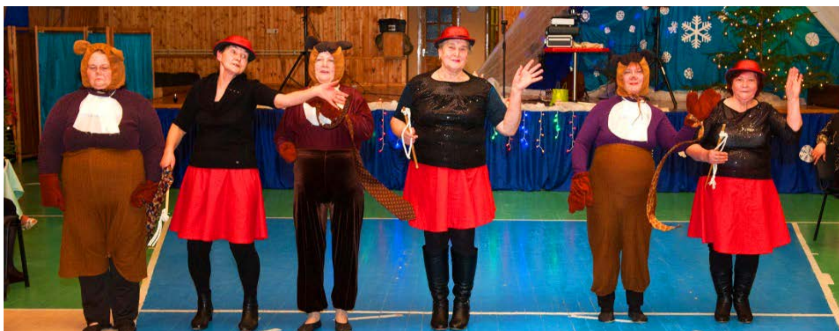
Kärstnast pärit eakad ehk Mede küla eided esinesid külalistena Helme vallatöötajate jõulupeol.