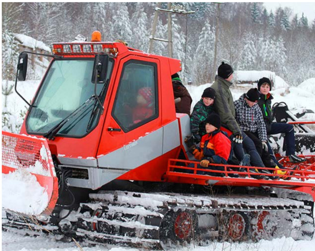
Rajatraktor on muuhulgas ka lastele põnev uudistamisobjekt.

Reedel, 15. jaanuaril alustati 2016. aasta Tõrva suusaseriaaliga, milles on kuus etappi - kolmel korral sõidetakse valgustatud rajal ja kolmel Härma ringil. Erinevaid vanuseklasse on 14 ja ka igal etapil on erineva pikkusega suusadistantsid- ikka algajatele lühemad ja juba suurematele suusasõpradele pikemad. „Olenevalt lumeoludest on kavas nii klassikalises kui vabas tehnikas sõidetavad etapid. Seeriavõistluse lõpparvestusse lähevad 5 parema etapi tulemused, eraldi autasustamist peale iga etapi lõppu ei toimu,“ selgitab Neumann võistlussüsteemi. Küll aga jagatakse osavõituaahindu igal etapil kõigile