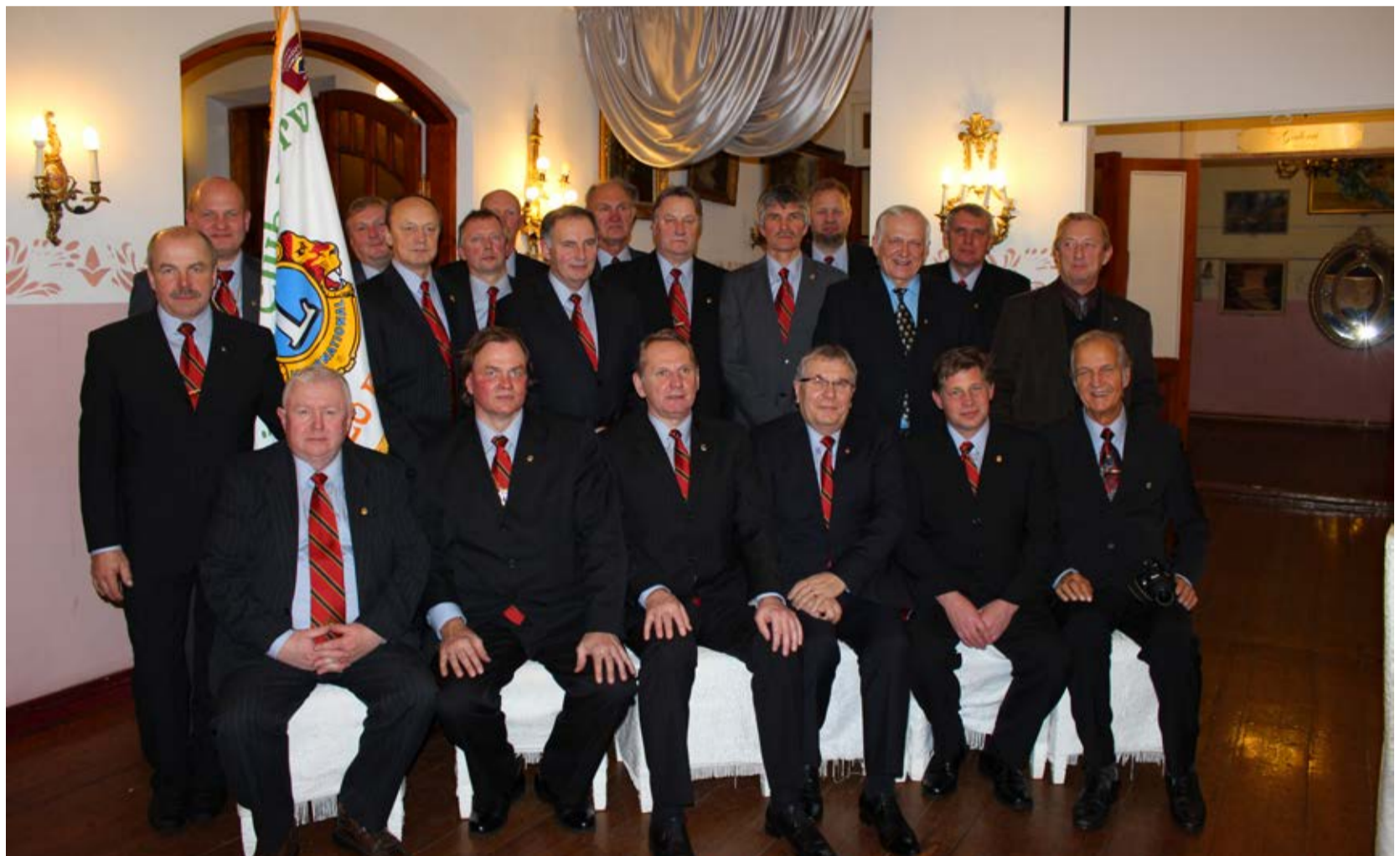
Lionsi klubi liikmeks saamine on tõeline privileeg.