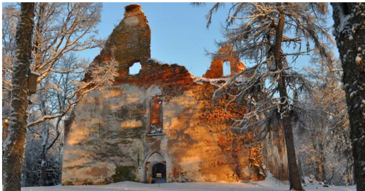
Struve olulisim vaatluspunkt asus Helme kiriku tornis.

luspunktidest avanevat vaatevälja oma kuulsa kolmnurkade süsteemi (triangulatsiooni võrgustiku) kujundamiseks, mille trigonomeetriliste arvutuste (kaugus – ja kõrgussuhete) põhjal Liivimaa tuntum maamõõtja ja topograaf G. Rücker tegi uue Liivimaa atlase. Tänu Struve ja Rückeri koostööle saame teada mitte ainult Helme kirikutorni kõrguse (131,37 m üle merepinna), vaid ka olulise fakti, et juba 180 aastat tagasi, 1836.a avanes sealt vaade uue kasvava kihelkonnakeskuse TÕRVA esimestele majadele.