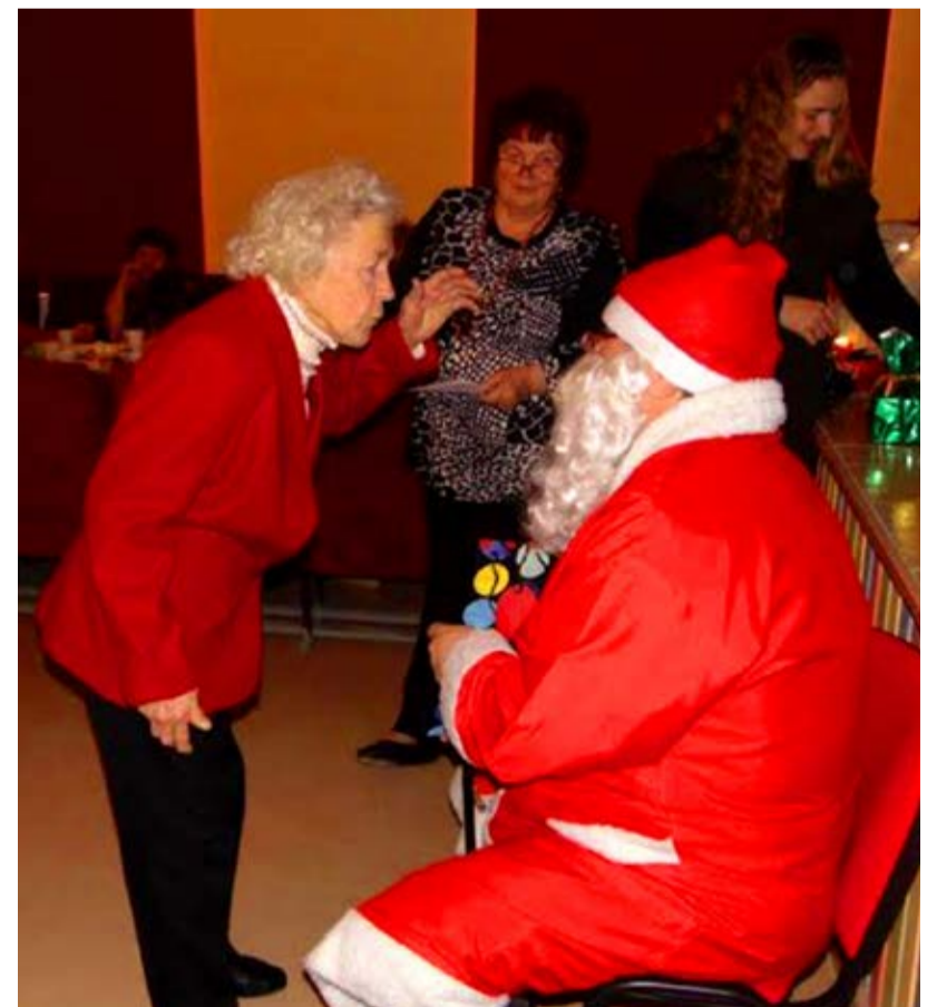
Pensionäride jõulupeod on Põdrala vallas tõeliselt menud.

Hummuli valla tegusatele eakatele meeldib kirjutada luuletusi ja jutukesi, mida koosviibimistel ka ette kantakse. Sellist üritust on aidanud läbi viia raamatukogu juhataja