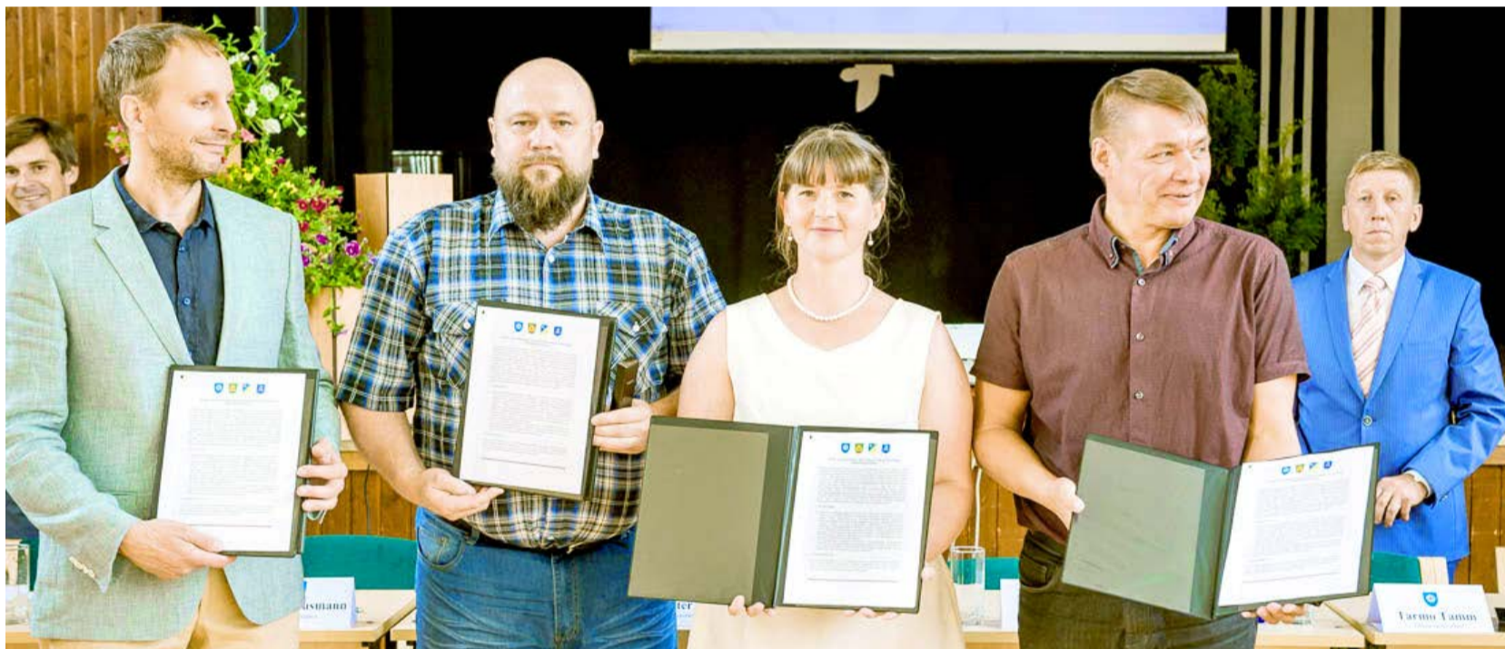
Volikogu esimehed allkirjastatud ühinemislepingutega. Taamal olevate omavalitsusjuhtide ilme reedab paljuski ka nimehääletuse tulemusi.