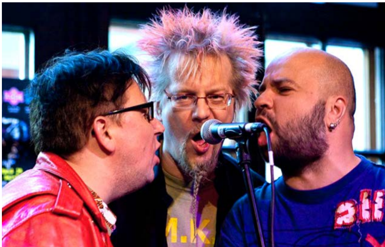
Legendaarseid punklaulikuid saame näha tänavu Loitsu laval.

Ajal, kui Euroopas ja Eestis toimuvad ühiskondlikult ning poliitiliselt murrangulised sündmused, on suvine tipp-sündmus Tõrva Loits pakkumas retrospektiivi iseseisvumise ja vabaduse tähendusest läbi aastakümnete. Tõrva Loitsu loovjuhi Reigo Ahvena sõnul räägib tänavune Loits lugu sellest, kust me riigi ja rahvana tuleme, hetkel oleme ja mis võib tulevik tuua. Selle