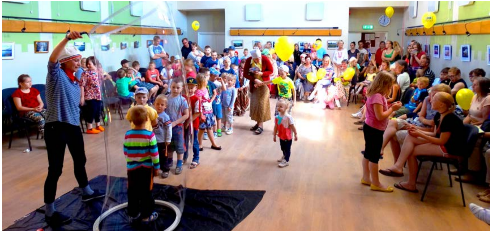
Mullimeistri show ajal moodustas huviliste järjekord pika rivi.

Pika traditsiooniga perepäevatoimik toimus ka käesoleval aastal. Küsimused olid Hummuli valla, mere- ja mulgiteemalised. Osa-