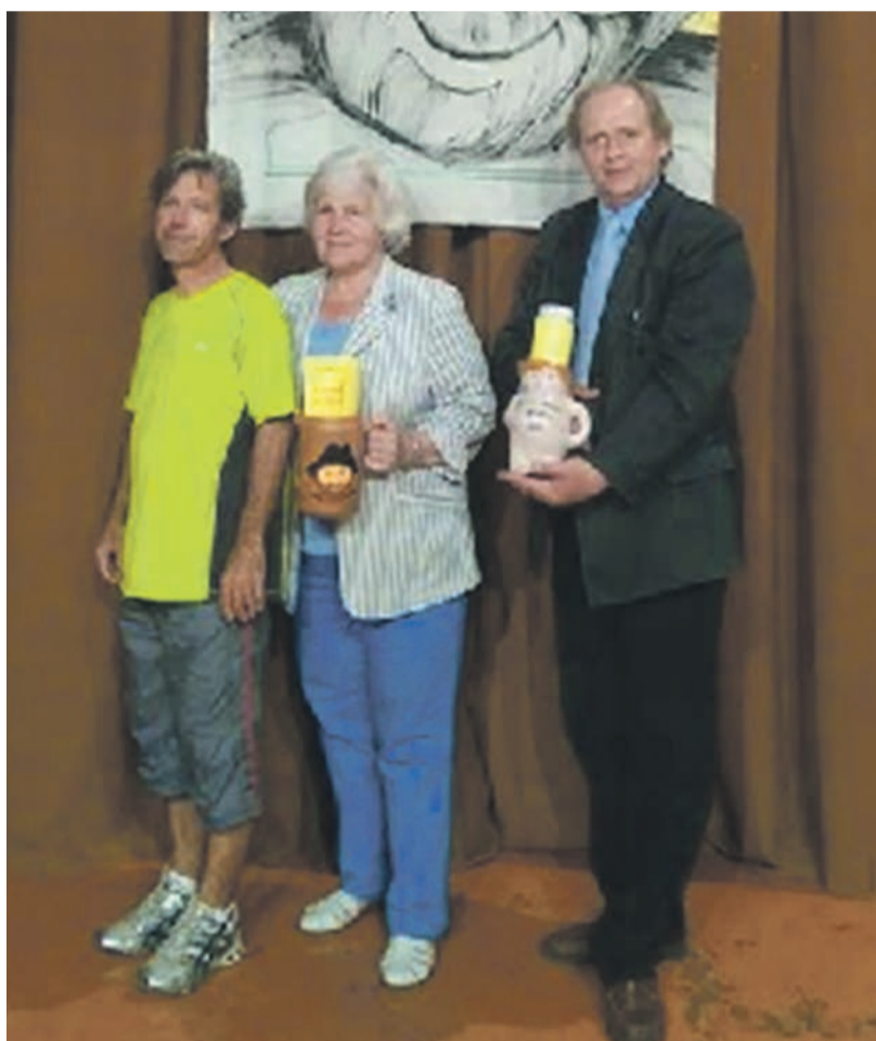
Tõrva Tilgad eelmisel aastal Väätsal huumoriõhtul "Maamees muigab".

Et anda omapoolne panus teatrikuu tähistamisse ja mitte ära unustada 1. aprilli kui naljapäeva, kor-