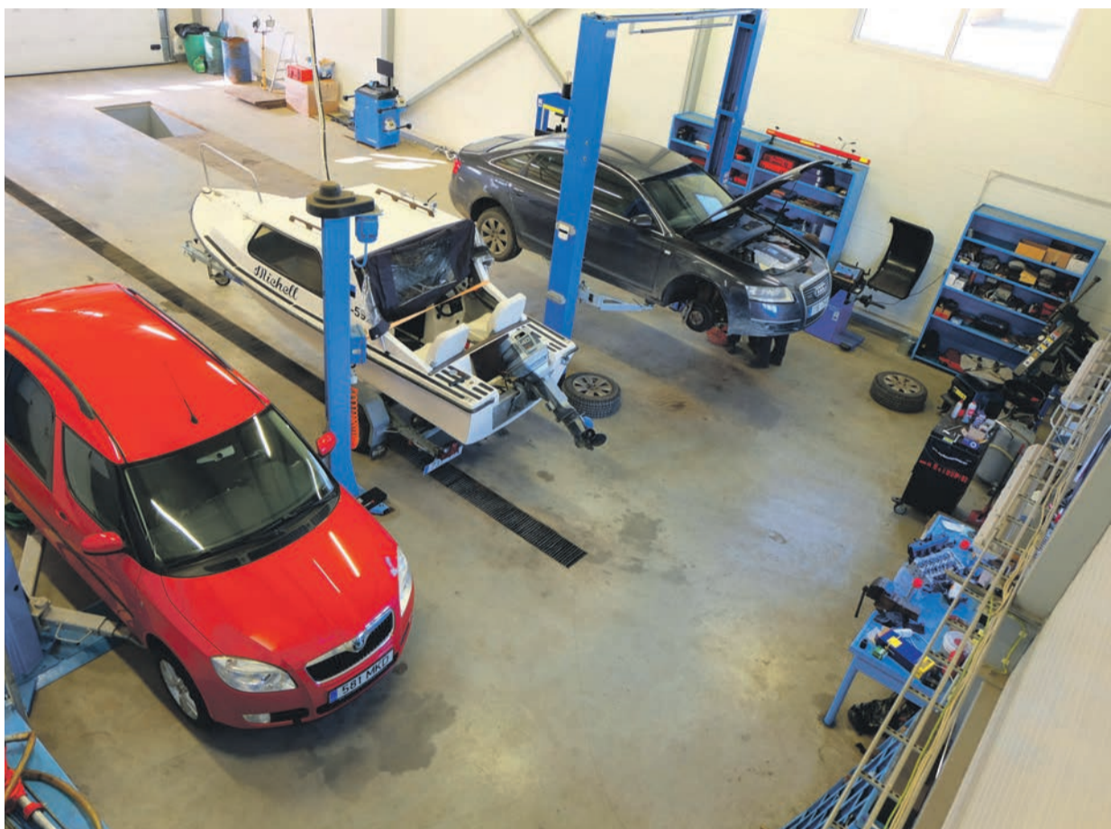
TM Hooldusgrupi suurtöökojas saadakse hakkama ka paatide remontimisega.