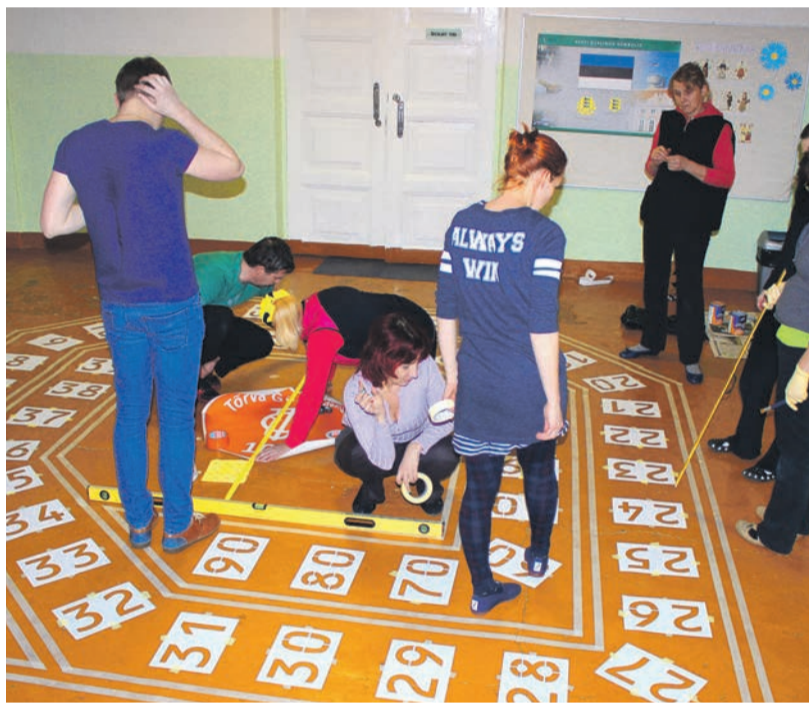
Maakonna esimene siseterviserada pakub koolilastele uudset tegevust.

Plaan rajada Tõrva Gümnaasiumis esmalt algklasside maja rada sai alguse novembri keskpaigast, seega ei läinudki palju aega ideest teostumiseni. Ju oli nii hea idee?! Tõrva siseterviserada sai nimeks Juku (J)algrada nii mõnelgi põhjusel: Juku on ju kõigi kooliga seotud anekdootide kangelaseks ja ka Tõrva