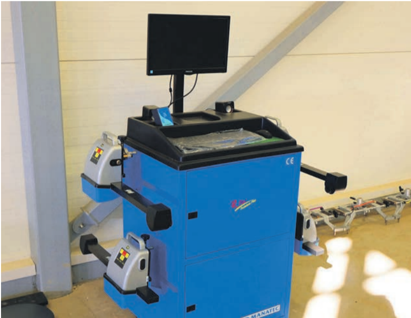
Uudne sillastend peaks leevendama ühte kitsaskohta autoremondis.

Maailma enimmüüdud automark on Toyota Corolla, mida müüdnud rohkem kui 40 miljonit ja mida on toodetud aastast 1966.