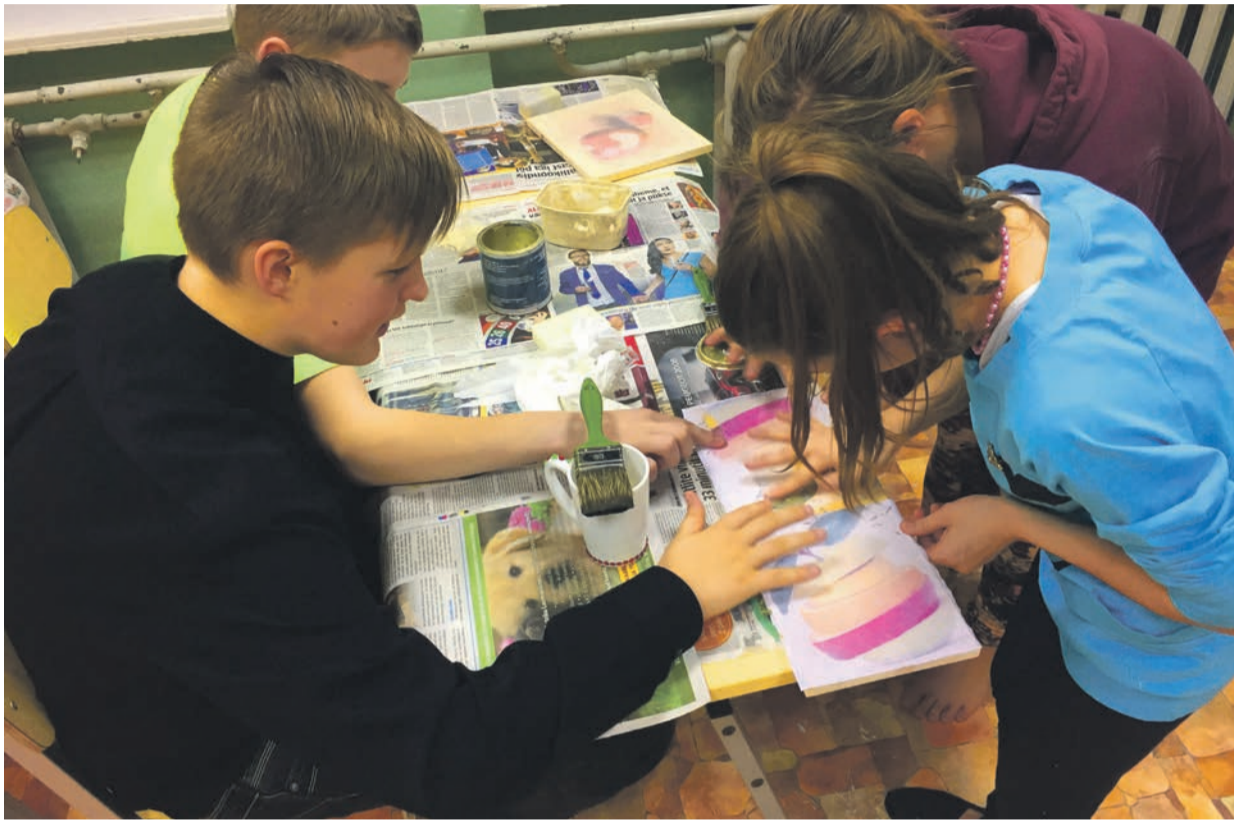
Nii valmivad noorte käe läbi lõikelaud.

T ihti kuuleme väljendit, et noorus on hukas või seda, et meie noored on laisad ega soovi midagi peale arvutis istumise teha. Tahaksime selle artikliga selle müüdi ümber lükata. Nimelt meie Ala Põhikooli 7. klassi õpilased ja üks 6. klassi noor tõestasid, et ettevõtjad võivad olla ka õpilased.