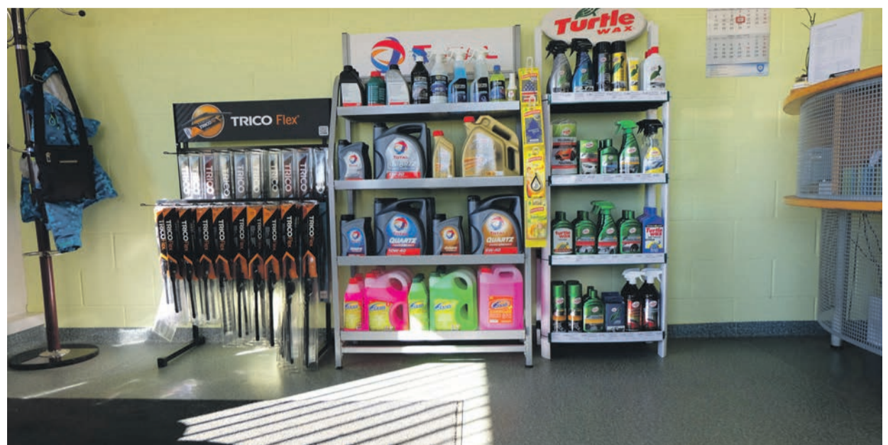
TM Hooldusgrupi kontoris on ka kena valik erinevaid vajalikke tooteid autoomanikele.