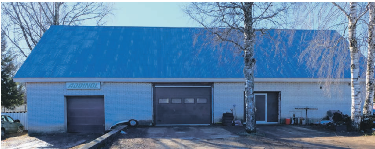
Tõrva A.R.T OÜ töökoda on tegutsenud juba rohkem kui 10 aastat.