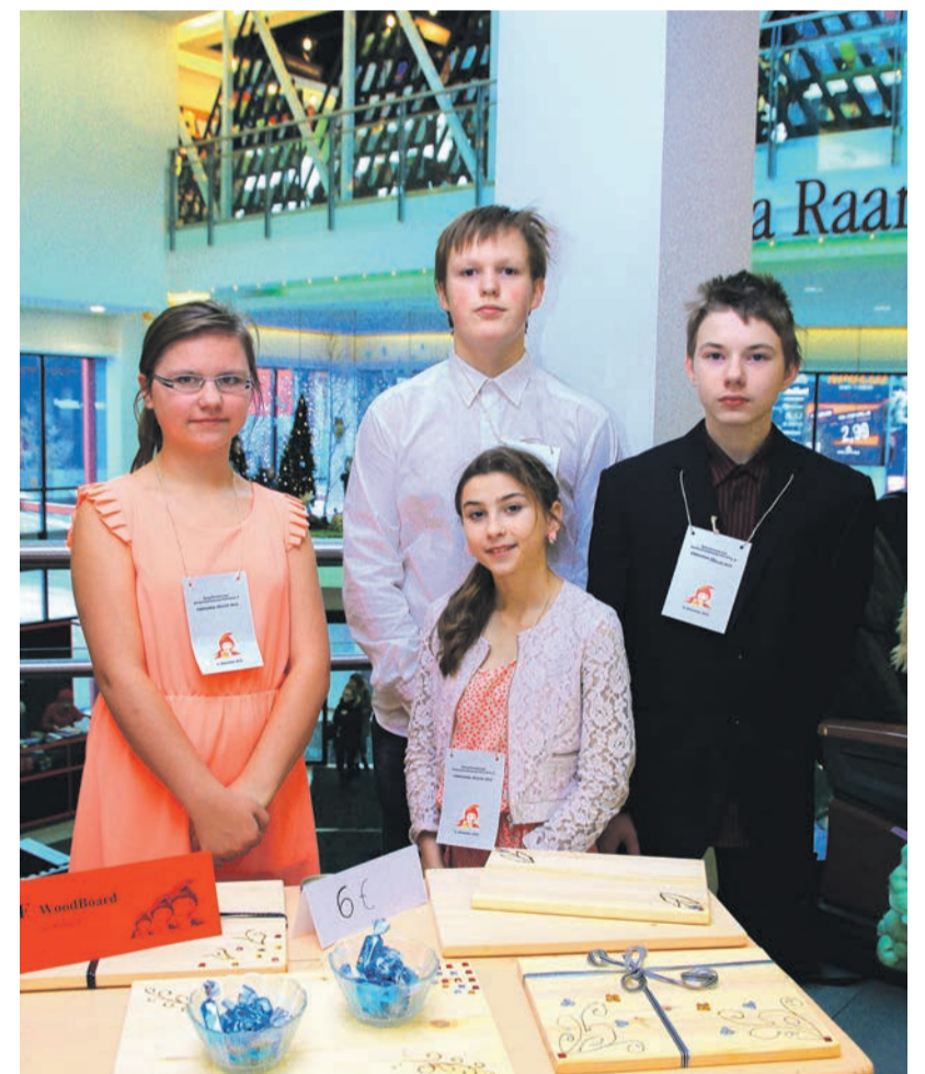
Tublid noored käisid oma tooteid tutvustamas ka Tallinnas.

Kallid noored, lapsevanemad, õpetajad ja lugejad, olgem avatud noorte iseseisvatele ettevõtmistele ning andkem neile võimalus ise õnnestuda või ka ebaõnnestuda, sest siis me õpime. Oma vigu saab alati parandada, kuid kui me ei lase neid teha, siis ei ole meil ka millegi poole püüelda. Soovime kõigile noortele ettevõtlikkude vaimu ja olgem innovaatilisemad, mõelgem väljapoole kasti, sest seda on Eest riigi arenguks vaja. Eesti riik vajab asjalikke ettevõtlikke noori, kes hakkavad tulevikus meie majanduses olulist rolli mängima. Jõudu ja jaksu!