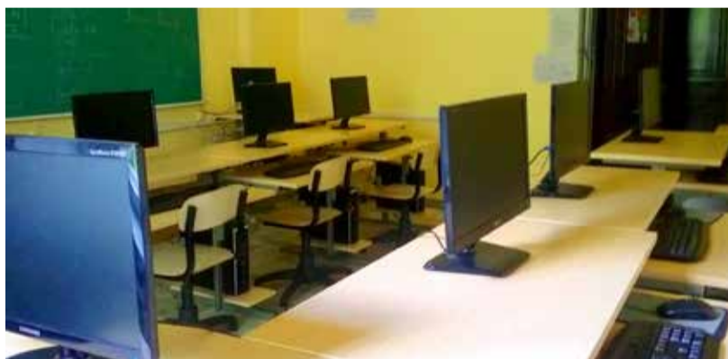
Tänavu saadi Haridus ja Teadusministeeriumi abiga uuenenud IT-seadmed

Aktusel peeti traditsioonilisi kõnesid ja jälgiti õpilaste esinemist. Järgnes kokkusaamine lendude kaupa ning hiljem mängis tantsuks ansambel Nõõp. Vilistlasi ja endisi õpetajaid oli kohale