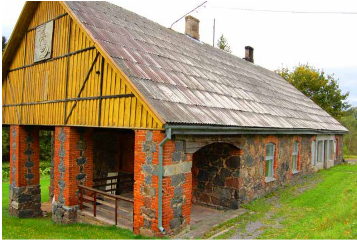
Legendaarne sepikoda on loodetavasti kindlates ja hoolivates kätes.