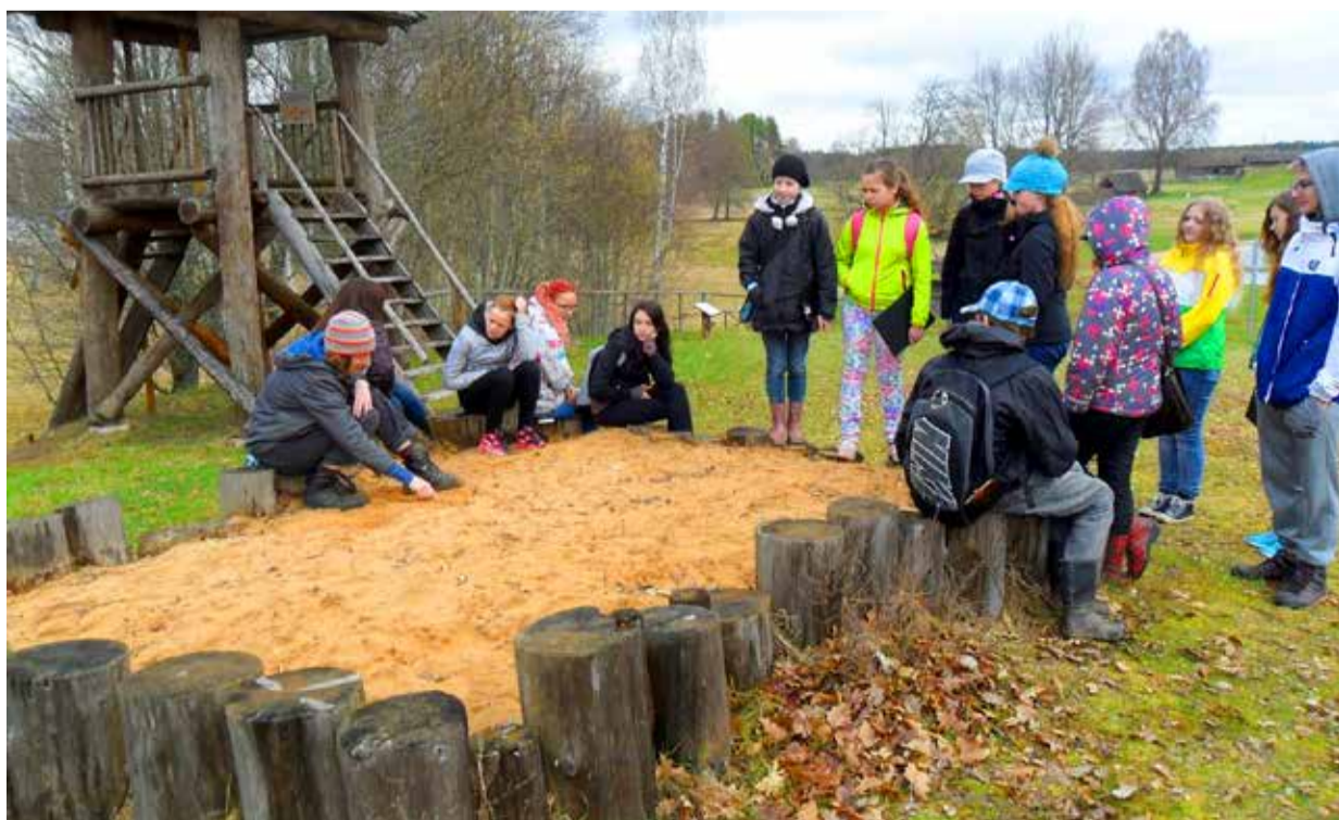
Ühiselt korraldatakse õppepäevi ja ekskursioone ka koolist kaugemal.

Kool toimib hästi, kui on koostöö õpilaste, õpetajate ja lastevanemate vahel ning kohaliku omavalitsuse toetav suhtumine.