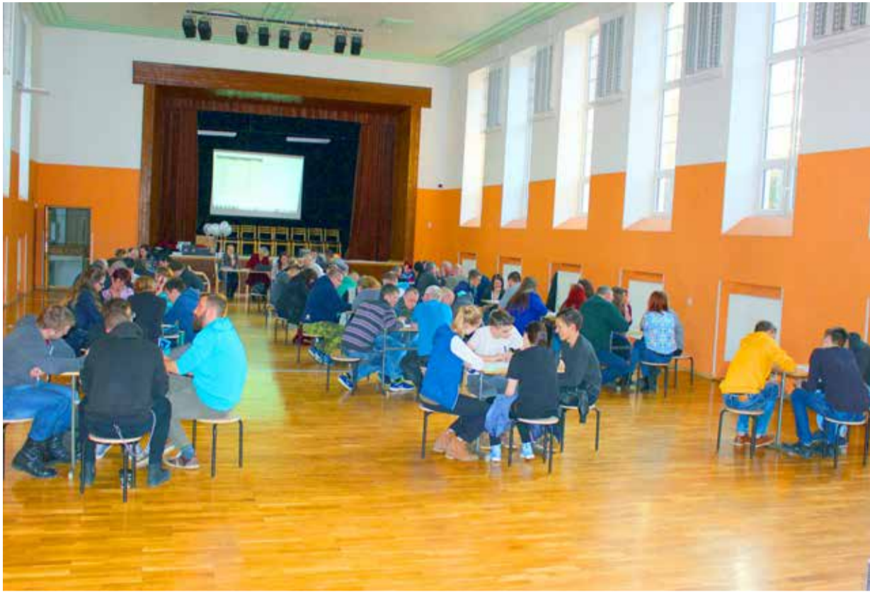
Mälumänguhuvilisi kogunes taaskord terve saalitäis.

T õrva XI mälumänguturniiri kolmas ja viimane etapp toimus 8. aprillil Tõrva Gümnaasiumi aulad. Saali kogunenud võistkondi oli 18 ja õhkkond oli ärev. Kuigi tundus, et kahe voo kokkuvõttes esikohal olevat võistkonda Viktor enam ei püüa, põles ikkagi kõigi võistkondade liikmete silmis tuli ja loodeti parimale tulemusele.