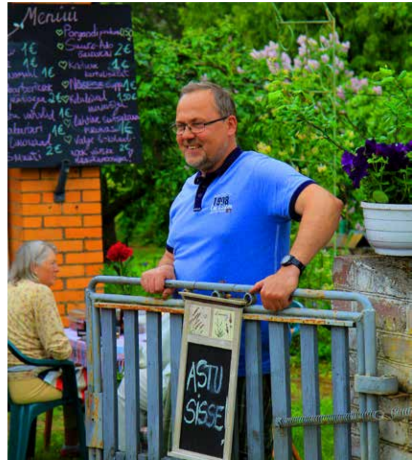
Oma koduvärvatest kutsutakse kõiki sisse naerulsui.

Endises KEKis on tore valik – lapsed ja emmed saavad minna Mängumaja kohvikusse. Issid ja kõik teised roki- ja õllesõbard aga võiks