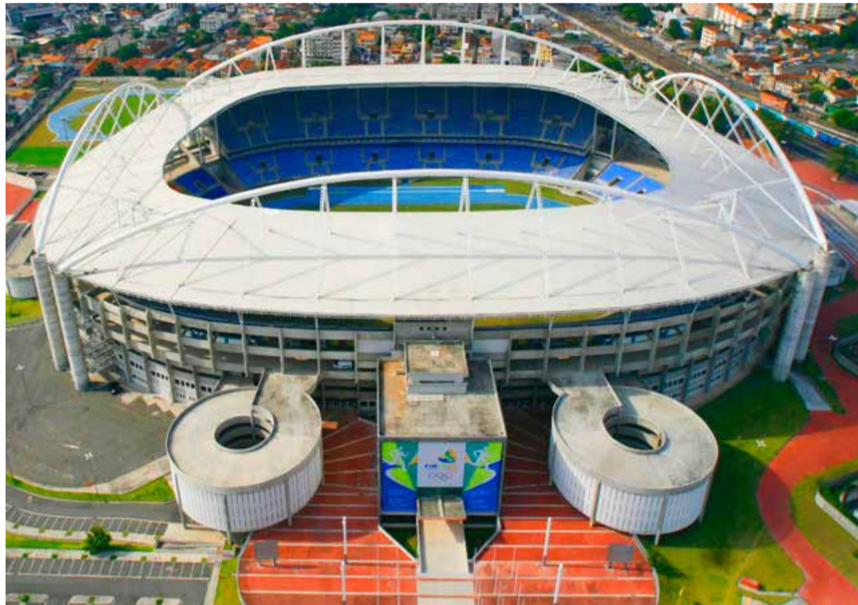
Sellisel võimsal staadionil toimub ka oodatud odaviskevõistlus.

Laanmäe on samuti rahul, et talvine ettevalmistus sujus ladusalt. „Kõik treeningetapid, mis olid ette nähtud ja plaanitud, said tehtud. Kerged probleemid olid jalgadega