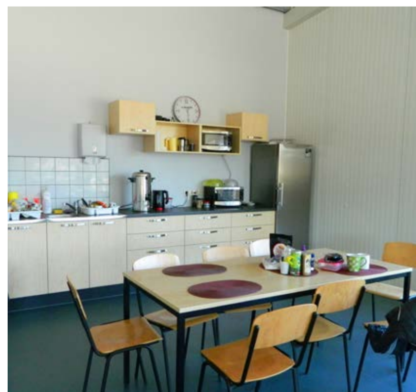
Skan Holzi töötajate puhkeruum, kus saab ise süüa teha ja pärast vahetust puhata.