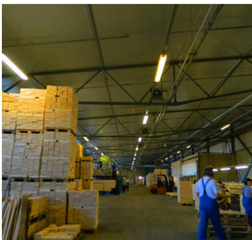
Skan Holzi tehaseruum.