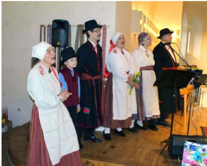
Kontserdil musitseerisid nii väiksed kui suured.

Seoses ansambli 45. juubeliga tekkinud olukord tõigi uuesti välja „Jaurami“ nime loo. Loo, mis oleks olnud vaja lahendada 2 aastat tagasi. Näen selles nii linnajuhtide kui ka kultuuri juhtivate isikute poolt lahendamata olukorda.