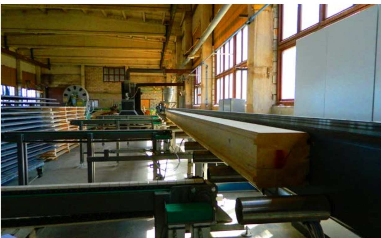
Ritsu AS-i uus patenteeritud tootmisliin.

Maaelu püsijäämisel ei saa iial alahinnata selliste tublide tööandjate ja töötajate pingutust ettevõtete püsijäämisel. Nagu laulusalm ütleb „kuni su küla veel elab, elad sina ka” ehk loodetavasti on meikandi nii suuremate kui päris väikeste asulate tegusad firmad pika ja kuulsusrikka tulevikuga. Seda enam, et nende firmade eesmärk pole kiiresti koor riisuda ja siis ukseid kinni panna, vaid igapäevaselt arenetakse nii toodangu kvaliteedi kui töötingimuste suhtes. Siinkohal pole Linna küla ettevõtjatel õppida ainult alustavatel ettevõtjatel, vaid ka juba kaua turul olnud tegijatel.