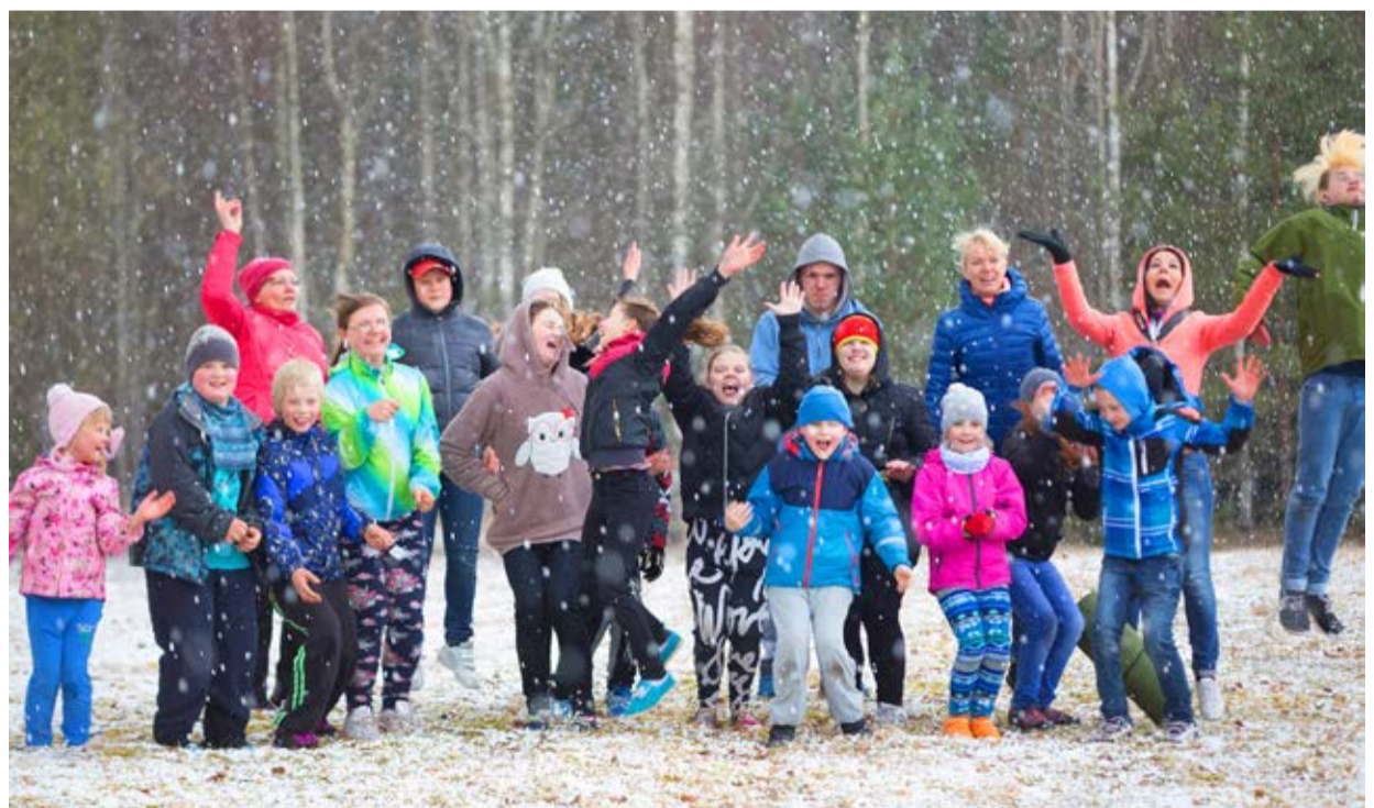
Kuigi kalendri järgi oli juba kevad, möödus fotomatk talvistes oludes.

kumisele said lapsed ka teadmisi taimeluringist ja sellest, mida taim nagu inimenegi tervelt kasvamiseks eluks vajab - juua, süüa ja palju armastust.