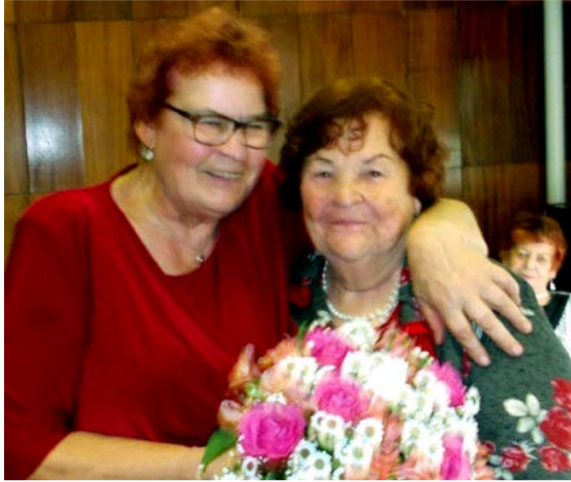
Rõõmu jagus peol kõigile.