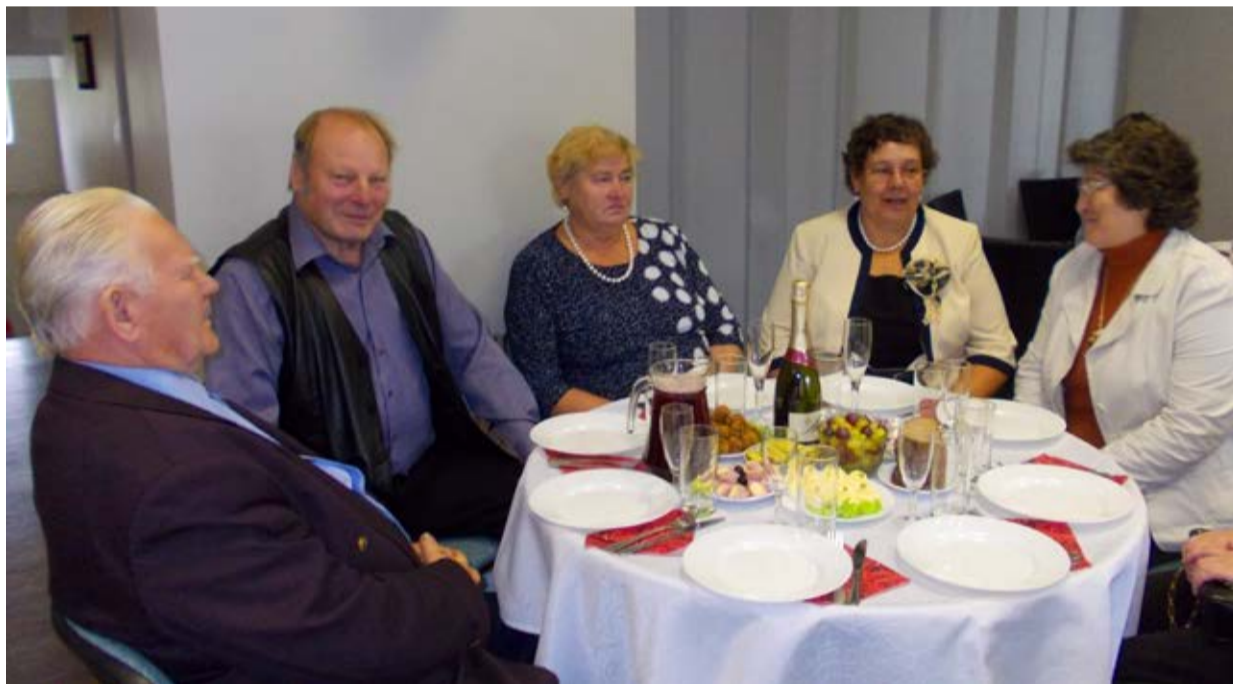
Head- paremat jagus kõigile kohalolijatele.