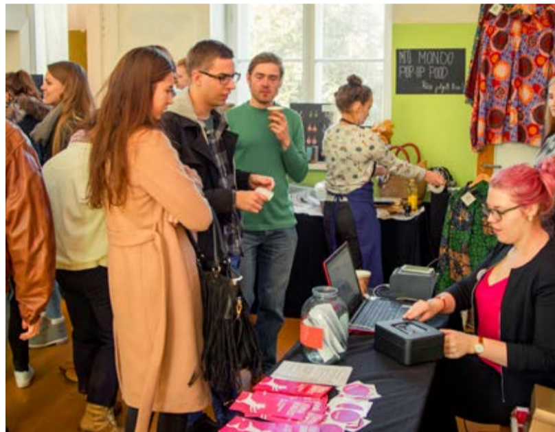
Legendaarses kinomajas pakuta ka söögi- ja joogipoolist ning meeneid.

Toruni dokumentaalfilm Istanbuli tänavakassidest.