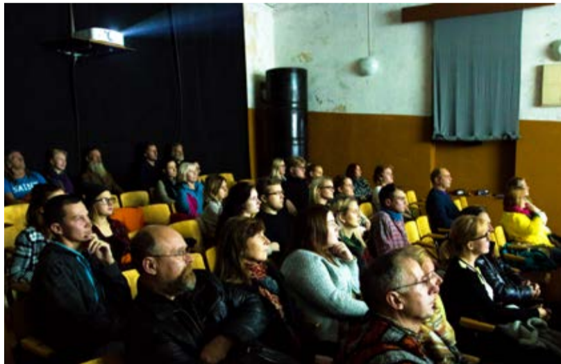
Populaarsemad filmid said nautida suurt publikuhoovi.

Populaarsemateks filmideks osutusid sel aastal kodumaine „Nõukogude hipid”, Terje Toomistu film Nõukogude Liidu hipiliikumisest ja „Kedi”, Ceyda