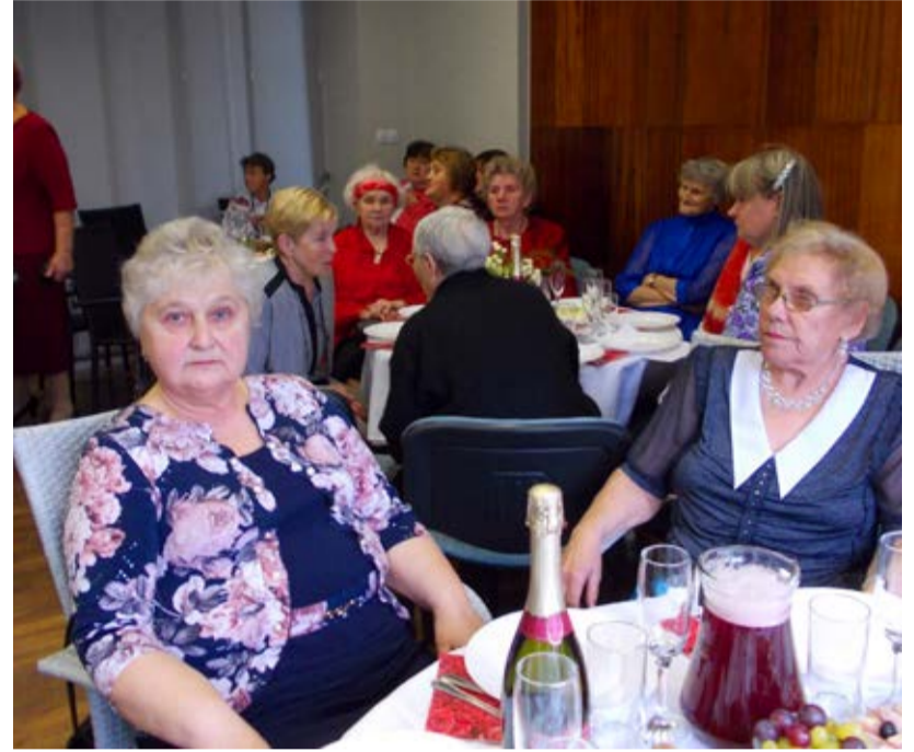
Suurele juubelile tuli kokku saalitäis rahvast.