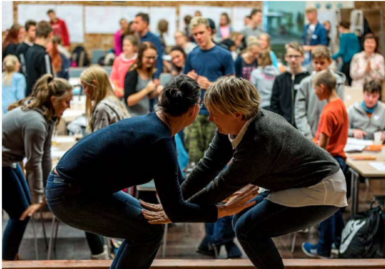
Käärikul toimunud "Nupp nokib" loovuskoolitusel oli lõbus nii lastel kui juhendajatel.

Lisaks müügist teenitavale tulule on noortel võimalik pretendeerida auhindadele, mis on välja pandud parimatele mini- ja õpilasfirmadele.