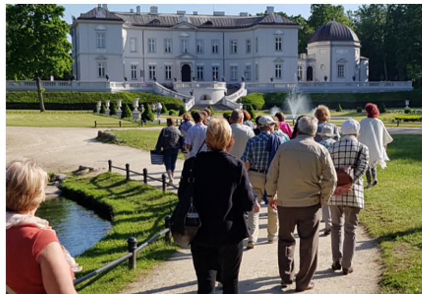
Ekspursioonid on viinud paljudesse kaunitesse paikadesse.