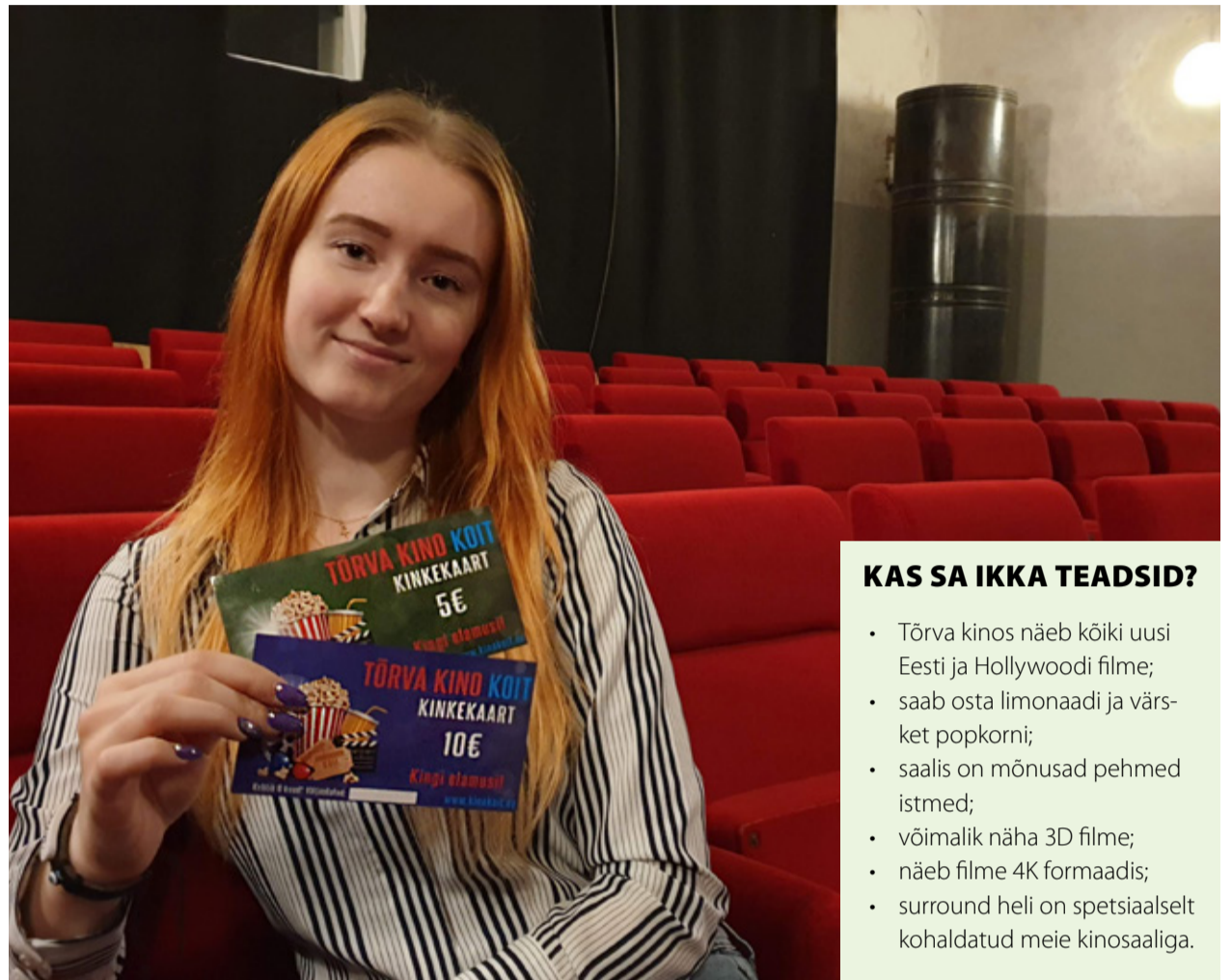
Tõrva kino pakub nüüdsest ka kinkekaarte.

Nüüd on võimalik kinost osta ka kinkekaarte, mis on saadaval väärtuses 5€ ja 10€. Kinkekaardiga saab tasuda filmide piletite eest ning ka karastusjookide ja popkorni eest.