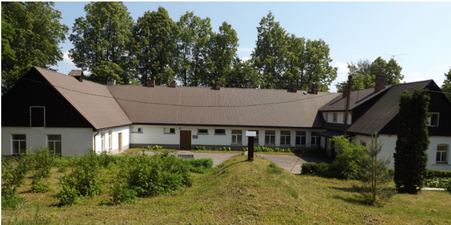
Pikasilla koolimaja.