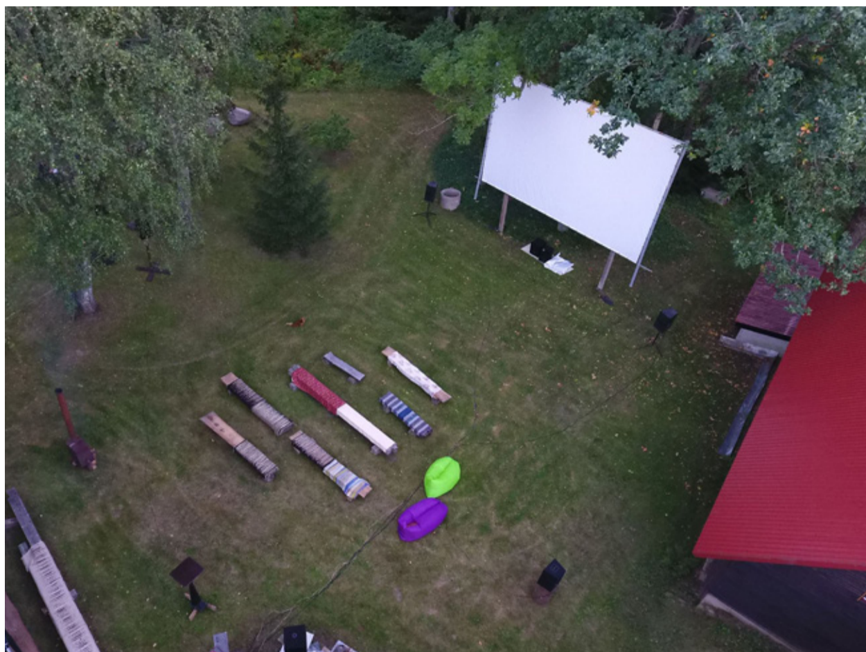
Piiri küla õuesaal.

Kinokorralduse taseme eesmärk ei saa olla kindlasti mitte väiksem kui maailmatase. Kinos, kui meelelahutuses on oluline iga detailike. Alates