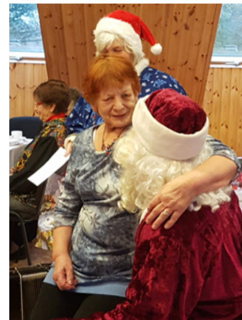
Jõuluvana on kohal igal aastal.