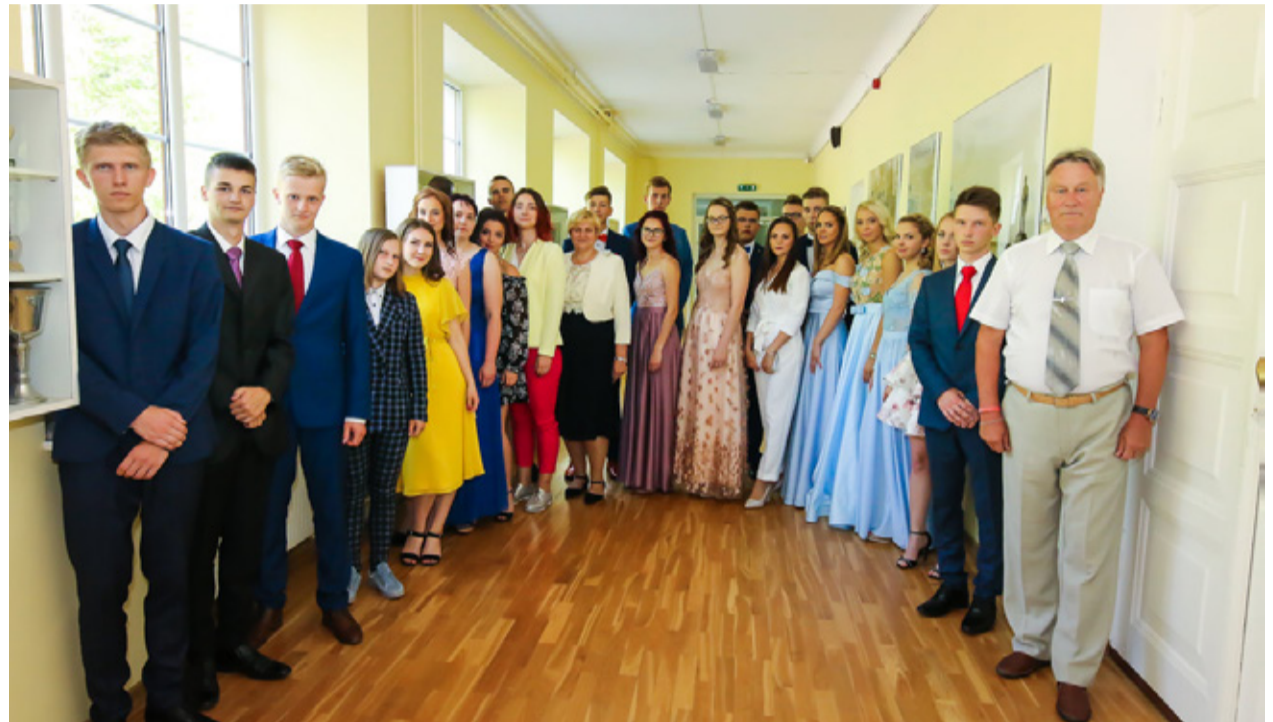
Tänavused koolilõpetajad lõpuaktusel.

Kitsa kursuse matemaatika eksamil sai 100 punkti sel aastal 2 õpilast, kuid laia matemaatika eksamil saavutas maksimumpunktid koguni 39 õpilast. Matemaatikas aga