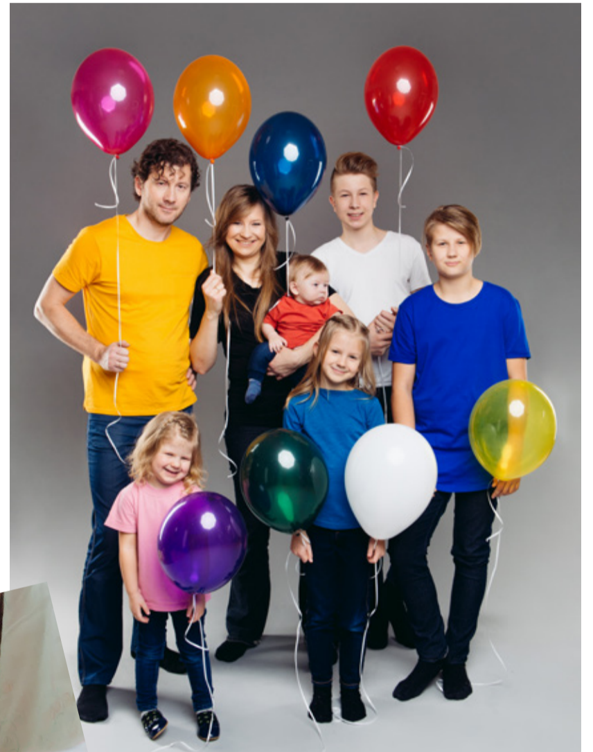
Laikrete perebänd.

Eisi vajab praegu ja ka tulevikus peale hoole ja armastuse palju erinevaid abivahendeid. Hetkel renditakse näiteks eristat, et Eisi saaks vahel ka