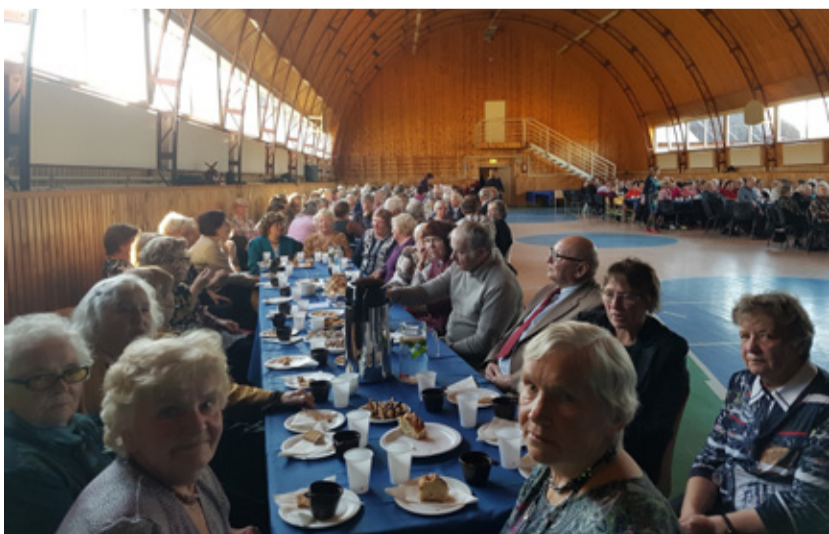
Maakondlikud peod toovad kokku sadu inimesi.