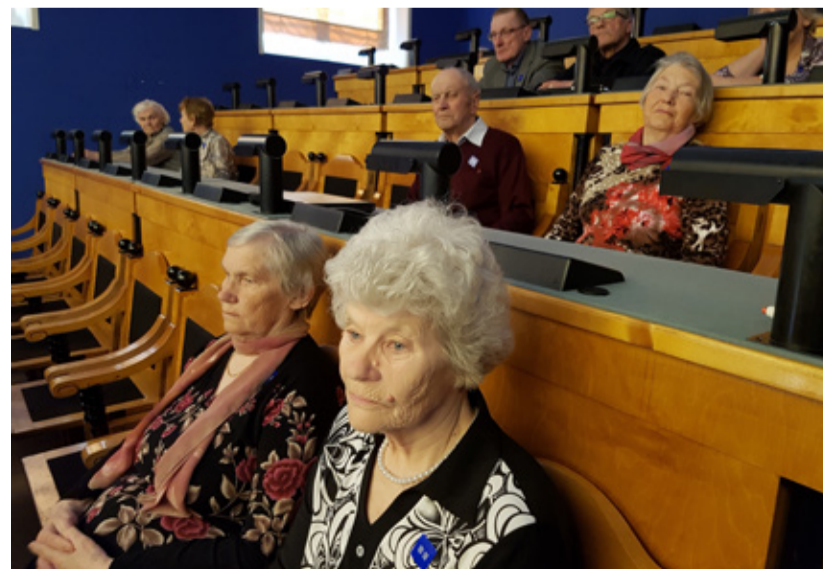
Külastatud on muuhulgas ka Riigikogu.