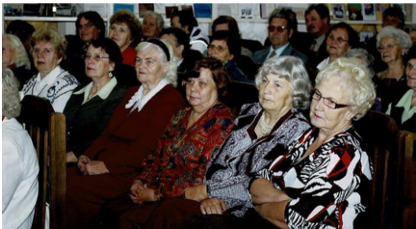
Meenutusi 50. juubeli tähistamisest.