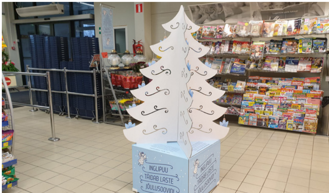
Tõrva Maximas asuv Inglipuu aitab täita kohalike laste jõulusoove.

Igal Inglipuu sedelil on kirjas lapse nimi, tema vanus ja kingisoov. Inglipuu patrooni Gerli Padari sõnul on mitmed jõulusoovid sageli