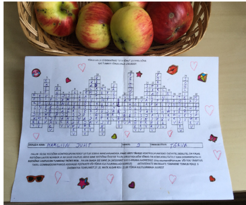
Selline nägi välja õigesti lahendatud ristsõna.

Eelmisel aastal viidi romukampaania ajal ära umbes 250 autoromu.