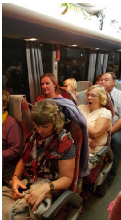
Tihtigi võetakse ka ette pikki bussireise.