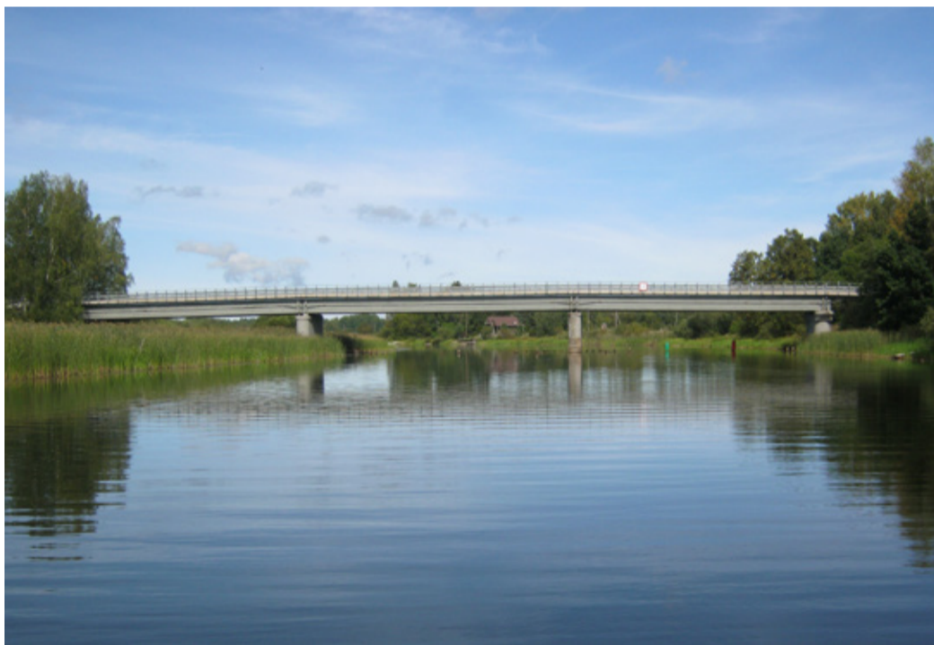
Prægune sild valmis 1959. aastal ja on 120 meetrit pikk. 2010. aastal toimus silla kapitalremont, mille käigus lammutati sild kuni taladeni ning ehitati uus, senisest kaks meetrit laiem tekiplaat.

Külas oli hävinud 20 majapidamishoonet. Ka koolimaja sai lahingute mõllus tugevasti kannatada. Jälle algas võitlus kooli olemasolu eest.