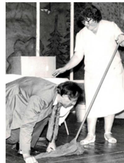
Pillimäng, tants ja näitemäng on olnud alati väarikate ürituste lahutamatuks osaks.