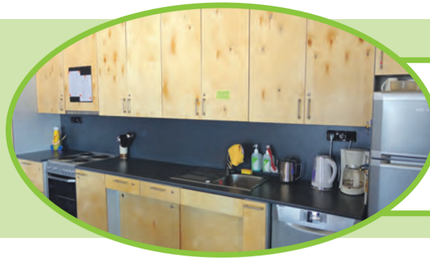
Kuigi toidukorrad tulevad allhankest, leiab köök palju praktilist kasutust