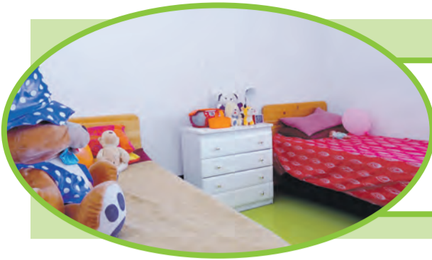
Tõrva Kodu toad meenutavad moodsaid ühiselamutube, on valgusküllased ja kompaktsed