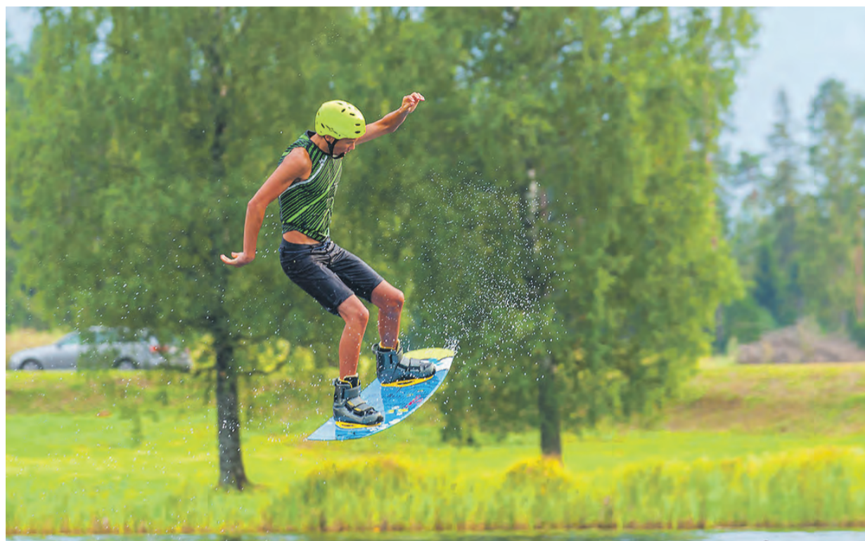
Julgemad saavad veelaua mõnused nautida, kuni Riiska järv jäävaba on.