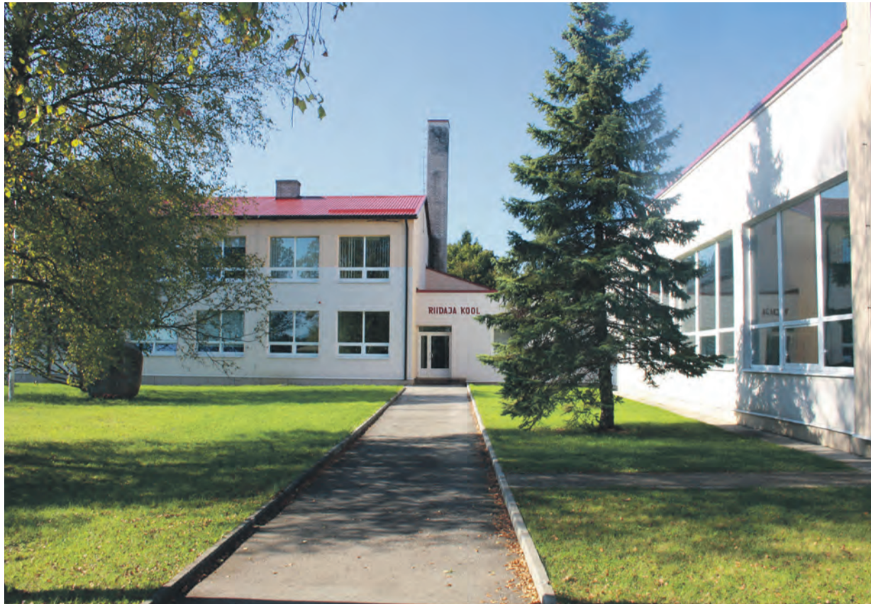
1967. aastast kasutuses olnud koolimaja on nüüdseks saanud uue küttesüsteemi, sportimisvõimalused ja värsket välisilme.