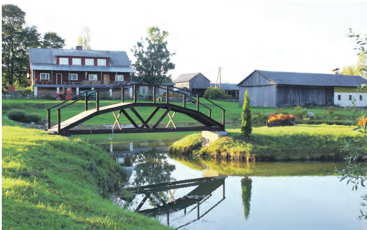
Aastaid on nähtud vaeva, kuid töö on vilja kandnud ning looduslähedust ja ilu võib kohata igal nurgal.

Ilmaril ja Milvil on kolm last ning kaheksa lapselast. „Kui lapselapsed olid väikesed, oli siin selline lasteaed, sest kõik käisid siia kokku,“ meenutas Milvi aastate taguseid aegu, kui terve hoov oli laste naeru täis. Nagu vanematel on kodukaunistamine hingelähedane, nii on saanud ka tütar Tõrva lähedal asuva kodu aia eest mitmeid tunnustusi.