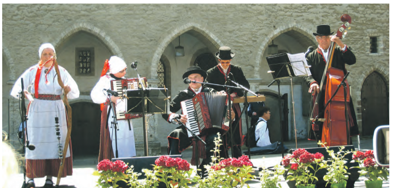
Jauram Tallinnas Raekoja platsi laval.

Itaalias osalenud tantsurühmade ja Jaurami esimene tõine proov toimus Mikitamäe kultuurimajas aprillikuus. Koostöö sujus hästi ja suvise festivali kava said viimistle-