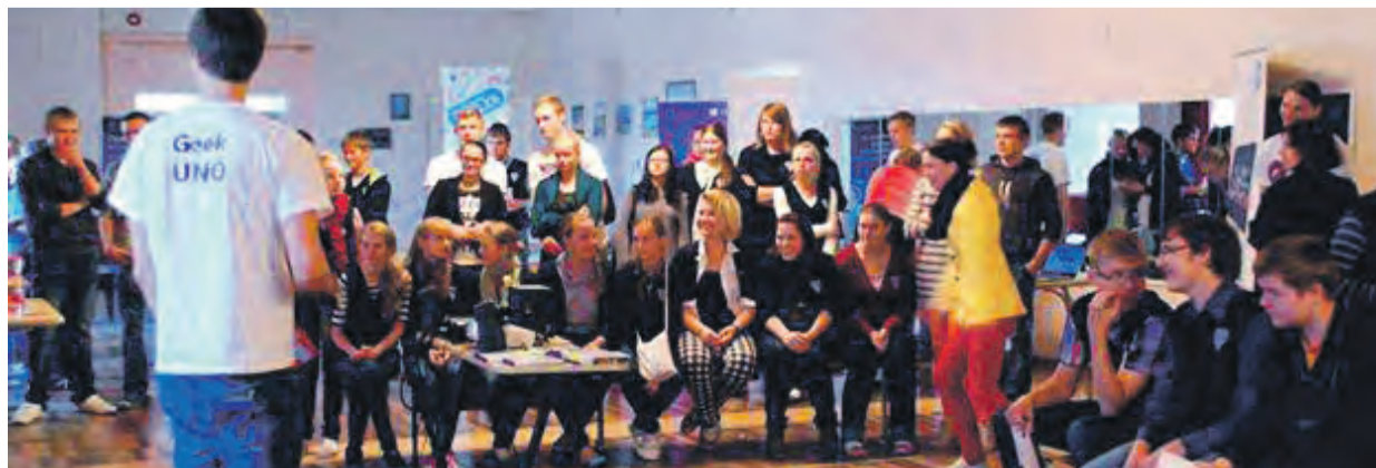
Nohikud oma teadmisi jagamas Orissaare gümnaasiumis.

Projekti korraldavad MTÜ MUG Estonia liikmed koostöös Microsoft partnernudengitega. Tuuri aitavad läbi viia Microsoft Eesti, MTÜ MUG Estonia, Skype, EMT, IM Arvutid, Nokia, HTC, Photo Point, Hesburger, Alexela, Saku, Nortal, LHV ning United Motors.