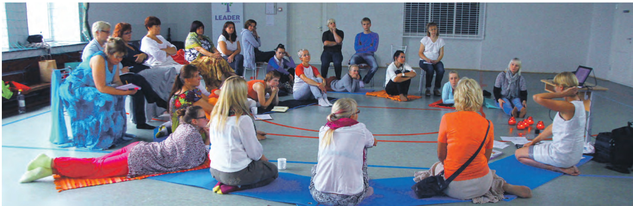
Suveseminari vestlusring osutus positiivselt suureks.

A ugustikuu on periood, mille jooksul paljud inimesed ja organisatsioonid teevad ettevalmistusi ja tegevusplaane uueks hooajaks. Planeerides oma tegevusi, on hea kaasata partnereid. Koos tegutsedes on tulemus parem, nagu ütleb ka aafrika vanasõna: „Kui soovid edasi liikuda kiiresti, mine üksi. Kui soovid jõuda kaugele, liigu mitmekesi.”