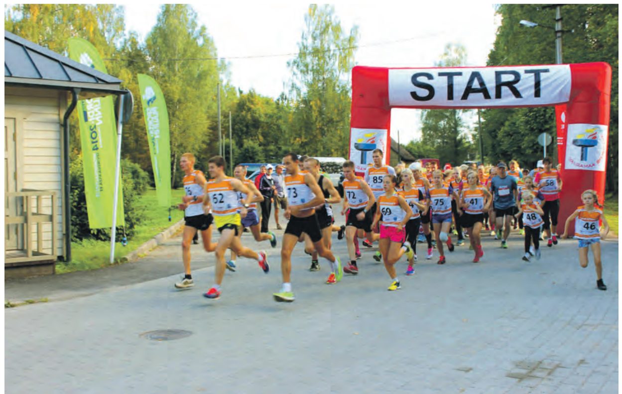
Nagu tavaks olid stardirivis eespool need, kel võidumõtted peas.

31. Tõrva Kolme Järve Jooksu korraldasid Tõrva Spordiselts, liikumissari Meie Liigume, Tõrva Gümnaasium ja Valgamaa Spordiliit. Võistluse läbiviimist toetasid Tõrva Linnavalitsus ja Eesti Kultuurkapitali Valgamaa Ekspertgrupp.