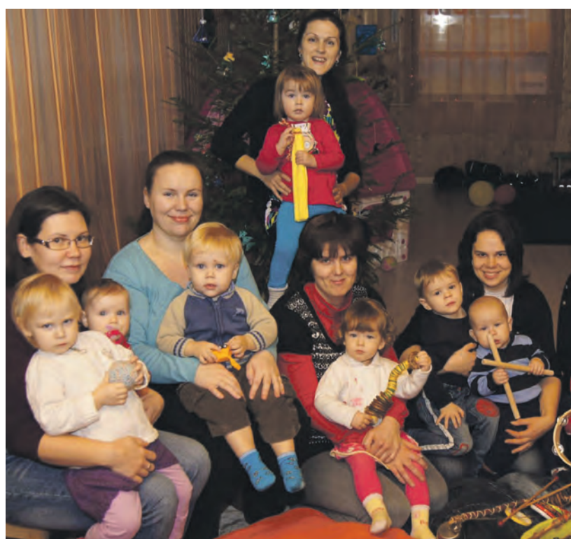
Lustakad lapsed koos emadega muusikatunni jõulupeol.