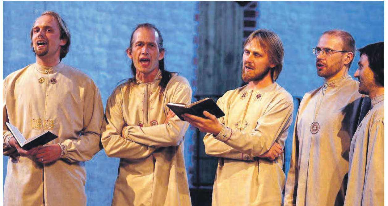
Ansambel Triskele tuli kokku juba 1997. aastal Tartus.

Eesti Vabariigi ajal oli luterliku koguduse liikmeid 12 000. Vabadussõja ajal 1918.-1919.aastal sai kannatada vennastekoguduse palvemaja. Aga Teise maailmasõjas 21.septembril 1944 pommitati taas Helme kihelkonna kirikut. Varemmed seisavad