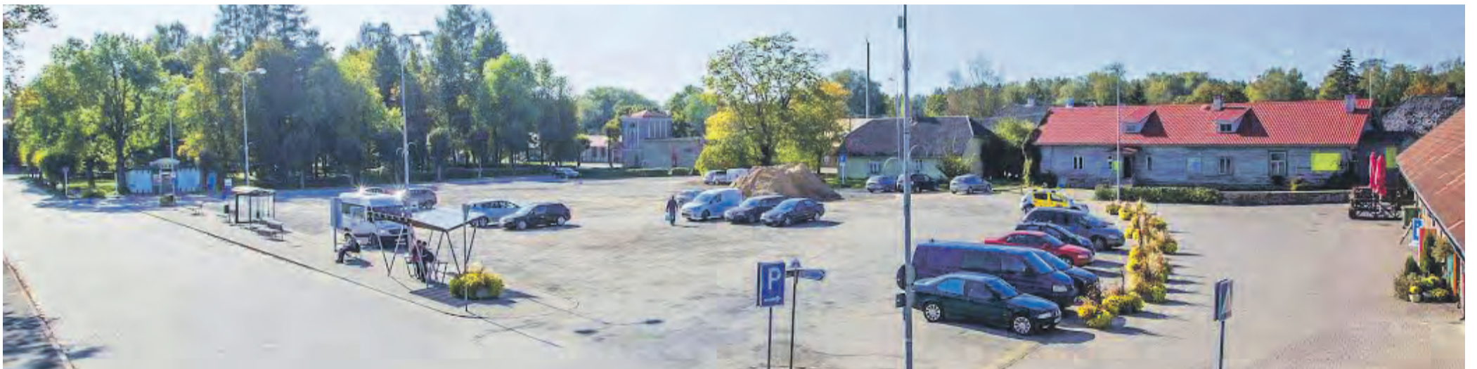
Kui head ideed teoks saavad, on Tõrva keskväljak uues kuues aastaks 2018.

Tõsiselt plaani linna üks suuremaid murekohti lahendada näitab ka see, et Tõrva on esimestes seas Eestis, kes ideekonkursi välja kuulutas.