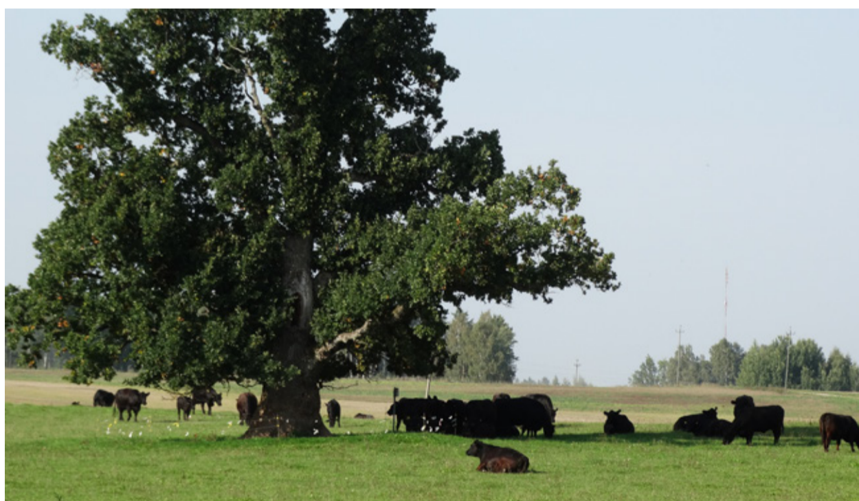
Vilsi ohvritamme laia võra jahe vari meelitab kuumadel pilvitutel suvepäevadel kariloomad põlispuu alla. Tamme tüve kaitseks on selle ümber seatud elektritara.

2012 aasta kulus suurelt osalt laudahoone korrastamisele ja rohumaaade rajamisele ning aasta lõpus osteti 17 aberdiini-anguse tõugu lehmvasikat. Järgmisel aastal lisandus karja veel tosin noorloomu. Samal aastal renditi pull ja juba aasta pärast veebruarikuus nägid ilmavalgust esimesed vasikad. Sellest alates enam karja täienduseks vasikaid ei ole oste-