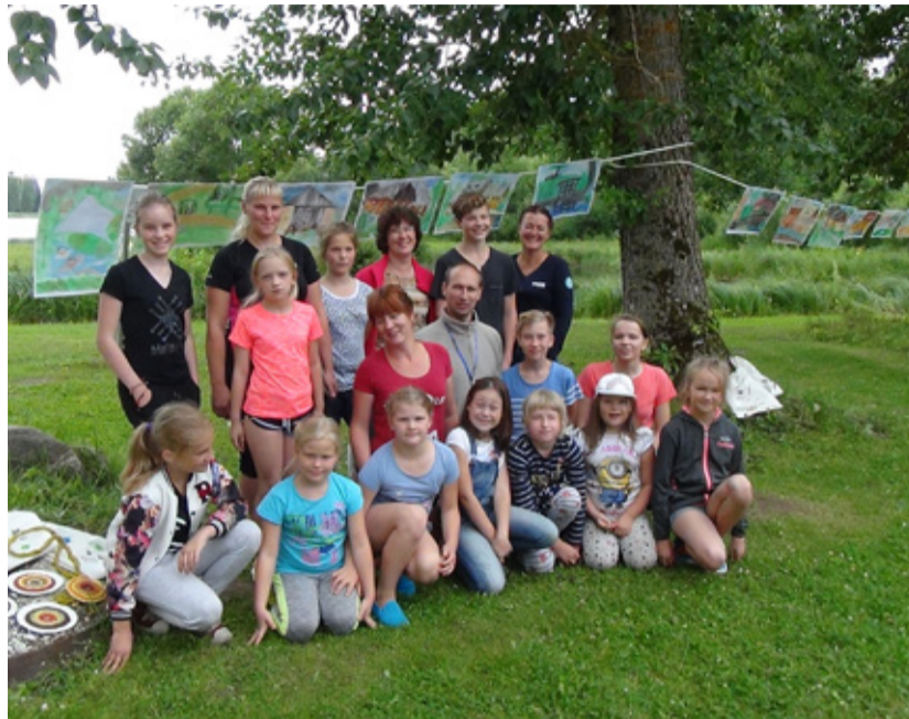
Kunstistuudio liikmed nautisid suvepäeva.

oma tööd ja neid täiendati ning viimistleti. Valminud tööd seati kokku väike näitus veskiäärde. Osa pilte kingiti veskiemandale!