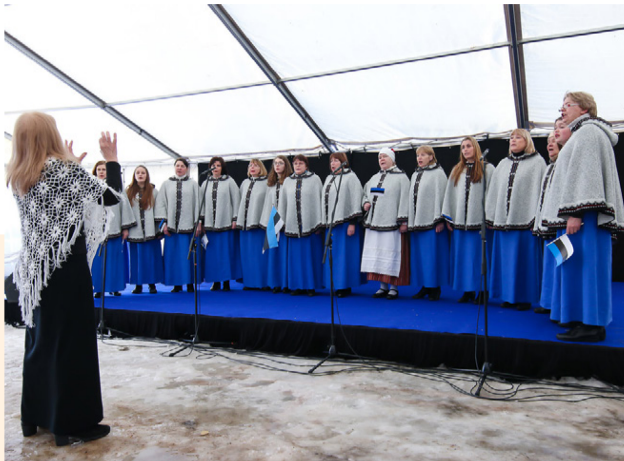
Tõrva Kammer naiskoor esinemas EV 100 juubeliüritusel.

RIINA VIRKS: „Minu jaoks oli ja jääb hooaja kõige olulisemaks sündmuseks võistulaulmine ja seal saavutatud 2. koht C-kategooria nais-