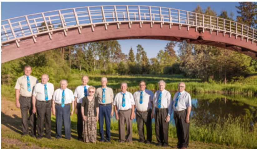
Meesansambli häälid helisevad juba pool sajandit.

Ansambli üks esimesi laule (A. Pastoriuse „Muinaslood“) oleks nagu vihjanud juba siis tõigale, et poisid on sattunud võlumaailma, kust pole enam väljapääsu leida. Sedapsi ongi läinud. Enamuses ansamblites on selle aja jooksul nii juhendaja kui koosseis mitmeid kordi vahetunud. TMA-i kohta kirjutab kroonik mitte ammu: „Meie suurim kordaminek on selles, et oleme ikka veel laval ja sealjuures ei ole meie koosseis olulisel määral muutunud“. Täna peab siiski nentima, et see pilt on veidi muutunud. Maestro ja neli laulumest istuvad nüüd saalis, kuid kolm baritoni püsivad endiselt „võimul“ ega kavatsegi tagasi astuda.