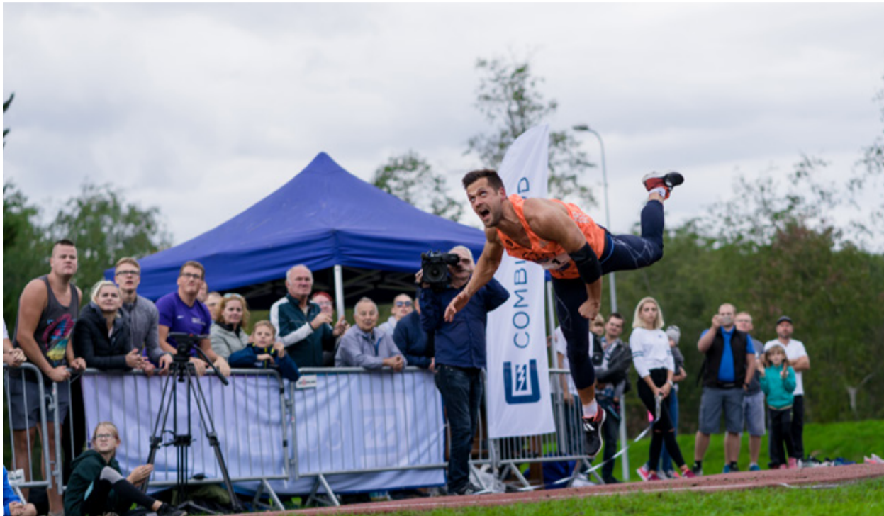
Magnus Kirt võidutses talle omasel moel.