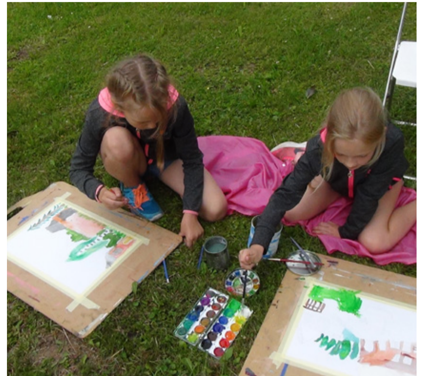
Kunsti tehti nii õues...