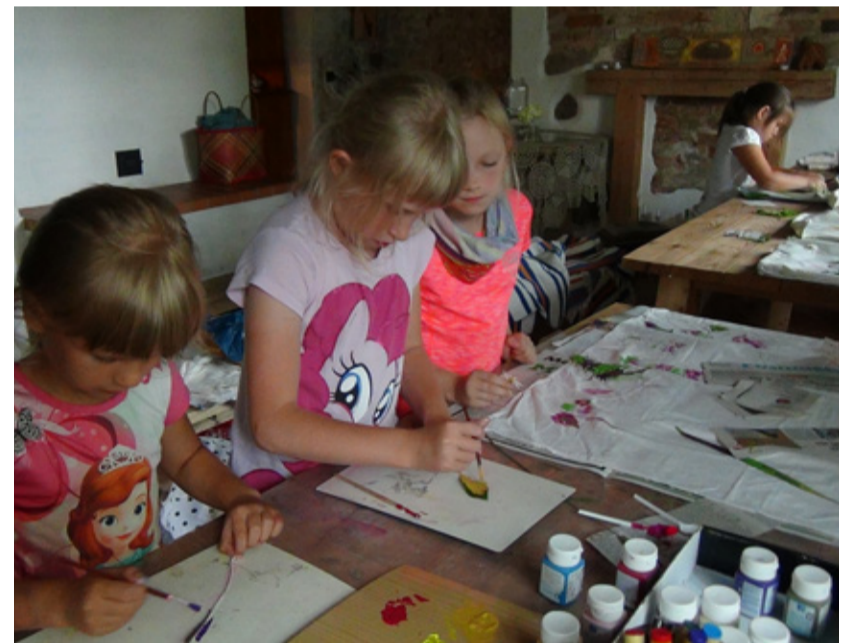
... kui ka tubastes tingimustes.