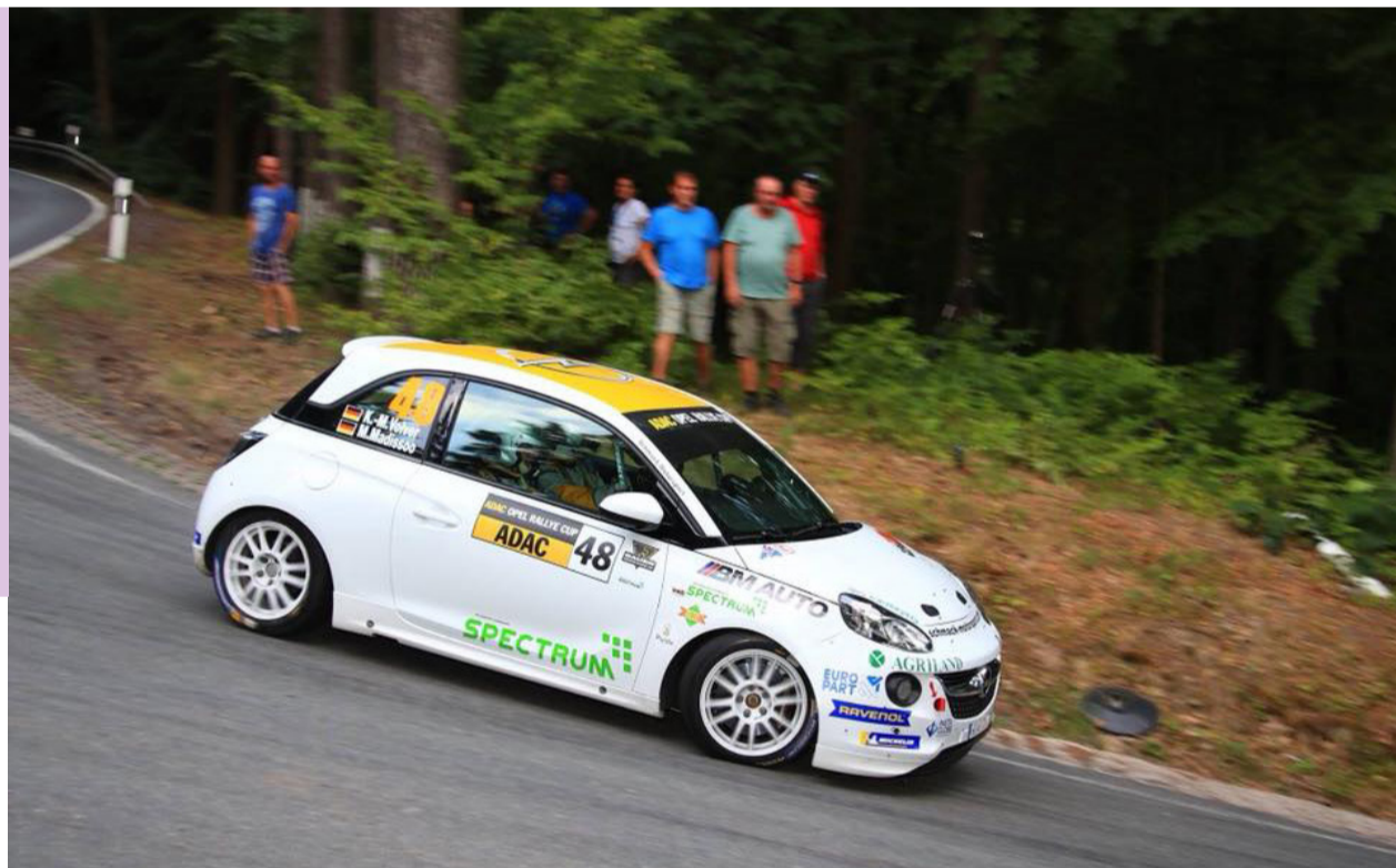
ADAC Opel Rallye Cupi kokkuvõttes ollakse kolmandal positsioonil.

Teisele ringile läksid mehed hea tundega. Hoolduses tehti autole vajalikud parandused ja seadistused ning sõitjate tuju oli hea. Tulemuseks päeva viiendalt kiiruskat-