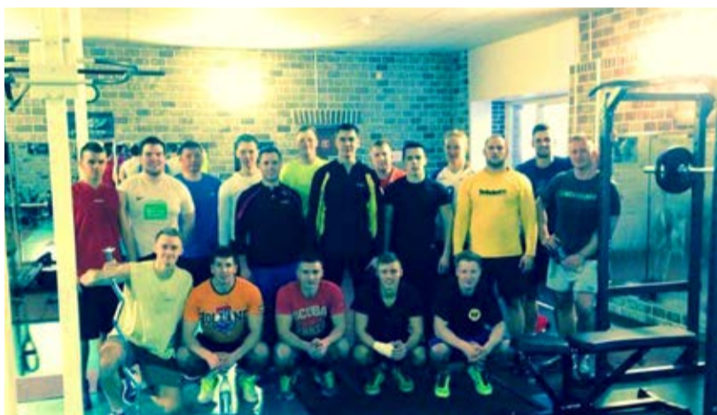
Spordiklubi on loodud treening- ja puhkevõimalused nii meestele kui naistele.