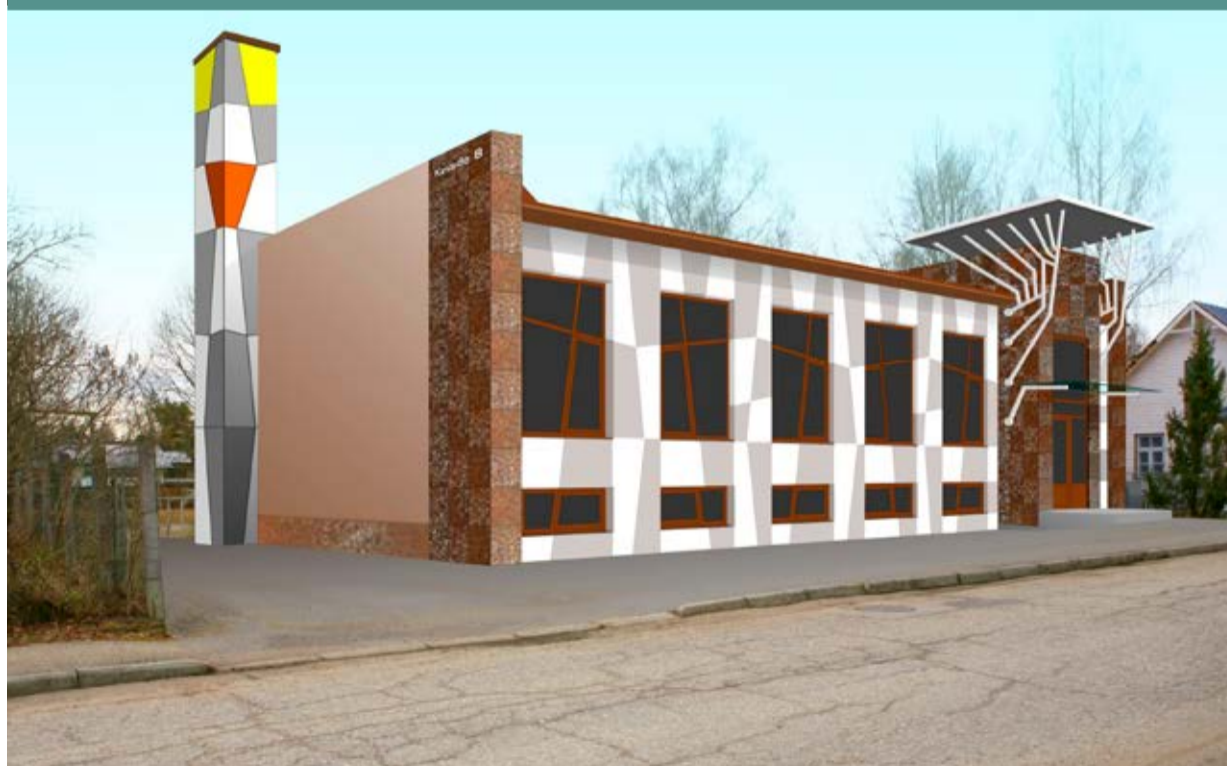
Päevinäinud hoone puhul oli juba eskiisi vaadates näha silmapaistvaid lahendusi.