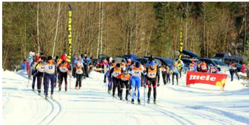
Loodetavasti tänavune Härma suusamaraton lumepuuduse tõttu ära ei jää.

Näiteks on ju Tõrva tuntud kui maailmaklassi odaviskajate sünnilinn, Tõrva gümnaasiumis õpivad väga andekad iluvõimlejad ja lootustandev autoralli sõitja. Kind-