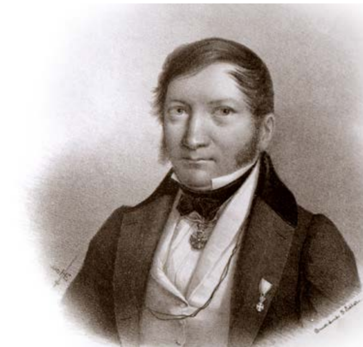
WILHELM STRUVE Tartu Ülikooli professorina, Tähetorni direktorina ja 12 lapse isana 1830. aastail.