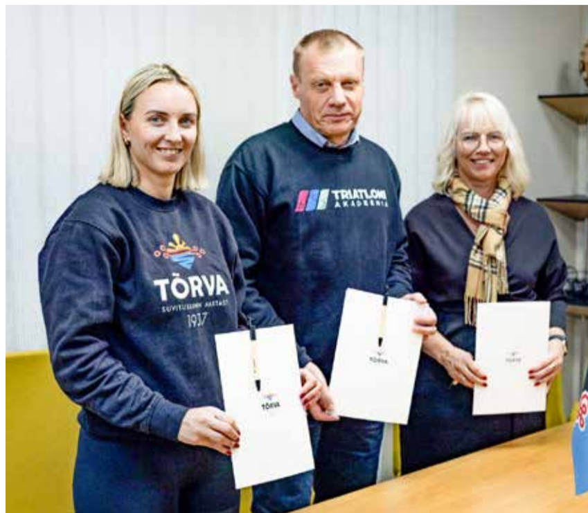
Suvine spordisündmus sai kõigi osapoolte allkirjad.

„Soovime Tõrva tuua rohkem sporditurismi – triatlon oma üle-eestilise harrastajaskonnaga on selleks suurepärase võimalus. Lisaks tähistame järgmisel aastal Tõrva 100. sünnipäeva ning meil on hea meel, et saame juubeliaastal