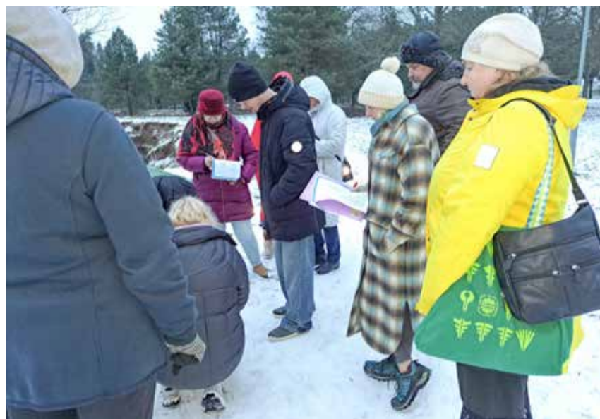
Seminaril osalemine sisaldas ka välitöid.

2025. aasta tegemistest ning ühine edasiste ja arenguplaanide loomine aastaks 2026. Aastaseminaril eesmärk oli tugevdada ühist GLOBE kogukonnatunnet ja süvendada teaduspõhist haridust Eestis.