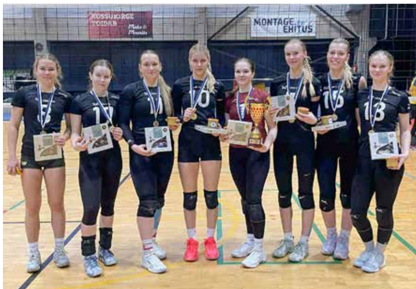
Noorusliik Tõrva VK I võistkond oli kõikides mängudes väga kindel.

Kuldmedalid võitis suurepärasest kok-kumängu näidanud Tõrva Võrkpalliklubi I võistkond, mis koosnes peamiselt U20 vanuseklassi neidudest. Läbi turniiri näi-dati heal tasemel rünnakut ja kaitsemän-gu, head koostööd ja võistlushimu. Kõik kohtumised võideti tulemusena 2:0.