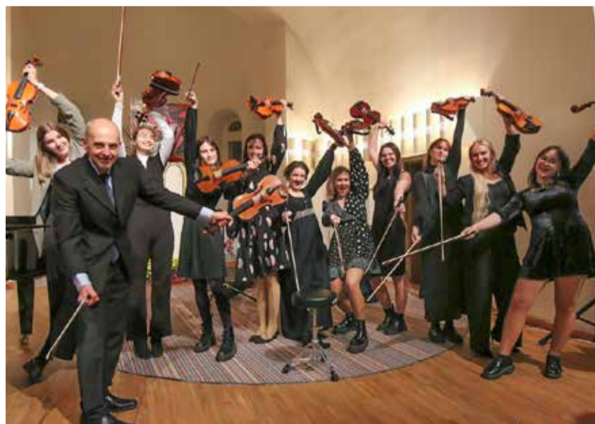
Maha sai peetud pidu täis muusikat.

Nüüdseks on Tõrva Muusikakool saanud 40-aastaseks. Koolikollektiivi sooviks oli tähistada auväärseks ikka