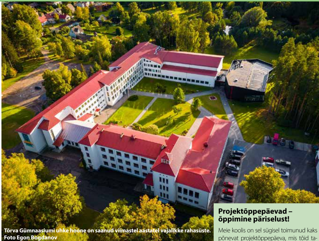
Tõrva Gümnaasiumi uhke hoone on saanud viimastel aastatel vajalikke rahasüste.

Projekti hinnanguline kogumaksumus on 1 584 000 eurot, millest toetus moodustab 1 092 000 eurot ja ülejäänud kaetakse Tõrva vallaelarvest.