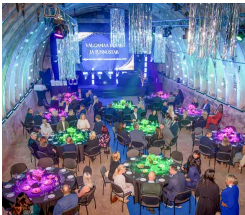
Raketebas oli ürituseks piduhteis.

Eriauhind Eriliste Elamuste Pakkuja rändas samuti Tõrva ja selle võitis Kaa-siku Talu loomaaed. See on ettevõtte, mis ei jäta kedagi külmaks – sellest vai-