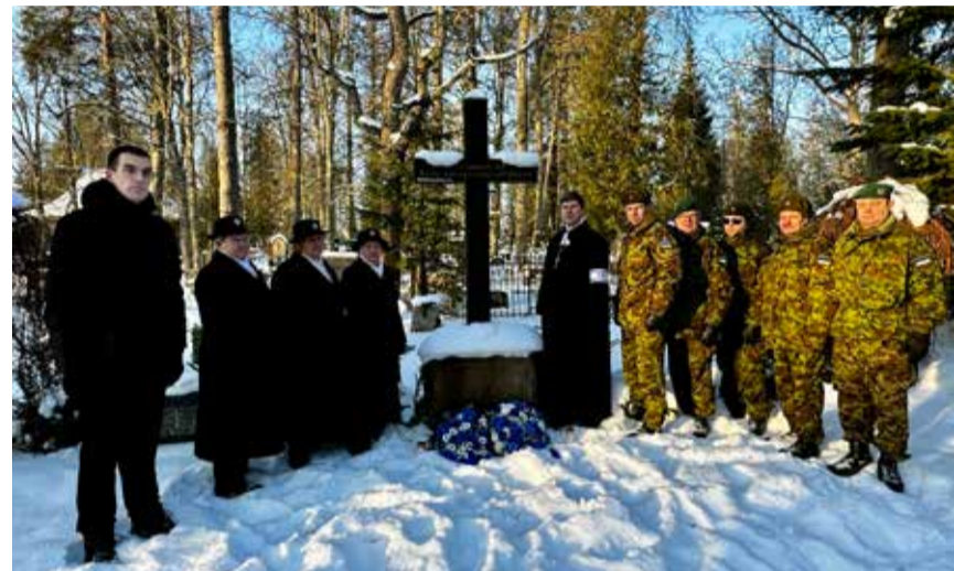
Mälestustseremooniatel on kohal kirikuõpetaja, kaitseliidu ja kodukaitse liikmed ning volikogu ja vallavalitsuse esindajad.

15. juulil 1940 vabastasid okupatsioonivõimud Aleksander Jaaksoni Sõjavägede Staabiülema kohalt, peale mida siirdus ta Mulgimaale Helme kihelkonda oma Pokardi talu. 18. oktoobril 1940 arreteerisid võõrvõimu käsilased ta Pokardi talu põllul ja viisid 26. juunil 1941 Venemaale. Jaakson suri Venemaa vangilaagris 1942. aastal.