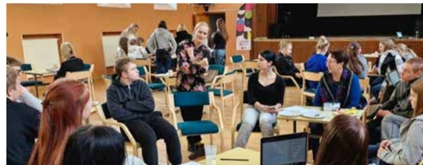
Projektikoolituse viis läbi Valgamaa Arenguagentuur.

Tõrva Gümnaasiumi noored soovivad käivitada õpilaste juhitud meediaklubi, mis ühendab koolitelevisiooni, -raadio ja -ajalehe. Projekti raames läbivad noored ka vajalikud koolitused, et filmimise, monteerimise ja intervjuerimise oskusi omandada. Nii soovitakse õpilastele anda