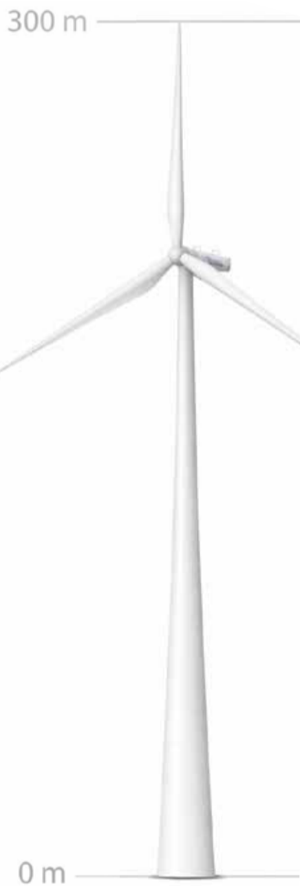
Tuulikute labad ulatuvad kuni 300m kõrgusele.

Kavandatav tuulepark annaks 8...11% sel aastal valitsuse poolt heakskiidetud energiamajanduse arengukava ENMAK 2035 kohasest juurde vajatavast maismaa tuuleenergiast.