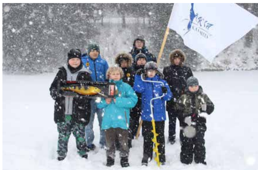
Noored hakkamist täis kalamehed trotsivad ka pakaselisemat ilma.

Lisaks talvisele Tõrva Tirk võistlusele on samanimeline üritus kavas ka kevadel ning see kannab järjekorranumbrit 16. “Maikuu on plaanis castingu -võistlus Hummulis, septembris haugipüük ja püüghihooaja lõpetame oktoobris Hummulis. Aasta võtame kokku traditsioonilisel jõulupeol,” loetleb Pärn võistluseid ja muid tegevusi. Klubi tänavune uhkeim ettevõtmine on ilmselt aga 13. juunil Pikasillas toimuv suur jaanituli, kus hommikul selgitatakse röövkalapüügi kuningas. Seejärel jätkub päev nii rahvalikemate spordivõistluste ja rammumehega ning õhtu kulminatsiooniks on suur jaanimõll ansambli ja tantsutruppidega.