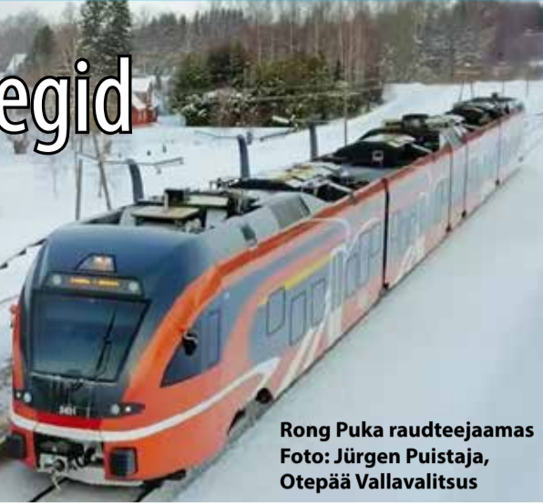
Rong Puka raudteejaamas

Otepää, Tõrva ja Valga rongi- ja bussiliikluse muutused teevad Lõuna-Eesti inimeste igapäevaelu raskeks ning selle parandamiseks tegid kolm Valgamaa valda ka ühispöördumise Regionaal- ja Põllumajandusministeeriumile.