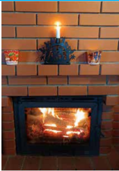
Elav tuli toob valgust ja soojust.

Küünlapäeval pühitsemise kirikus küünlaid iseendale, ristitavate Jumala