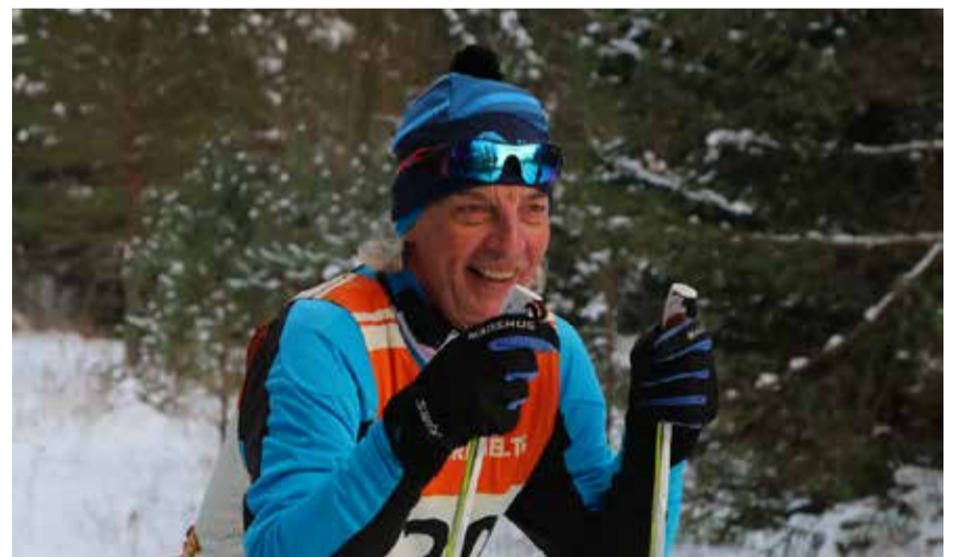
Suusarõõmu jagus tänava küllaldaselt

Kiire ja täpse ajavõtu eest hoolitses MTÜ Tõrva Spordiseltsi pikaajaline