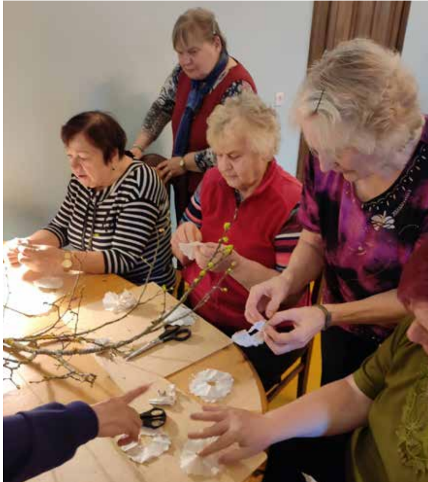
Koos käiakse suisa kaks korda nädalas.

proovisin vana rada edasi käia, kuid ajaga tuleb siiski kaasa minna. Liikmeskond vahetub, vanemad kaovad eest ning uued ja nooremad tulevad asemele. Me käime koos kaks korda nädalas, esmaspäeviti ja kolmapäeviti. Vahepeal tundu, et kolmapäevi võiks olla igas kuus topelt, kuna üritusi on nii palju, et päevadest tuleb puudu. Me tähistame nii kalendri- kui ka riiklikke tähtpäevi, õnnitleme sünnipäevalapsi, korraldame infopäevi, kuhu kutsume rääkima erinevate alade inimesi, teeme küpsetiste ja hoidiste konkursse ning korraldame sõpruskohtumisi teiste ühingute liikmetega. Huvitavad on viktoriini- ja huumoripäevad ning laumängude päevad. Suvised piknikud on meil alati oodatud ja rahvarohked, samuti sõidud nii kevad- kui sügislaadadele ning ka teatrietenduste külastamine ja laevareisid nii jõel, järvel kui lähel. Väga oodatud on ekskursioonid, kuigi oleme kogu Eesti läbi sõitnud, siis ikka