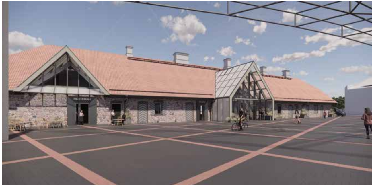
Kuigi arvamusi vana ja uue ühildamises oli tõrvakate seas mitmeid, jäi peale antud lahendus. Visuaalid: Apex Arhitektuuribüroo

Lepingu allkirjastamine toimus kõrtsihoone ees, kus ajalooõnguline Tõrva Tõnis ja tänapäevase ehitusettevõtte eestvedaja löid tunnistajate ees käed ning kirjutasid kokkuleppele alla.