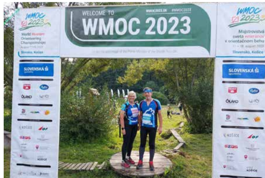
Elukaaslasega koos osaletakse ka orienteerumise tiitlivõistlustel üle maailma.

Kindel on see, et päris seisma ma jääda ei taha. Mul on väike hobitalu, kus tegevusest puudust ei tule, ning pere ei lase samuti mugavustsooni langeda. Mul on neli rõõmsat lapselast, kellele tahan olla hea vanaema ja kes utsitavad mind liikuma. Tegevust jagub!