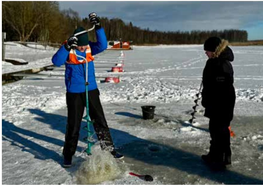
Külmakraadid lubasid ka jäiseid alasid kavasse võtta.

Esimene osavõistlus valmistati ette koostöös Tõrva Kalameeste Klubi, mistõttu ühendas teatevõistlus kalastamise ja talispordi elemendid. Esimeses vahetuses tegid kaks viieliikmelise võistkonna liiget koostööd: üks suusatas ja vedas lahti viskeliini, teine andis nõõri järele ja keris selle kokku. Kolmas võistleja jooksis lumes ja sooritas riidest kalaga täpsusviske, mis andis punkte kalaviske arvestusse. Pärast järgmist vahetust läbis neljas liige tõukekelguga võistlusmaa ja viimases vahetuses tuli ämbriga joosta Väike-Emajõe jääle, puurida kohtuniku kontrolli all jääpuuriga auk, see puhastada ja finišisse suunduda.