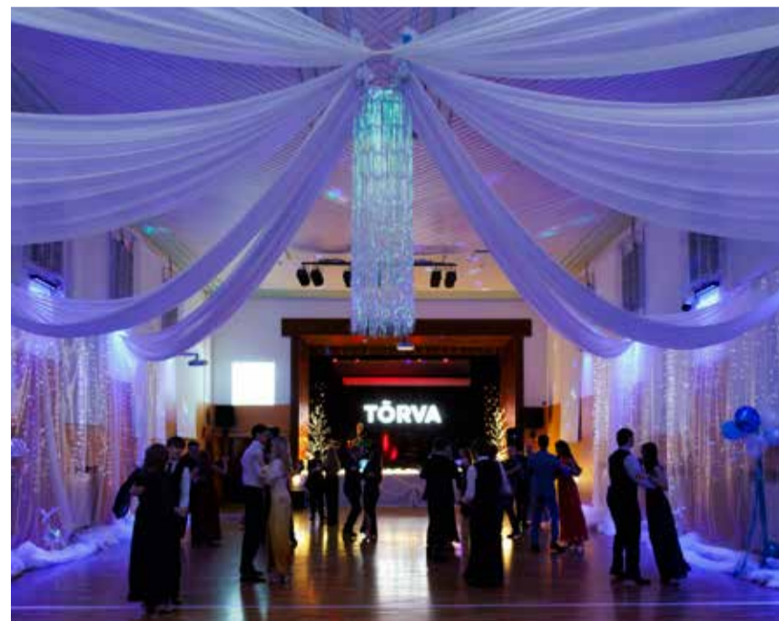
Gümnaasiumi saal oli balliks piduehtes.

20. veebruaril toimus Tõrva Gümnaasiumis talveball, mis täitis koolimaja piduliku meeleolu, sära ja rõõmsate emotsioonidega. Õhtu tõi kokku nii õpilased, õpetajad kui ka külalised, et ühiselt tähistada enneolematut sündmust.