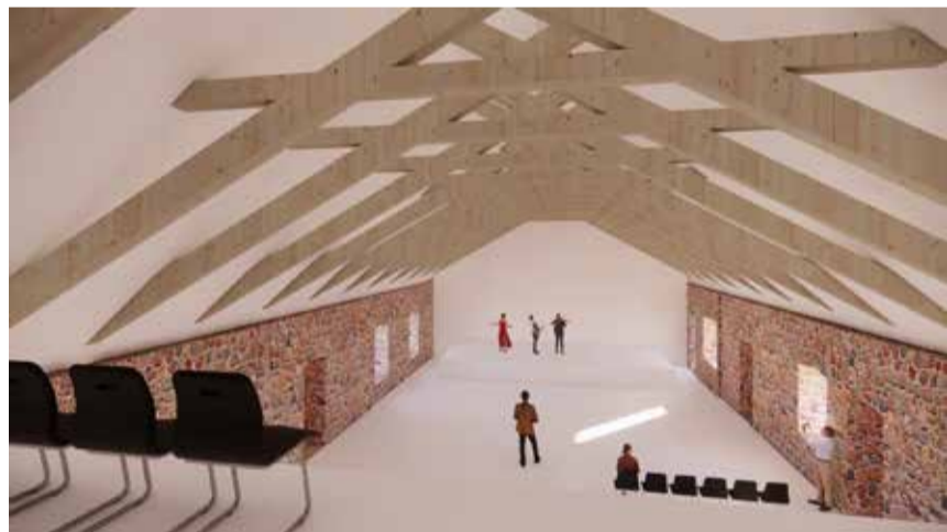
Selline näeb välja hoone siselahendus.