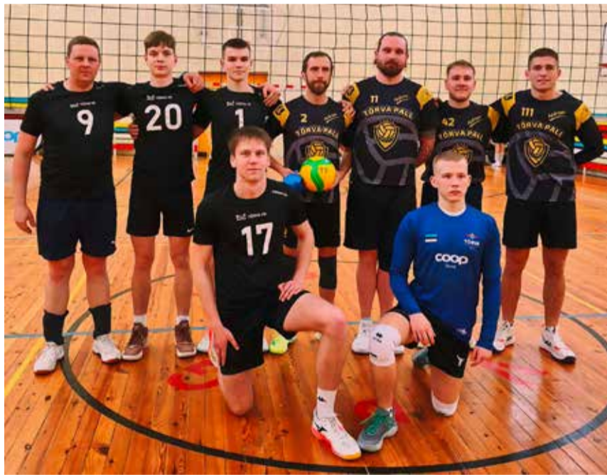
Tõrva Pall ja Tõrva VK on tänavu võrkpalliväljakutel jõud edukalt ühendanud.

See tähendas, et II grupis (5001–8000 elanikuga vallad) oldi võrkpallis üldkokkuvõttes parimad.