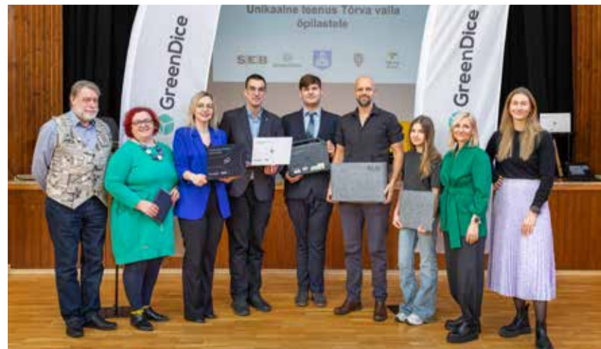
Pilootprojekt sündis paljude osapoolte koostöös.

GreenDice'i pakutav teenus ei piirdu vaid seadmete vahendamisega – teenuse raames kaasajastatakse haridusasutuste pilveserverisüsteemid, luuakse õpilastele turvalised kasutajaprofiilid ja hoitakse ajakohasena vajalikke poliitikaid. Lisaks tagab GreenDice õpilastele IT-tugiteenuse, mis garanteerib operatiivse toe