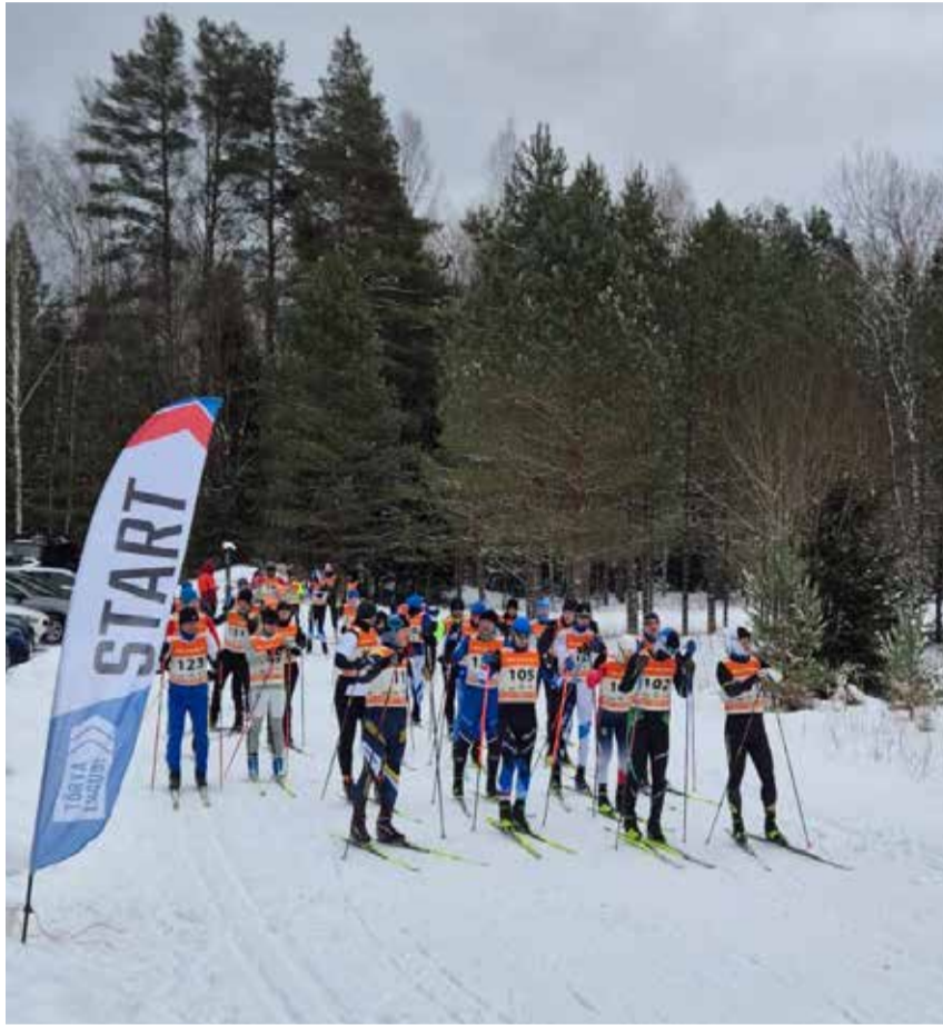
Maratonirajale läks 37 vaprat suusatajat.

Tänavune suusaseriaal sai alguse 11. jaanuaril – ikka samas formaadis nagu paaril varasemal aastal ehk igal pühapäeval oli start avatud 2 tundi ja nii said suusasõbrad omale sobival ajal suusadistantsi läbida. Erinevatel vanuseklassidel olid eri pikkusega suusasõidud. Kolmel esimesel ja viimasel osavõistlusel osales iga kord enam kui 80 suusasõpra. Vaid neljas suusapäev jäi toimumata: hommikul oli termomeetri näit enam kui 20 miinuskraadi. Kokku sai tulemuste Tõrva Suusaseriaalil 2026 kirja 132 suusatajat. Suusaseriaalis sai osaleda ka vabaklassis, kus aega ei võetud ja paremusjärjestust ei selgitatud –