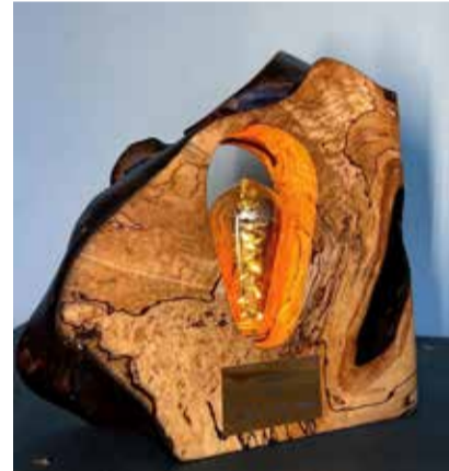
Valmistatud on omapäraseid auhindu.

Leesment tunneb igatahes uue karjäärivaliku puhul rahulolu ning ka tellimusi õnneks jätkub. Kaugemad paigad, kuhu tema kädetöö on jõudnud on suisa Lõuna-Korea ja Jaapan. Ideedest ning plaanidest, kuhu edasi areneda, hakkamist täis mehel puudust kindlasti ei tule.